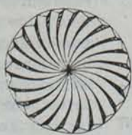
Javier Aizarna Azula