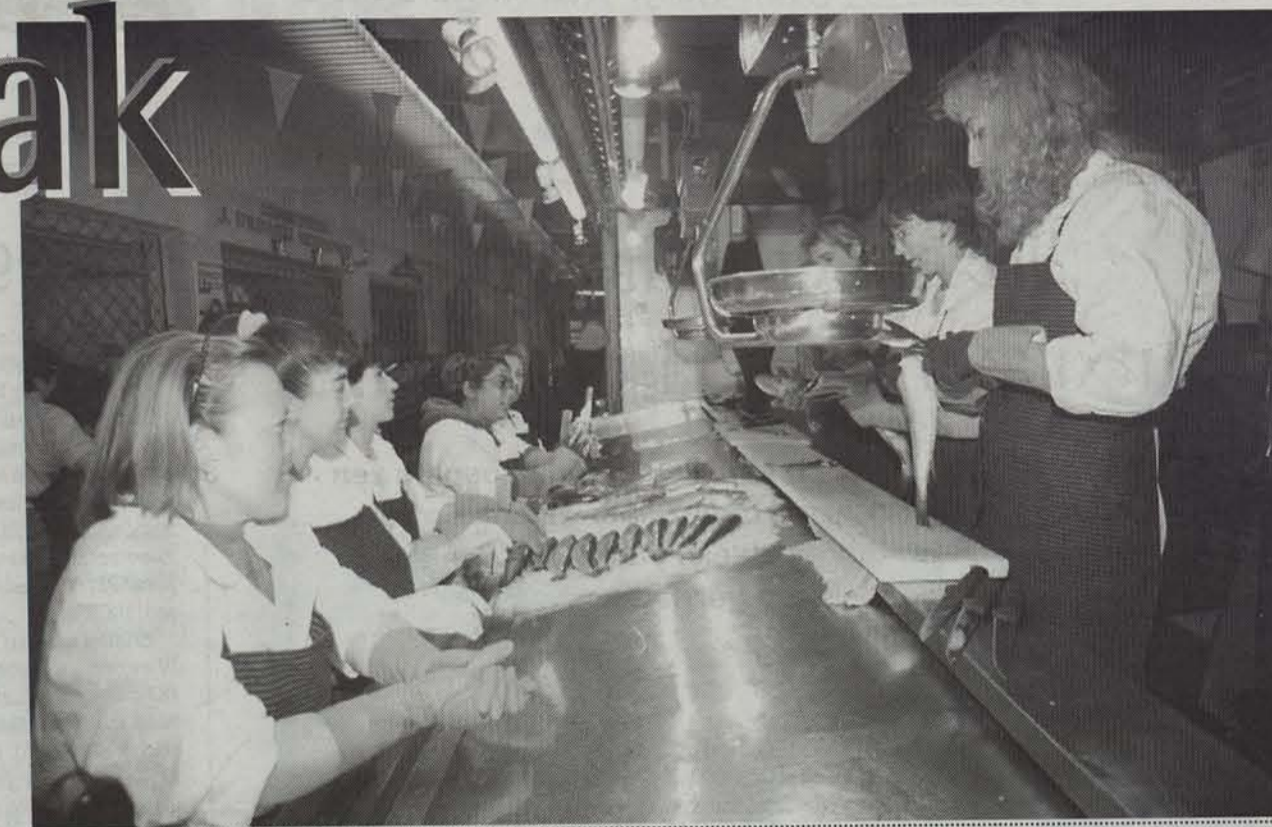
Emakumeak arraindegiko lanean trebatzen ari dira.

Prozesu guzti hori iragan ondoren, egun lanean hasi aurreko prestakuntza aurkitzen diren talde ezberdinak. Horietako bat da II Zabalaguneko merkatuan astean lau aldiz arraindegiko martxa nola