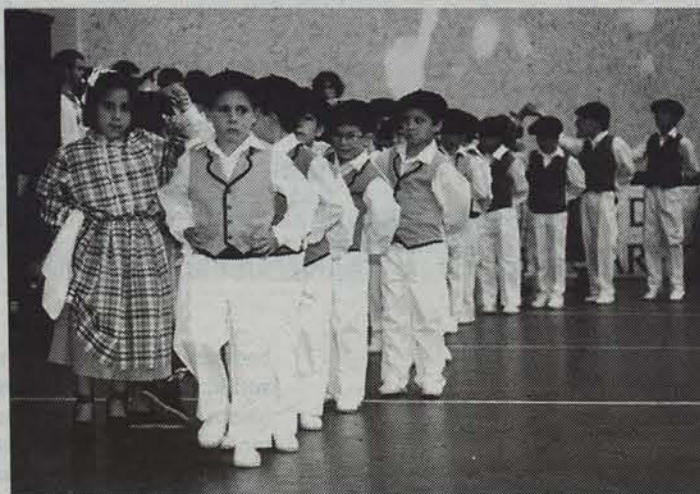
Goizean auzoz auzo ibiliko dira dantzari ttikiak Beran, eta arratsaldean politalekuan bilduko dira.

Arront errotua dagoen jaialdia eginen da igandean Beran Gure Txokoa dantza taldeak antolatuta: dantzari ttiki eguna. Oraindik ospakizun berria bada ere, urterik urte jende gehiago biltzen duen ikuskizuna da.