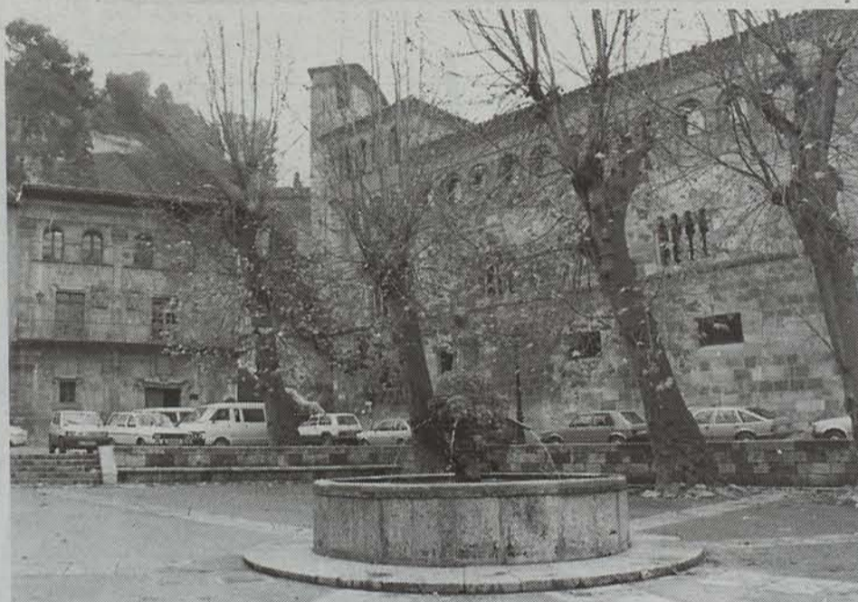
Donejakue Bidearen Lagunek antolatu ohi dute urtero Lizarrako Sefardi Astea.

Iragan astean egin da Lizarran VI. Sefardi Astea, hainbat ikerlariren partehartzearekin. Gaur iluntzean amaiera ekitaldia izanen da, abesti sefardiarrak dituen kontzertu batekin.