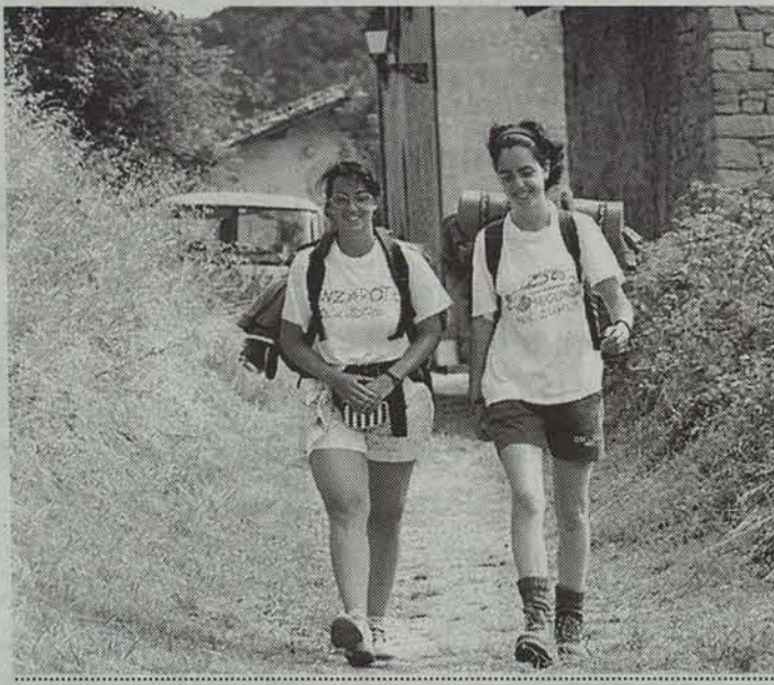
Hainbat erromes iragan dira Lizarratik udan.

Uztailean 6.000 lagun inguru bildu ziren Lizarrako Turismo Bulegora. Joan den urteko datuekin alderatuz gero, aurten kopurua igo egin da, Egako hiriak 2.500 bisitari gehiago izan baititu.