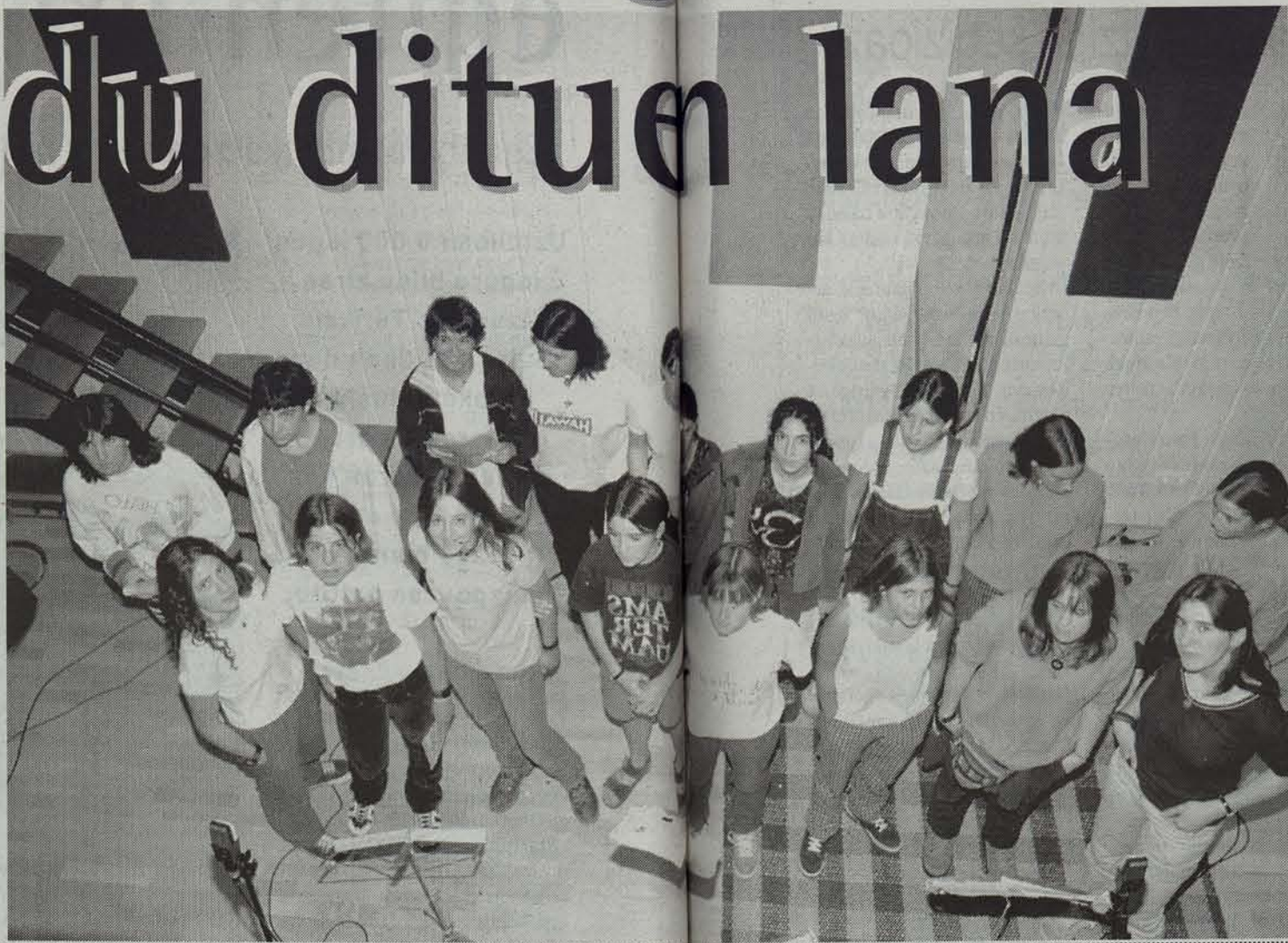
Diskaren lehenesten grabatzen, Aralar Udala Musika Eskolako ikasleak.

egiteko diskaren arrabaldiak nahi lukete, eta Rriskitin ataratuak diren diskaren proiektu kulturalak behintzat ez zaizkie finkatu. Beteluko dantza domoan litzuzkeen diskaz hitz egin zuzendariak. «Orain gutxi bitartean mailan geratu da dantza arloan Araitzen ere beste proiektu polita. Dan- gari dira bailara horretan dantza kaleratzea espero dugunak gure kulturaren intxurak zabaltzerantz urrutira ez dela joan. Baina hori, orainoz behintzat, beste- berik ez da.