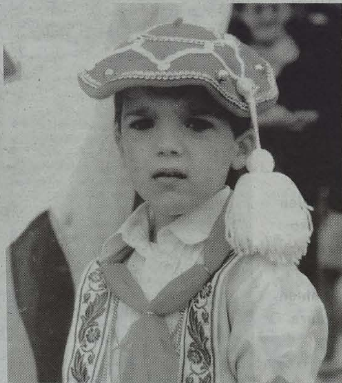
Berako Gure Txokoa taldeak nazioarteko jaialdian dantzatuko du.

Bidasoako Nazioarteko Dantza Jaialdian, dantzari gazteak ariko dira bihar Beran. Hamabi-hamasei urte arteko sei talde ibiliko dira herrian, goiz eta arratsalde.