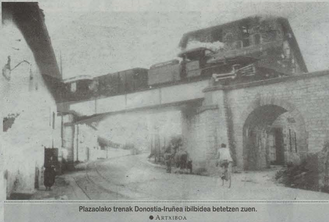
Plazaolako trenak Donostia-Iruñea ibilbidea betetzen duen.

1993an aurkeztu zuen Plazaola Partzuergo Turistikoak, Madrilen, trenbidea berreskuratzeko proiektua. Azkenik, badirudi gauzatuko dela Partzuergoaren asmo nagusietakoa.