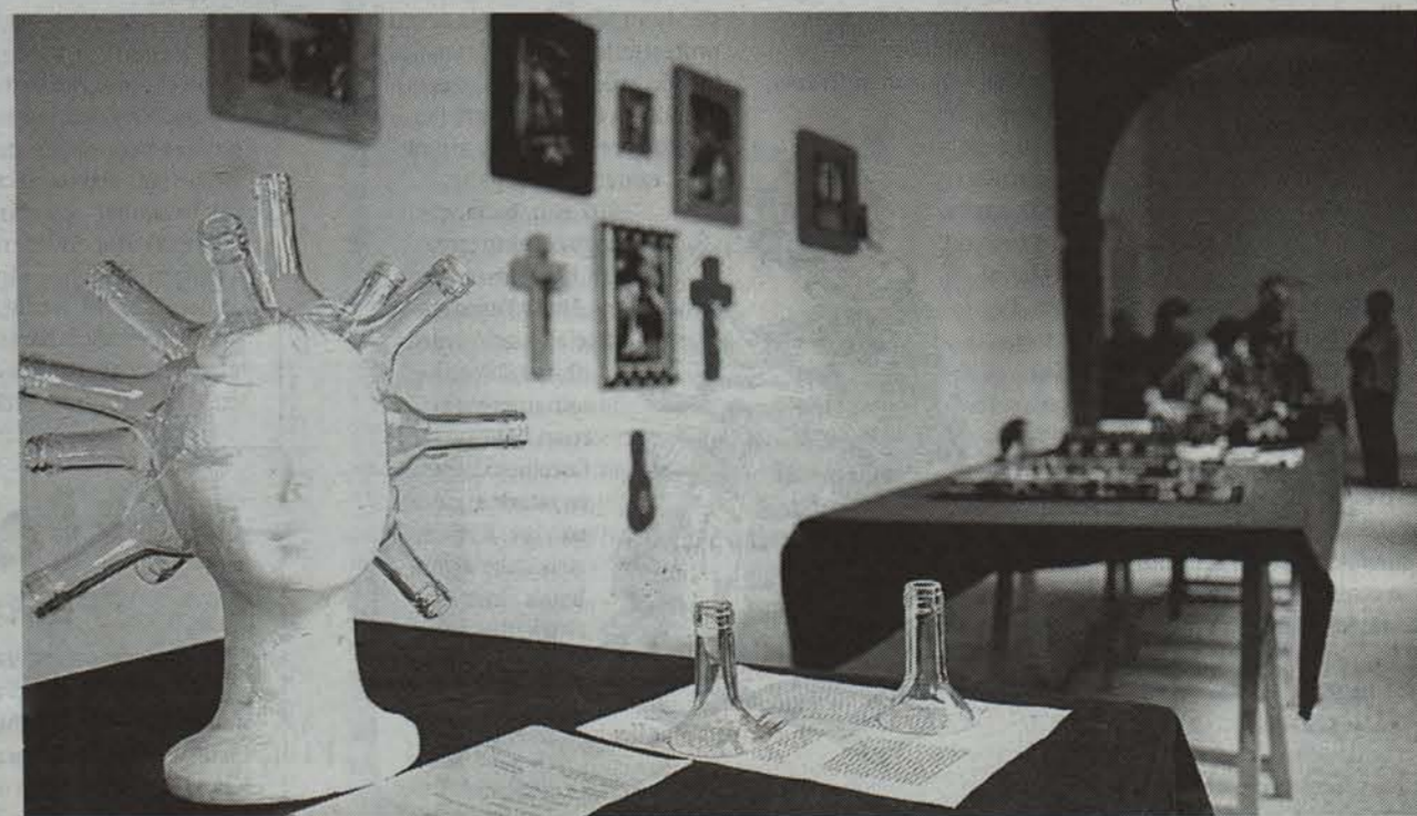
«Zabor-art» erakusketak Urdazubian egon eta gero, gaur zabalduko da Elizondon. • MIKEL SAIZ

Jaialdian barruan antolatu diren garrantzitsuenak Bidasoaldeko Filme Laburren I. Lehiaketa. Ekitaldia irailean 7tik 10ra egiten da eta lau herrietan antolatuko da: Elizondo, Doneztebe, Lesaka. Zinemaldiko garrantzitsuenak Lehiaketa izanen da, baina beste batzuk ere emanaldiak, topaketak eta erakusketak zinemaldiak 10 milioi pezeta aurrekontua du (400.000 bideo kopia behar du izateko) eta 7a baino lehen behar dira Bertizko Partzuergoaren irabazleak urrezko irabazleak 10 milioi bat pezetako saria eta sariaren %50 Bidasoaldeko Bertizko Par-