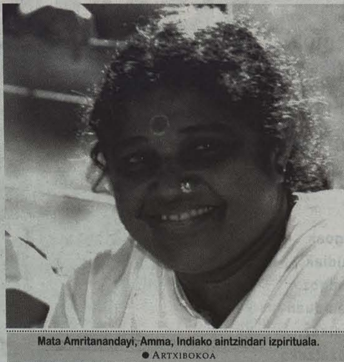
Mata Amritanandayi, Amma, Indiako aintzindari izpirituala.

Mata Amritanandayi, Amma, Indiako aintzindari izpiritualak Lizarran egingen du bere darshana hilaren 23an eta 24ean Onzinedako estalkian.