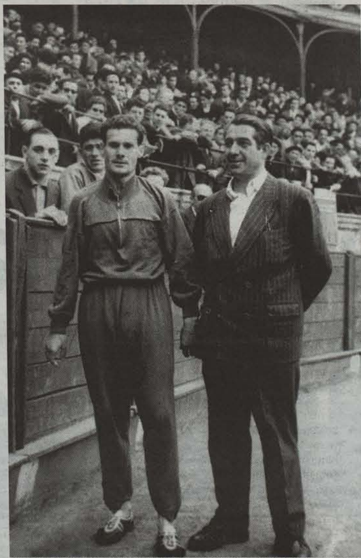
Arruizko Txikia lasterkaria ere agertzen da erakusketan. ● URKO ARISTI

Aizkolariak, harrijasotzaileak eta beste gaur egun ere ezagutzen ditugu, baina badira beste herri kirol batzuk denboraren poderioz desagertu direnak. Ezagutzen ditugun horiek nondik datozen, eta tamalez gaur egun irauten ez duten beste horiek nolakoak ziren ezagutzeko aukera dugu Ibiltarien