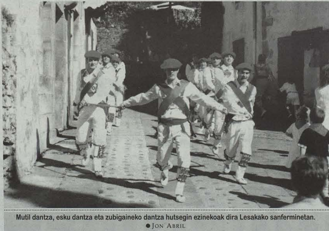
Mutil dantza, esku dantza eta zubigaineko dantza hutsegín ezinekoak dira Lesakako sanferminetan.

Inoiz baino sanfermin besta luzeagoak izanen dituzte lesakarrek aurten. Ohi bezala, musika, dantzak eta kaleko giroa gailenduko dira astebetetz.