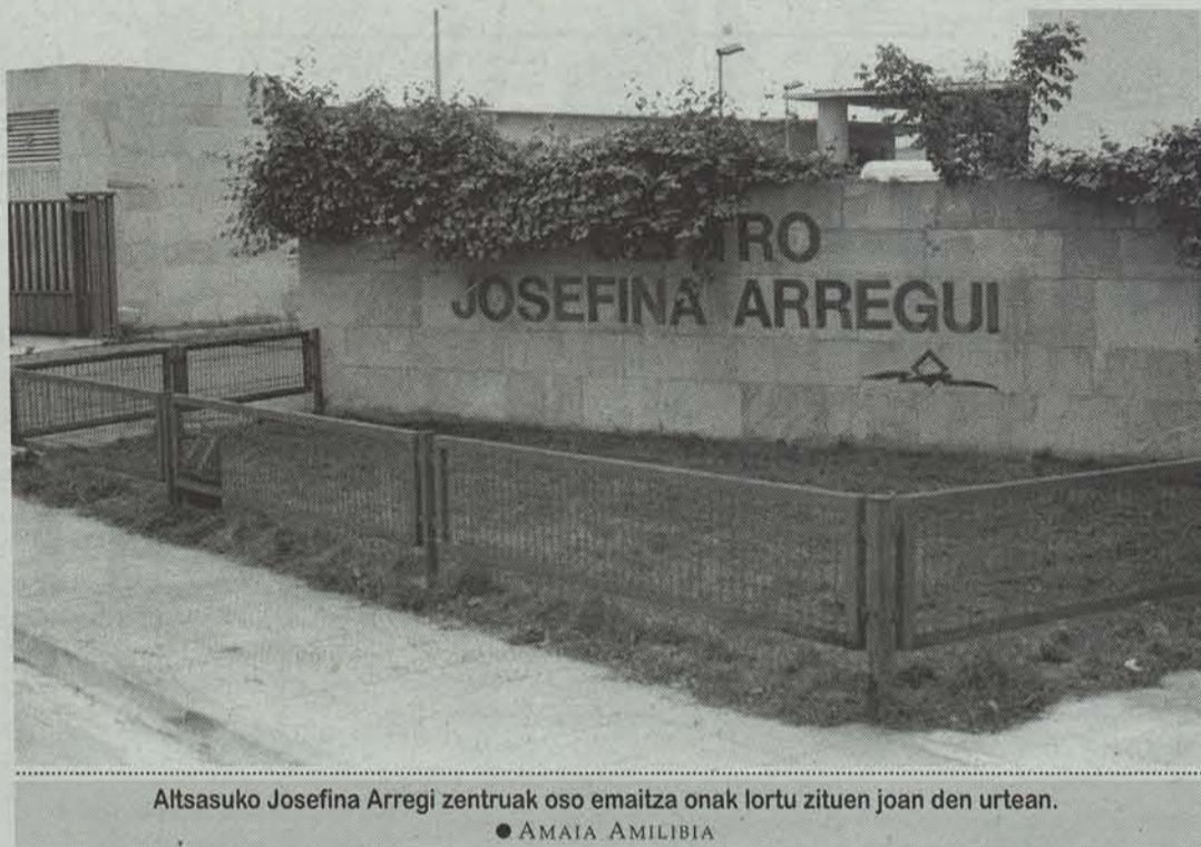
Altsasuko Josefina Arregi zentruak oso emaitza onak lortu zituen joan den urtean.

Josefina Arregi psikogeriatrikoak eskaintzen dituen hiru zerbitzuek goranzko joera izan dute. Eguneko zentroaren erabilera, esaterako, % 105 igo da.