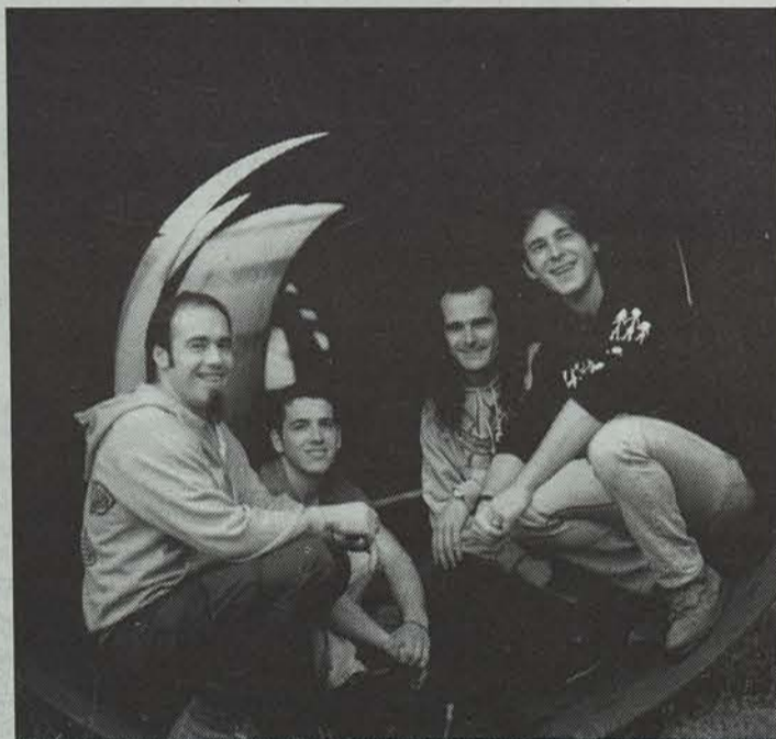
Su ta Gar taldeak kontzertua eskainiko du bihar.

Jadanik bi urte bete ditu Lizarrako Gaztetxeak. Bigarren urtemuga ospatzeko Lizarrako Gazte Asanbladak ekitaldi aunitz prestatu ditu egunotan.