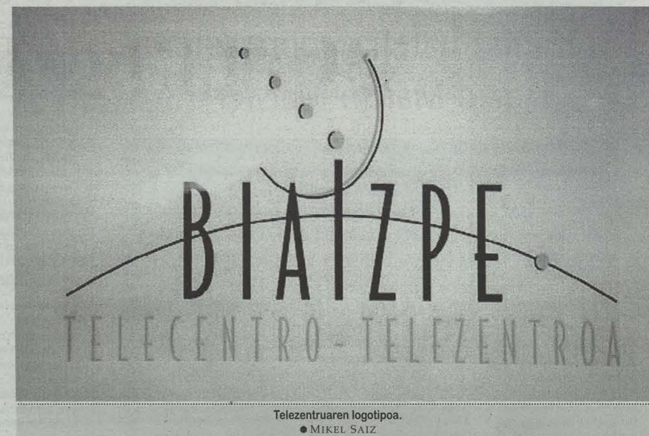
Telezentruaren logotipoa. MIKEL SAIZ

Nafarroako mendialdea Europako Baitanle dentsitate gutxiarekin eskualdeen artean lehen da, 5.000 metro kuadrato biziarekin inguru bairatzen duen aintzat hartuz, mendialdeko biztanleek behar duten Garalurren. Funtzio jarraituz abiatu dute telezentroa. Dena den, ez dute horretan gelditzea erorkizunerako telezentroko jarri nahi dituzte. Biak sareko lehena izanen da. «Hirugarren buruan lortu nahi dugu beste antzeko batzuen antzeko Nafarroako mendialdeko oso ongi kokatutako Sakanan eta Udaltzuzatzen garen