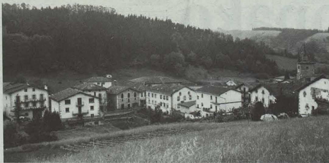
Hirigintza Planak ez du harrera ona izan herrian.

Apriliaren 8an onartu zen behin-behineko plana, baina udalbatzarretan iskanbilak sortu dira, kaltetuek parte hartu dute eta. Oraingoan, herritarrek alegazio epea luzatzea lortu dute.