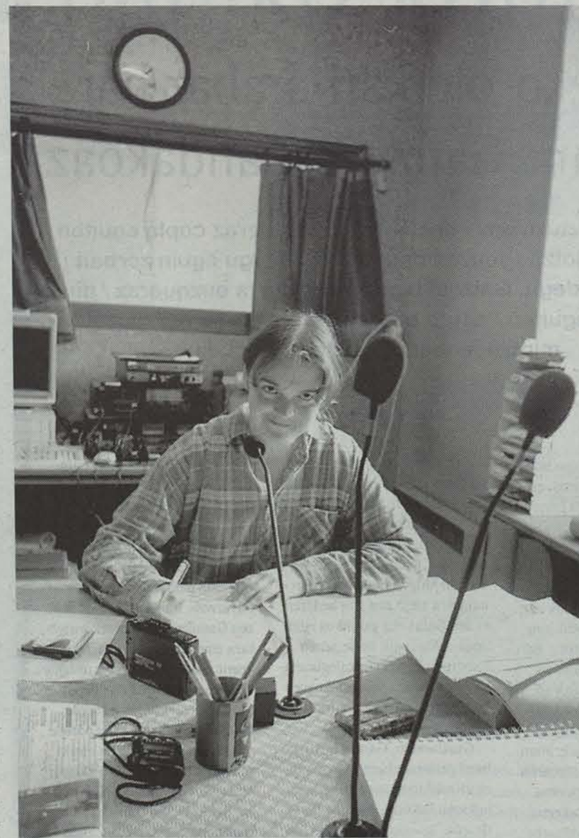
Irulegi Irratiako estudioetako batean lanean dihardu esatariak. LUIS AZANZA

Formakuntzaren beharraz gain, egoitza berri baten falta ere sumatu dute. «Orain zortzi-bederatzi urte lortutako egoitza ttipiagid gelditzen ari da. Bi estudio, gela bat eta bulegoa ditu eta ez da nahikoa», gaineratu dute. Alokaturia da duteen egoitza eta Donibane-Garazin bertan besteren bat topatzekotan dabilta. Behar handienak toki falta eta langileen kalitatea hobetu nahi baldin badira ere, badute beste premiarik ere. Laguntza ofizialak ziurtatzeaz landa, Nafarroan Beherean barna kokatuak dauden antenekin arazo teknikoak dituzte maiz. «Irulegi Irratia ez da toki batzuetan entzuten. Jadanik eman ditugu bizpahiru lekutan errepikagailu batzuk, gure helburua baita lehen-lehenik Behe Nafarroa osoa