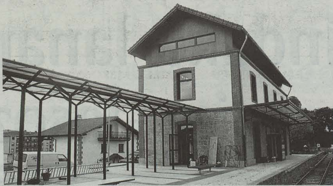
Egoitza berria gaur arratsaldean zabalduko dute.

Plazaola inguruan diharduten turismo zerbitzu guztiak bilduko dira geltoki zaharrean. Bestalde, kanpotik etorritako bisitariei argibideak eskainiko zaizkie, aukera guztiak aprobetxa ditzaten.