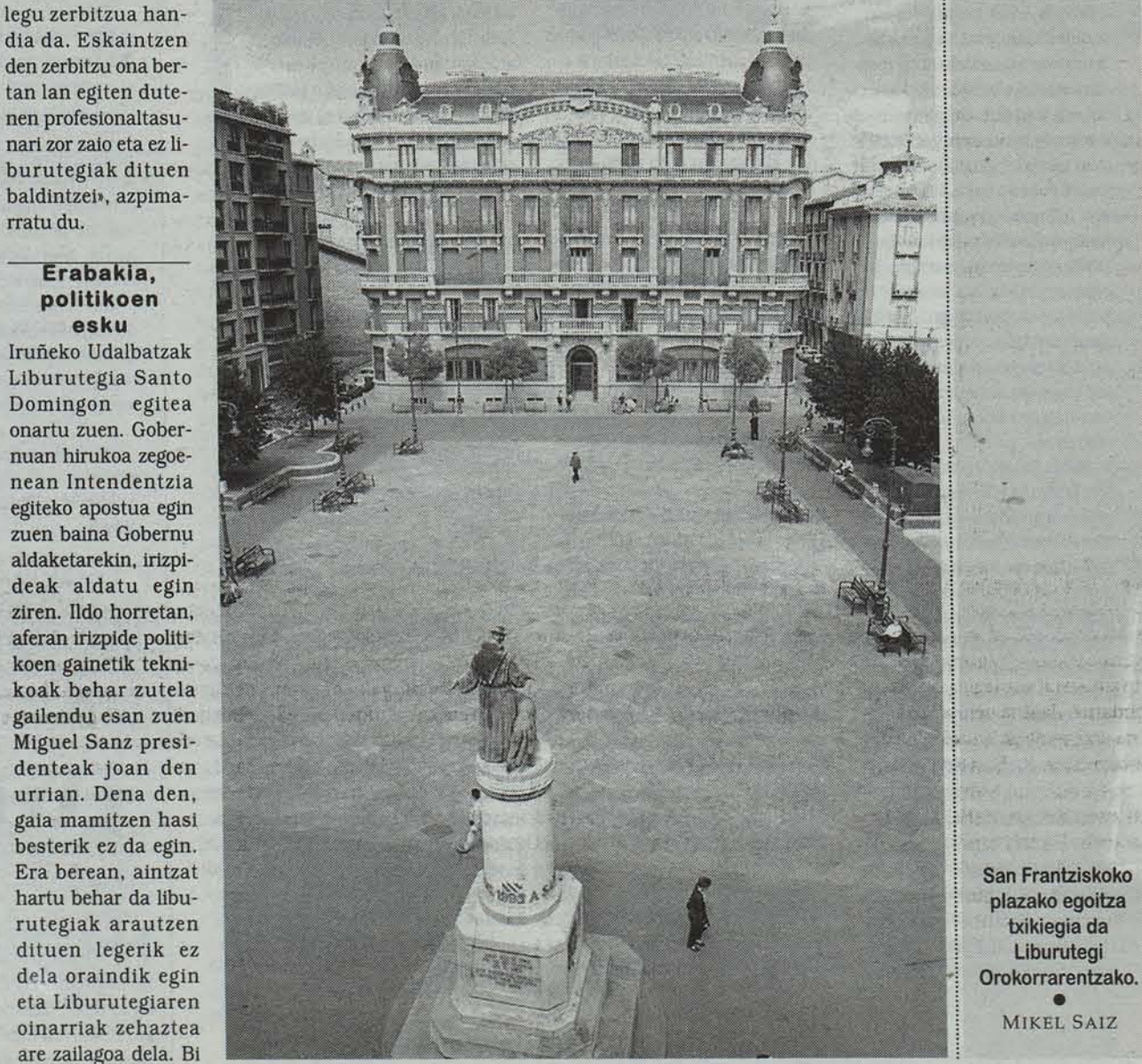
San Frantziskoko plazako egoitza bizi-gia da Liburutegi Orokorrarentzako. MIKEL SAIZ