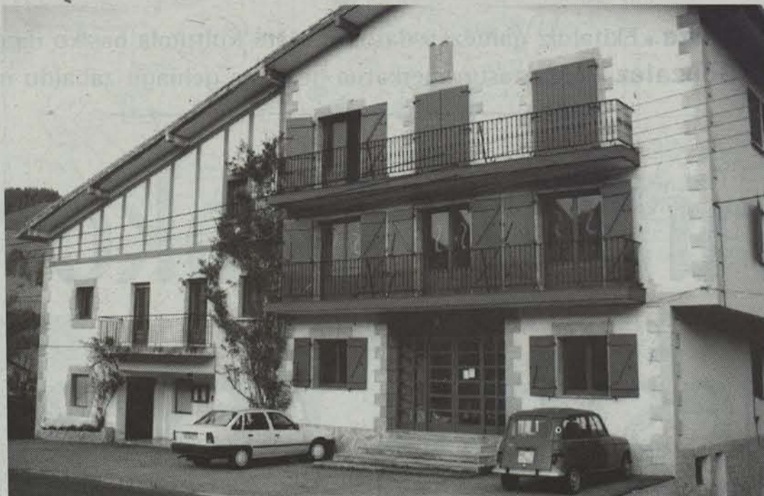
Araizko Udaleri ere eskatuko zaio euskara kalean ez ezik, barruko funtzionamenduan ere bultzatzeko.

Araitz-Beteluko Euskera Batzordeak badaramatza hogei urte euskeraren aldeko lanean. Gainerantzeko jendeak ere ahalegin honetan parte har dezan nahi dute.