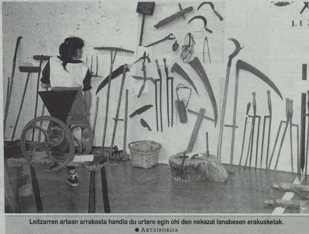
Leitzarren artean arrakasta handia du urtero egin ohi den nekazal lanabesen erakusketak.

Gaur hasi eta datozen hamar egunotan erakusketak, zinema, antzerkia eta bestelakoak bistatuz goatzeko parada izanen da Aste Kulturean.