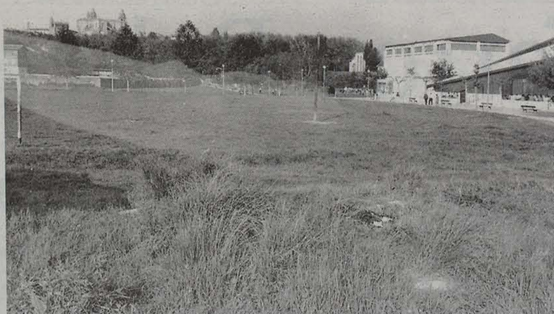
Iruñeko hainbat txoko ikusteko aukera izanen da etzi.

Arturo Kanpion euskaltegiak Iruñeko mugetan barnako ibilaldia antolatu du etzirako. Txangoa Lagunartean hasi eta bukatuko da. 8:00etan aterako dira, ibilbidea 2:30etan bukatzeko.