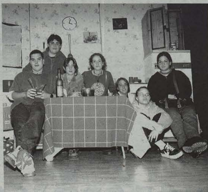
Iturramako Antzerki Tailerra gaurko lana prestatzen.

Iturramako Institutuko Antzerki Tailerrak parte hartuko du Gazte Antzerki Taldeen Topaketetan. Hamalau talde ariko dira, eta Iturramakoa da euskaraz ariko den bakarra.