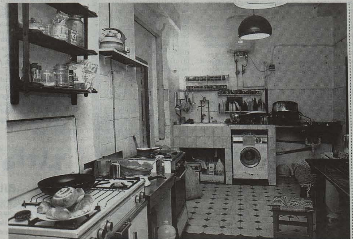
Jantokia, igandean izan ezik, egunero irekitzen dute. MIKEL SAIZ