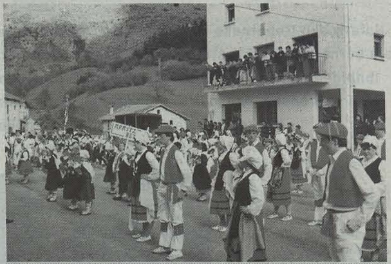
Joan den urteko Dantzarien Eguna Arribeko plazan.