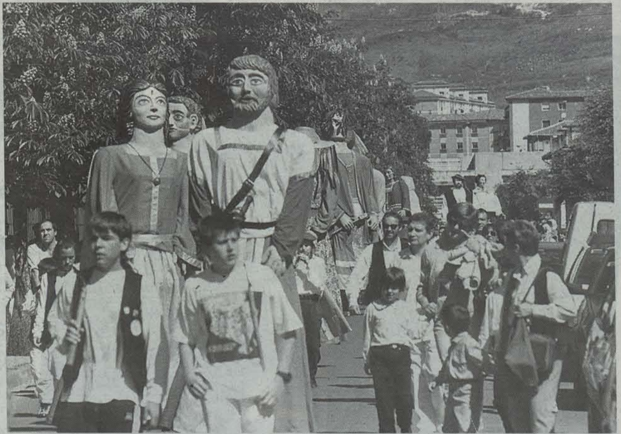
Erraldoien konpartsa egunero karrikaratuko da jaietan.