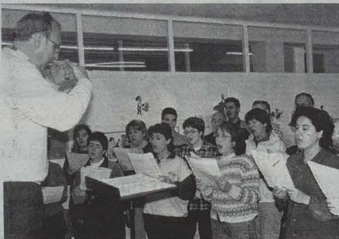
Lizarrako Ereintza abesbatza entsaiatzen.

Bihar hasiko dira emanaldiak Hamargarren urteurrena ospatzeko antolatutako emanaldiak bihar hasiko dira. Lehenengo kontzertua Zarautz abesbatzak eskainiko du. Apirilaren 4ean,