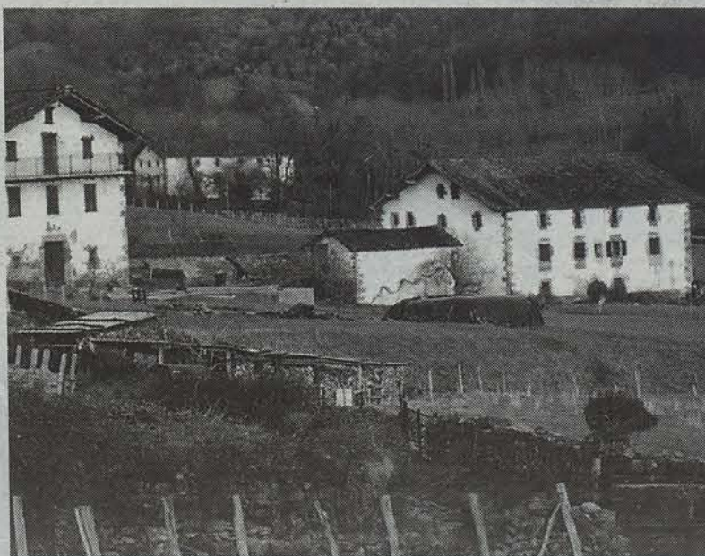
Zozaiatik Legasara doan saihesbideko proiektuak Narbarteko Lakoizketa baserriko lurra hartuko lituzte.

Azaroaren amaieran inauguratu zen Belateko tunela. N-121 errepidearen hobekuntza lanen ildotik abiatu zen lan honek izanen du jarraipena epe motzean.