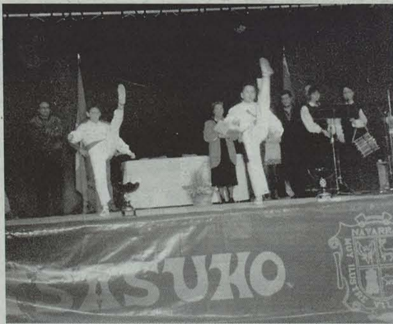
Joan den urtean Altsasuko Burunda pilotalekuan egin zen Aurreku Txapelketako kanporaketa. • AITZIBER ETXAIZ

Etorkizuna dantza eskolak antolatuta, asteburuan 7-15 urte bitarteko dantzarien txapelketak jokatu dira, Altsasuko Burunda pilotalekuan.