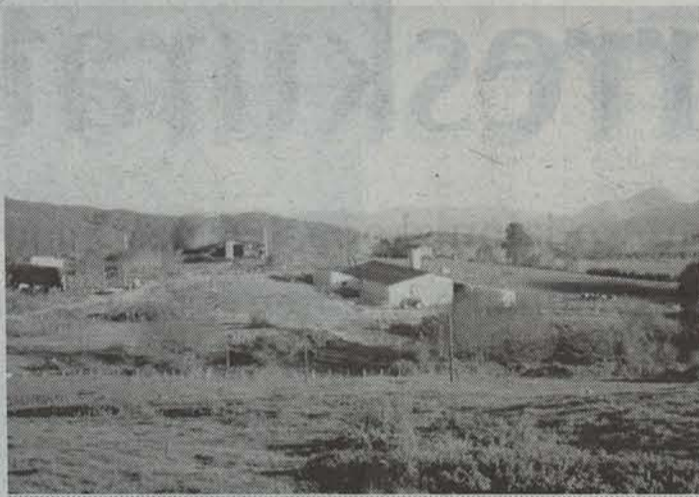
Uitziko Lainomendi kooperatiba.