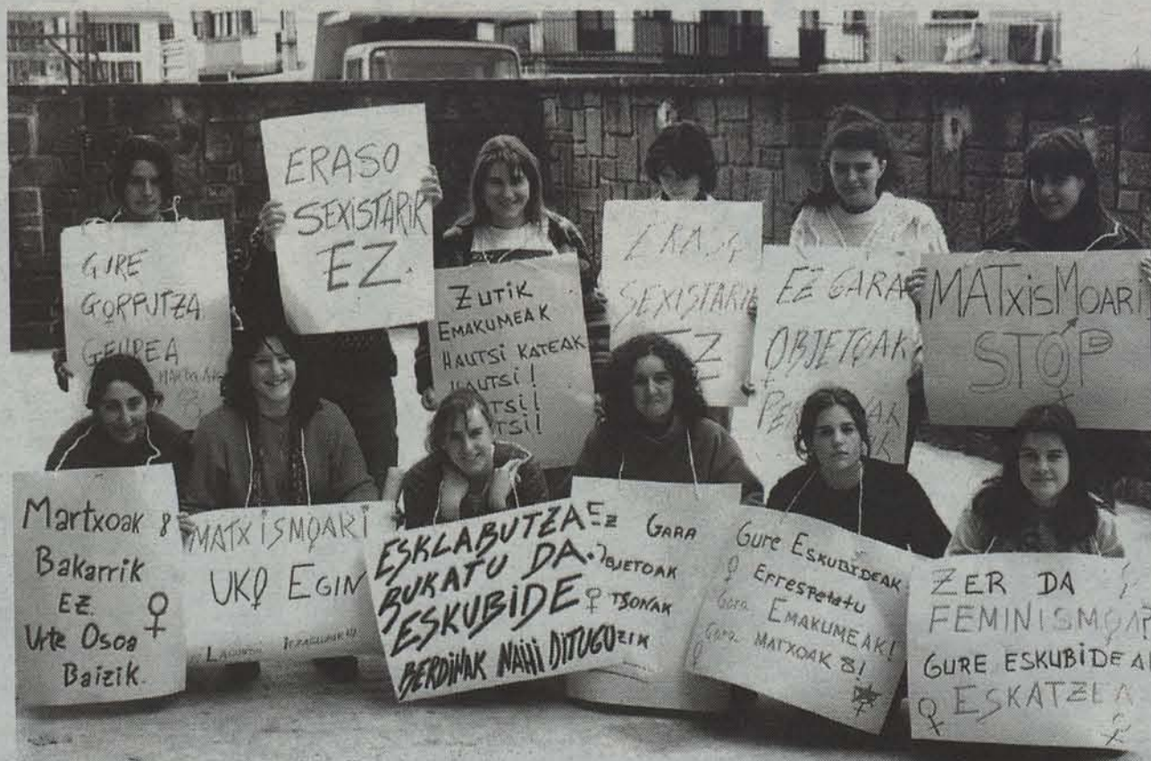
Inoiz ez, ez niri ez beste inori ere lelopean, hainbat ekitaldi antolatu dituzte Lizarrako emakume taldeek. ANDER GILLENEA

Inoiz ez, ez niri, ezta beste inori ere lelopean, anitz ekitaldi antolatu dituzte Lizarrako hainbat emakume taldek etzi, martxoak 8, Emakumearen Eguna ospatzeko.