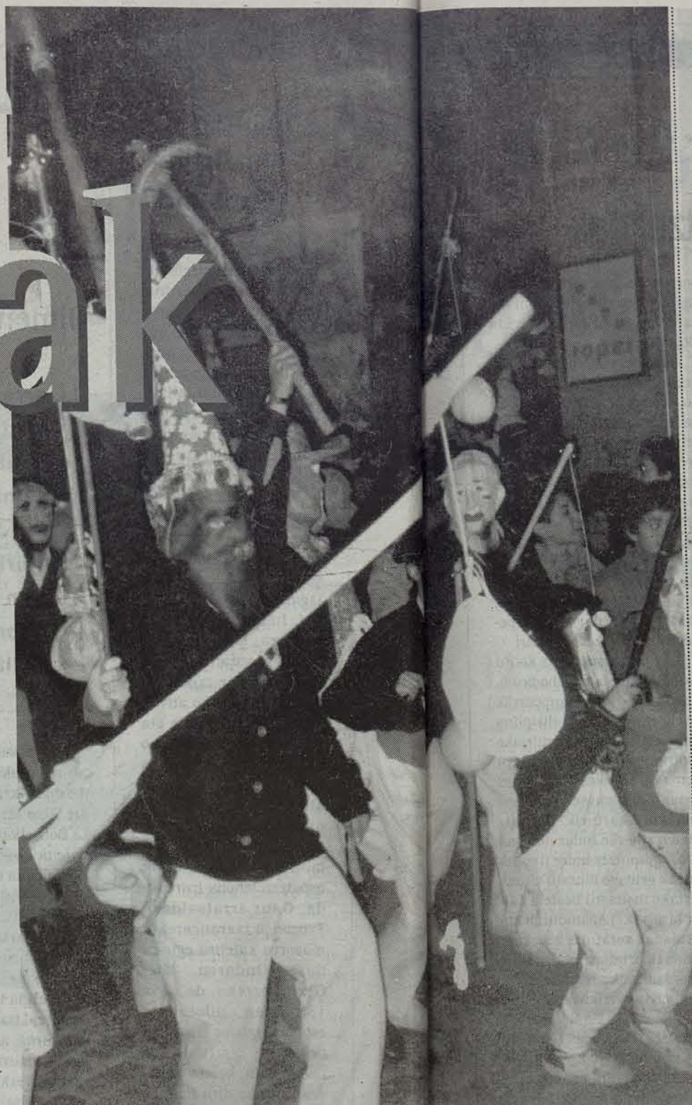
Tuterako zipoteroak gaur ere kalera aterako dira inauteriak hasi direla erakusteko. ARTXIBOKOA

Euskal Herriko inauterietan ugari azaltzen diren pertsonailetako bildumari erantsi beharreko beste bat Cintruenigoko zarramuskeroa da. Ohi bezala, etorki ilunekoa, herri jakinduriak Erronkari aldeetik etorritako artzainengan kokatzen du zarramuskeroren sorrera. Bardeetara etortzen ziren Pirinioetako artzainak hemengo herrietara sartzen zirenean, hain zeuden zikin eta zatar, hain zen sarkorra garbitu gabe irautearen kariatz zekarten usain nazkagarria, ezen erriberarrek, anil-hautsa botaz jakinarazten zieten zuten ikuzi