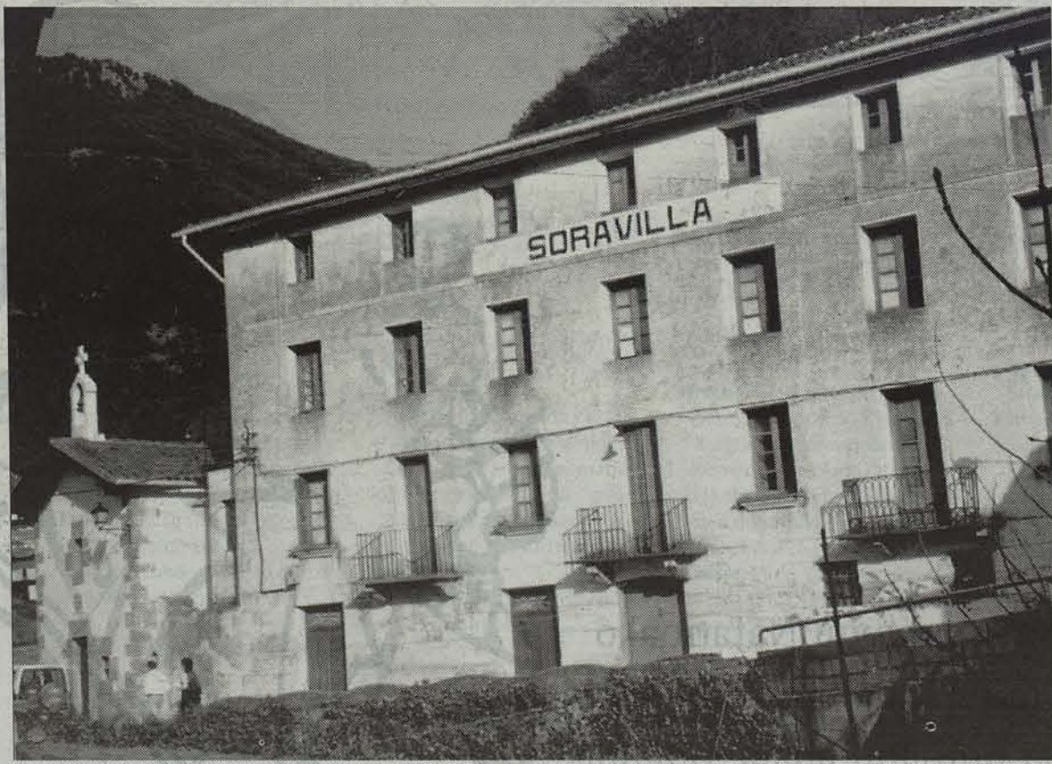
Beteluko Soravilla hotela izandakoan egin nahi da zahar etxea.

Ongizate Sailak, azaroaren 11n, Beteluko egitasmoaren alde