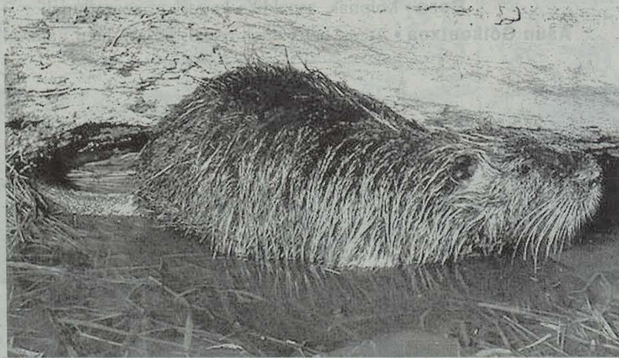
Bidasoa, Baztan, Oiartzun eta Urumea ibai bazterretan kalte handiak eragin ditu koipuk.

Azken egunotan han eta hemen hitz egin da koipuaz, arratoi handi baten itxura duen animalia ugaztunaz. Bidasoa, Baztan, Oiartzun eta Urumea ibaietan agertu dela aipatu bada ere, aspalditik bizi da gure artean animalia hori.