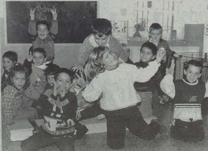
Irunberriko ikastolako haurrak bi tokitan banatuta daude. Argazkian, ikasle gazteko batzuk.

Irunberriko Udalak Euskararen Legearen aldaketa eskatu zuen azken plenoan, herria eremu mistoan sartu eta eskola publikoan D eredua jarri ahal izateko.