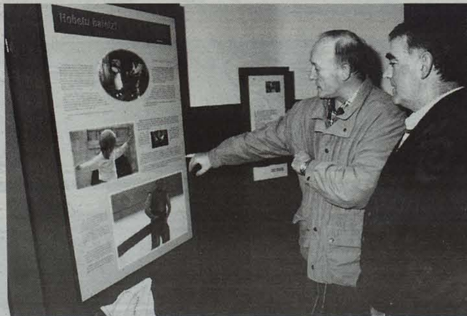
Gure herria, gure kirola erakusketak herri kirolak izan duen eboluzioa agertzen du.

Euskal herri kirolen inguruko erakusketa zabaldu berri du Plazaolako Turismo Partzuegoak Leitzako Udaleko batzar aretoan. Gure herria, gure kirola erakusketak herri kirolak izan duen bilakaera aztertzeo aukera eskaitzen du.