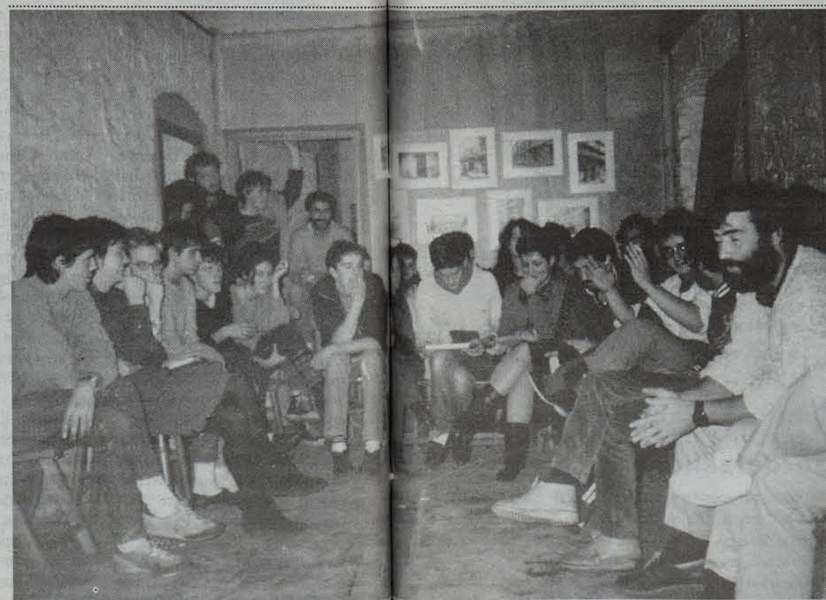
Eguzki Irratia eratu ondoren irrati ideek egindako lehen asanblada. • INAKI GARCIA

rrantzia izateaz gain, gehien entzuten diren irratiaioak dira. Erakundeek zabalitzen dituzten iriztietatik kanpo, giza mugimenduen errealitatea islatu nahi dugun», dio Rubenek. Dena den, informatiboek arrakasta badute ere, beharrik ere sumatzen dituzte. Jendearen partehartze zabalagoa nahi lukete eta iritziak, analisiak eta ikuspegi sakonagoak ere tarteren bat edukiko beharko luketela uste dute.