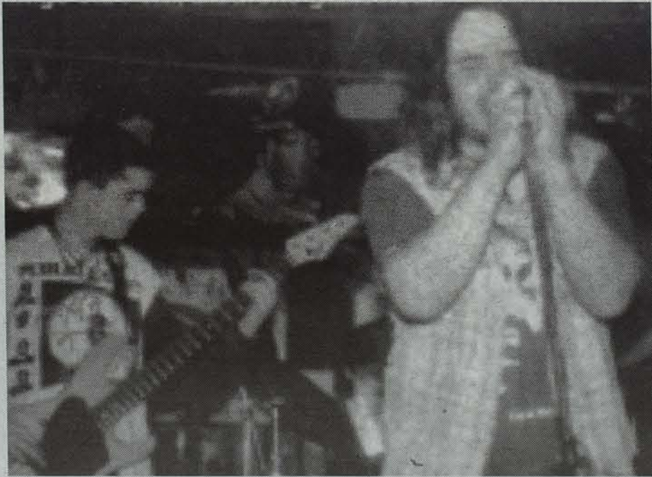
Petti bakarlaría Zizka tabernan ariko da bihar. • LURRA

Herriak eta Hiriak kultur hilabeteko azken-aitzineko asteburuan, Berako zenbait musika taldek kontzertuak emanen dituzte hiru ostatutan. Aukera ederra.