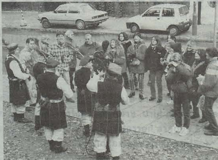
Poloniako egonaldia oso atsegina izan da leitzarrentzat. Argazkian, Krakovian, hango musikariak antzuten.

i RAGAN URTEKO OTSAILEAN LEITZA- ko Asketa abesbatzak Zielona Gorako Unibertsitateko abesba- tza Euskal Herrira gonbidatu zuen, eta askok hango musika ezagutzeko aukera izan zuten. Po- loniako abesbatzak Leitza ez ezik Donostian, Lizarran eta Iru- ñean eskaini zituen kontzertuek arrakasta handia izan zuten, eta jendearen gustukoak izan ziren. Beraz hau ez da Asketa taldearen- tzat bidaia hutsa izan, Poloniako Abesbatzarekin egindako truka- keta bat baizik. Nekatuta baina oso kontent bueltatu dira Polo- niatik. Bidaia oso luzea iruditu zaien arren esperientzia oso ona eta benetan aberasgarria izan omen da. Euskal Herrian barna eta Katalunian kontzertuak eman izan dituzte, baina hau izan da hain urrutiraino egin duten le- hen irteera eta azkena ez izatea espero dute. Lau kontzertu eska- ni dituzte Polonian. Euskal musi- ka folklorikoa han ezagutarazteko asmoarekin abiatu ziren eta hel- burua lortu dutela uste dute abiesbatzako partaideek. Bertan euskal musika ez zuten ezagu-