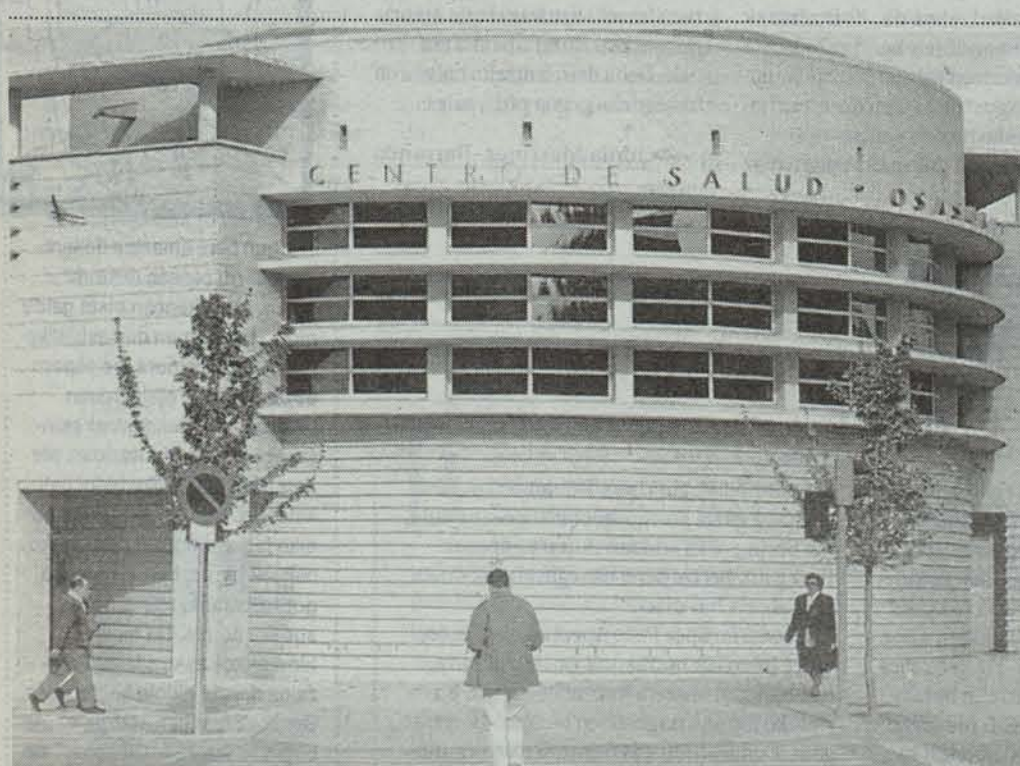
Ermitagañako Adimenerako Osasun Zentroan tratatzen dira anorexia eta bulimia. ● LUIS AZANZA