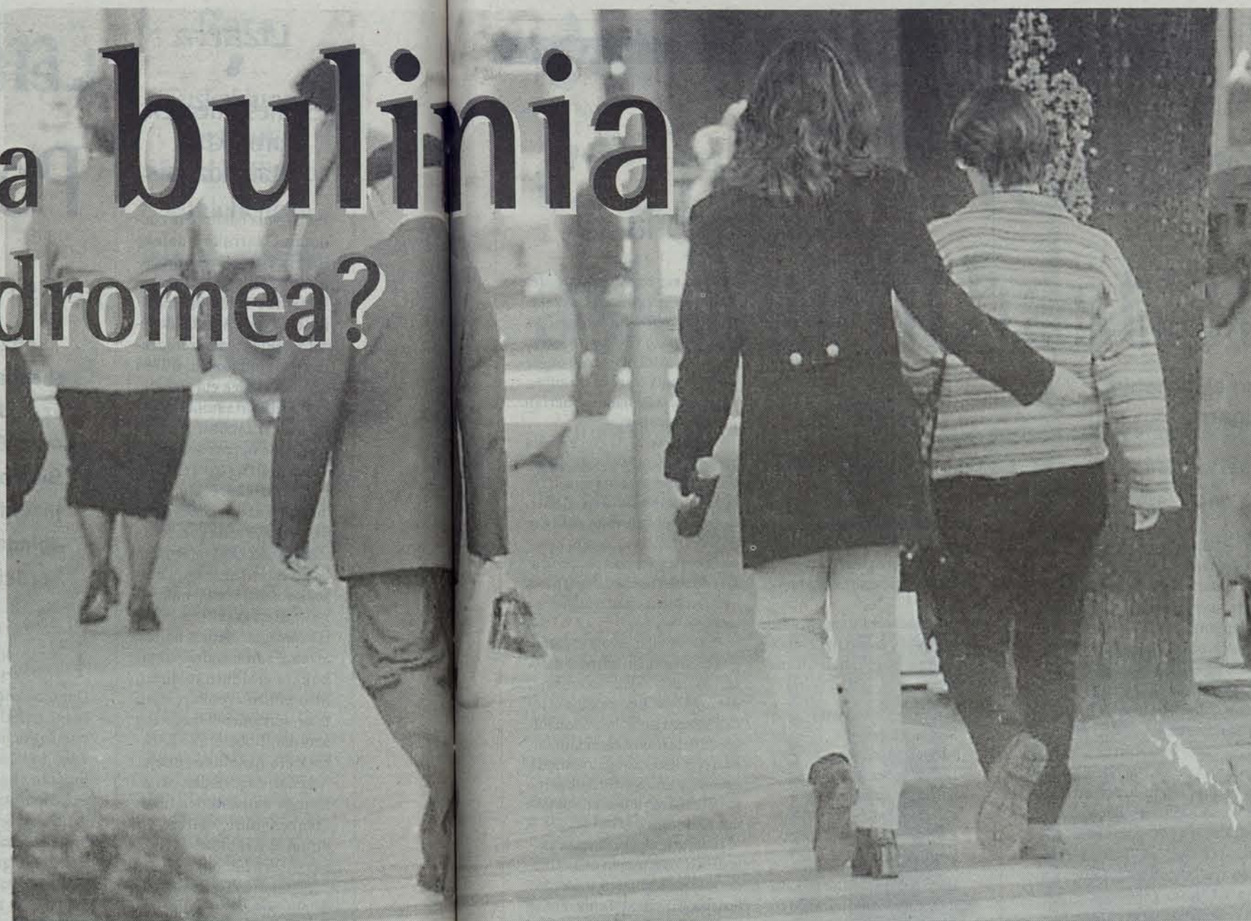
Gazteak eta neskek dira, batez ere, anorexia eta bulimia jasaten duten pertsonak. ● LUIS AZANZA

alpapenean komunikabideek duten eragina «erabakiorra» da. «Komunikabideek emakumearen arrakasta duen aspektu fisikoan oinarriturik aurkeztu digute, arrakasta horretan bakarrik oinarrituko balitz bezala, eta hori faltsua da». Irudiarri gero eta garrantzi handiagoa ematen zaion gizartearen egoera, gaixotasun bion atze-