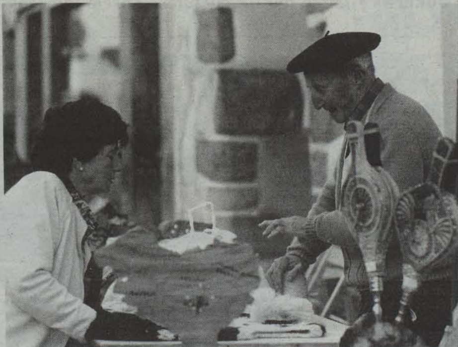
Artisautza erakusketa arras interesgarria izan ohi da Berako Lurraren Egunean. LEIRE ARZUAGA

Orain 11 urte hasi zenetik, gero eta indar gehiago hartu du Lurraren Eguna beratarren artean. Urriko azken igandean Euskal Herriko baserrietan eta bereziki Bortzirietakoetan egiten diren produktuak erakustea eta dastatzea da helburu nagusia.