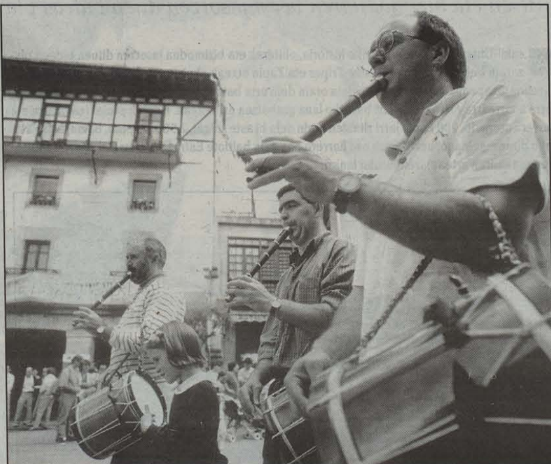
Goizeko 8:00etatik aurrera kalez kale ibiliko dira txistulariak Olatz Txipian.

Goizeko lehen ekitaldien ondoren, 10:00ak aldera hamarretakoa egingen dute Olatz Txipian bildutako herritarrek, herriko San Sebastian plazan. Hamaiketakoa hartu ondoren, jolasean ibiltzeko aukera izanen dute txikienek, San Sebastian plazan bertan. Gaztelu puzgarria eta zezen mekanikoa jarriko dituzte haien-