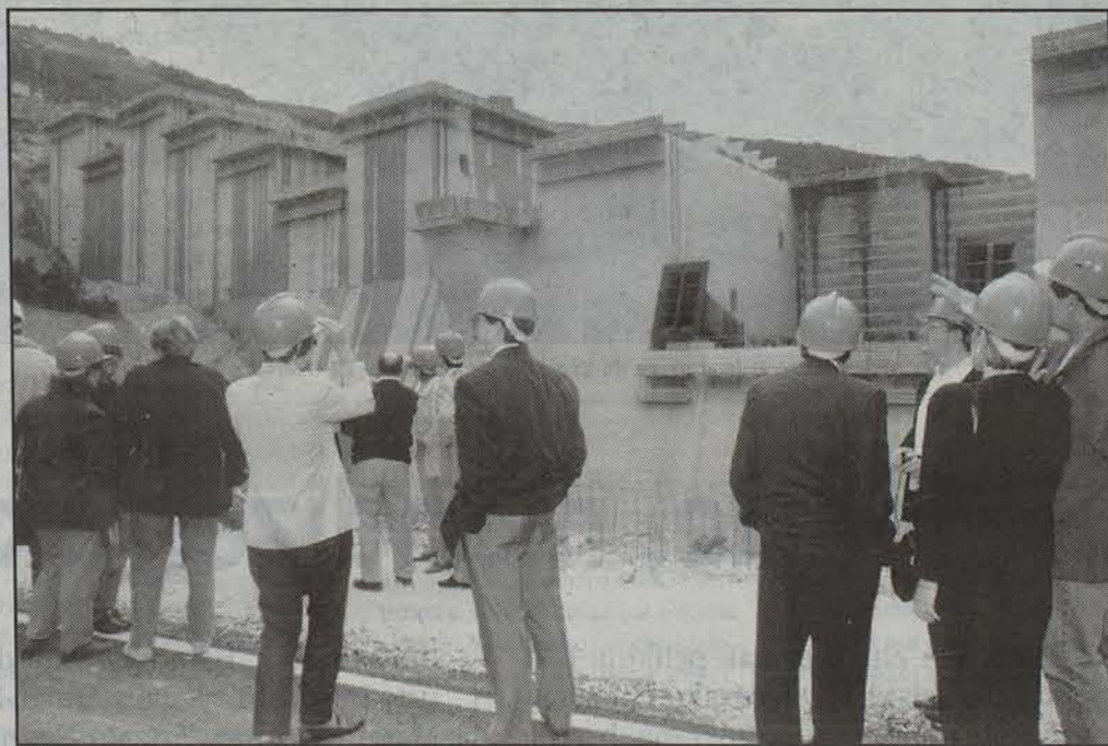
Nafarroako hainbat parlamentario uda aurretik izan ziren Itoizko urtegiako lanak ikusten.

Beraz, franko poliki abiatu da opor ondoa, interesgarri. Segida, ordea, ikuskizun dago oraindik.