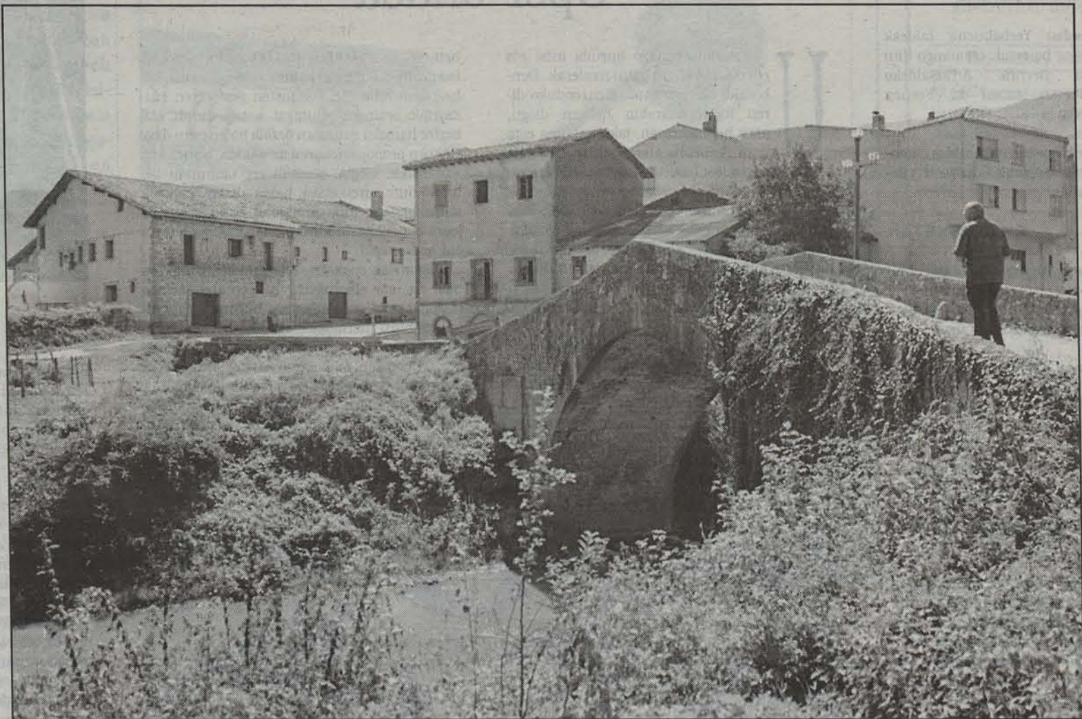
Ordubeteko bideoa osatu du Triper eta Zapinek Arakil-Uharteko historiari buruz.