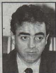
Miguel Sanz Nafarroako lehendakaria

■ Nafarroako Gobernuak ez du aurrerantzean epaileek Itoizko urtegiaren eta Nafarroako ubidearen inguruan plazaratzen dituzten epaiei buruzko adierazpenik egingen. Miguel Sanz lehendakariak herenegun azaldu zenez, horren zergatia da epaien sorburua Itoizko Koordinakundearen salaketak direla, eta Koordinakundeak ez zuela salatu solidarioen urtegiako presako eraikuntza lanen aurkako ekintza. Kable moztea, ordea, 96ko apirilean gertatu zen, eta joan den asteazkenean arte Gobernuak epaien balorazio publikoa egiten zuen. Sanzek esan ez bazuen ere, agian uda honetan epaileek urtegiaren aldeko eman dizkieten kolpe gogorrek zerikusirik badaukate Gobernuaren erabakietan.