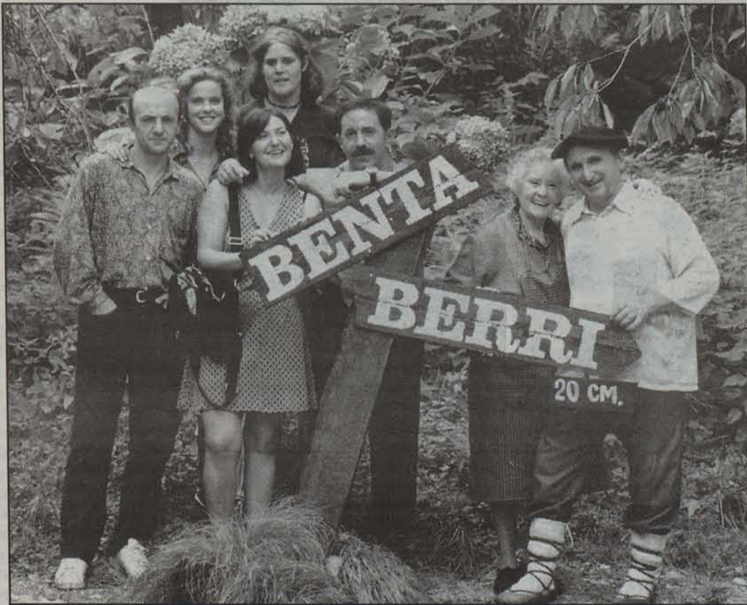
Benta Berri telesailako aktoreetako batzuk.

Dena den, programazio horretan neronek bi hutsune nabarmen topatzen ditut, alegia, filme eskasia eta eztabaida saio murrizkeria. Konparazioak egitea desgokia dela esaten da, badakit, baina ia-ia esanen nuke hemen ez didatela beste aterabiderik ematen, hara, ETB2an egunero ematen dituzte hiruzpalau pelikula. Batzuk izango dira eskasak, txarra edota oso txarrak, baina beste batzuk, aldiz, balekoak, onak, arrunt onak eta bikainak, baina aukera, behintzat, aitortu behar da hagitz handia dela. ETB1ean, orain arte