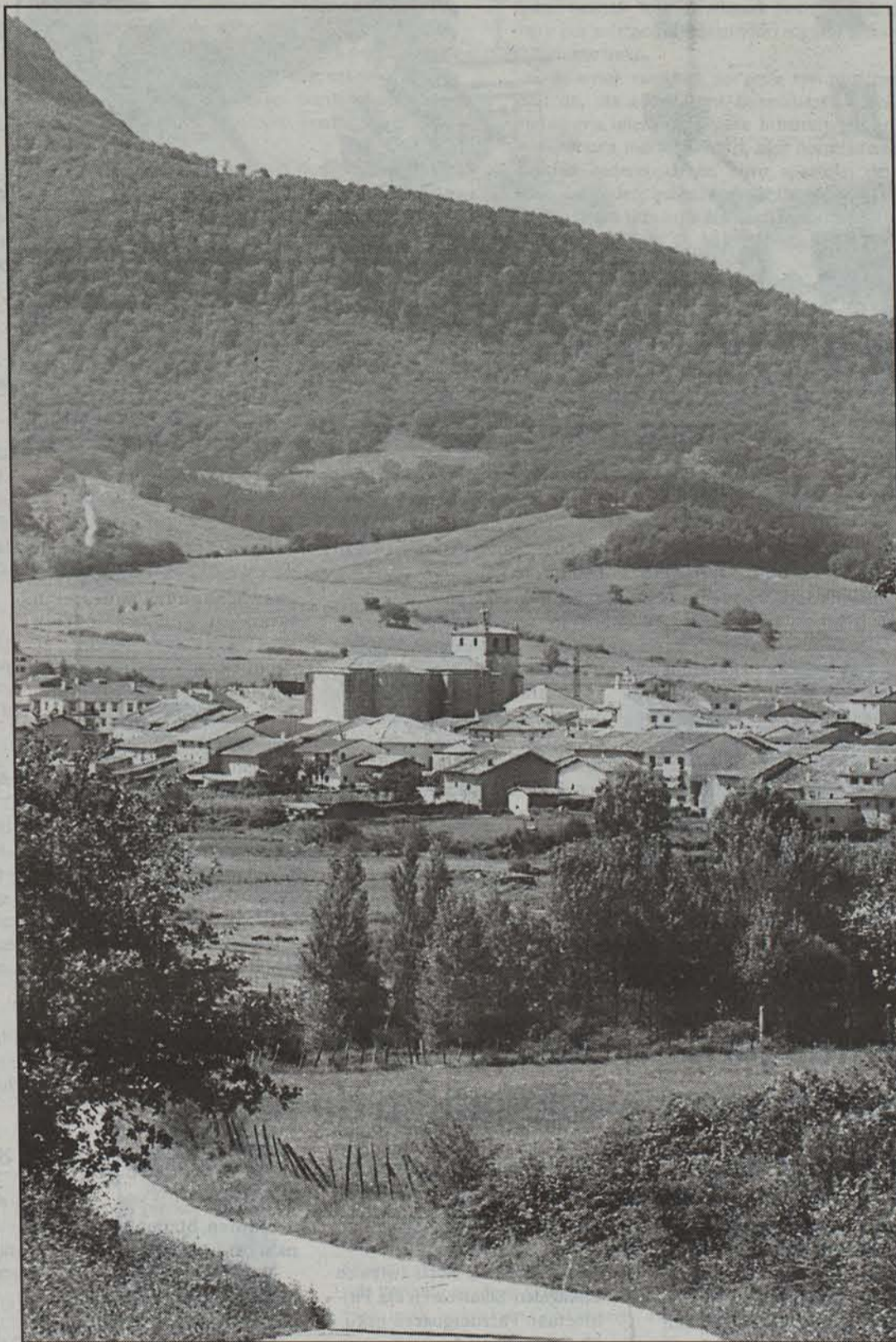
Uhartearrek oso harrera ona egin diote herriari buruzko bideoari.