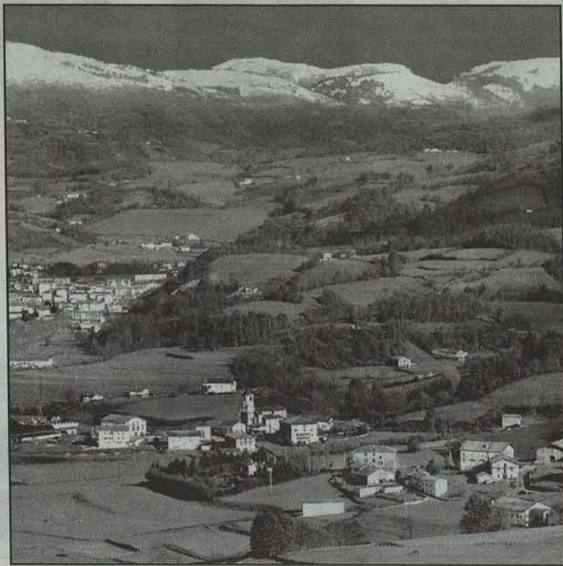
Baztaneke 50 kilometroko muga du Lapurdi eta Nafarroa Behereko herriekin.

U rtero bezala, Baztango Udalak bailara eta Iparraldea banantzen dituen muga berraztertu du aste honetan, Espainiak eta Frantziak 1856. urtean sinatutako Mugen Hitzarmenak agindutakoari jarraiki. Aurten lana bereziki garrantzitsua izan da, zenbait gaztek hainbat mugarri hautsi dituzte eta,