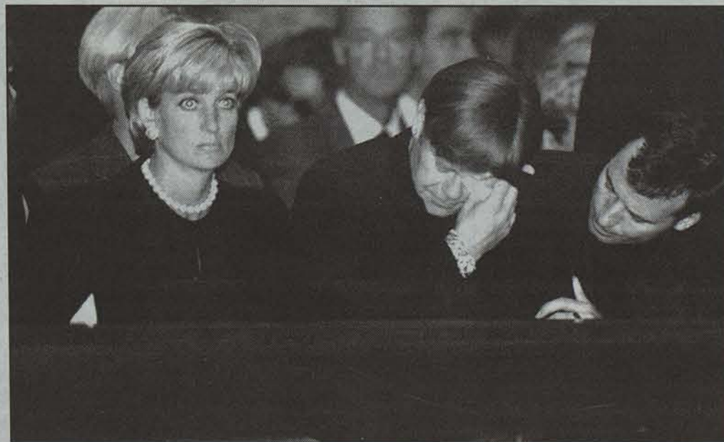
Lady Di, Elton Johnen ondoan, Gianni Versaceren hiletetan.

Kazetarion zeregina albisteak bildu, sailkatu eta aztertzea omen da, mundua hobeki ezagutu eta, ahal dugun neurrian, hobera alda dezagun. Gaurkoan ezin liteke asteko kronika baikorrik egin ustezko mundu zibilizatuaren gizartean, eta bereziki komunikabideetan, erregelariaren marka guztiak berriro ere hautsi direlako.