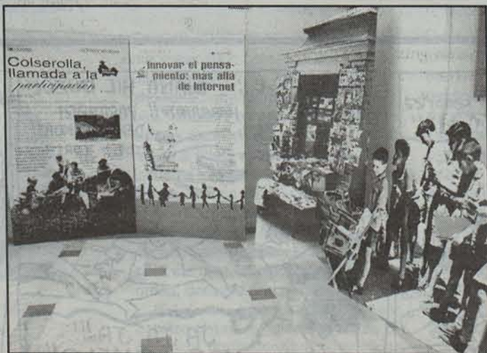
Birziklatzeari buruzko panela dago haurrentzat propio ikusgai.

Ikusleei dagokienez, erakusketak denek zuzendua dagoela azpimarratu du Seve Mindegia Bertizko Natur Parkeko kideak: «Edozein etor daiteke ikustera», nabarmendu du. «Egia da haurrek pazientzia gutxiago dutela eta lehenago nekatzen direla, baina hala eta guztiz ere panel guztiak ikusi eta irakurtzen dituzte», gaineratu du Mindegiak. Gainera, haurrentzako propio egindako panelak badira Bertizko erakusketan. Haietan, birziklatzeari buruzko xehetasunak aurki ditzakete neska-mutiek. Ingurugiroa zaintzeko ideiak ezaugu nahi dituenak, beraz, badauki non duen egunotan aukera.