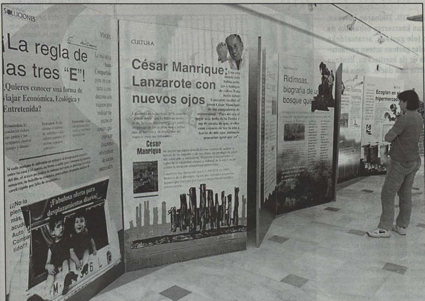
Ingurugiroari buruzko 25 panel bildu dituzte Bertizen Gure konponbideak erakusketan.