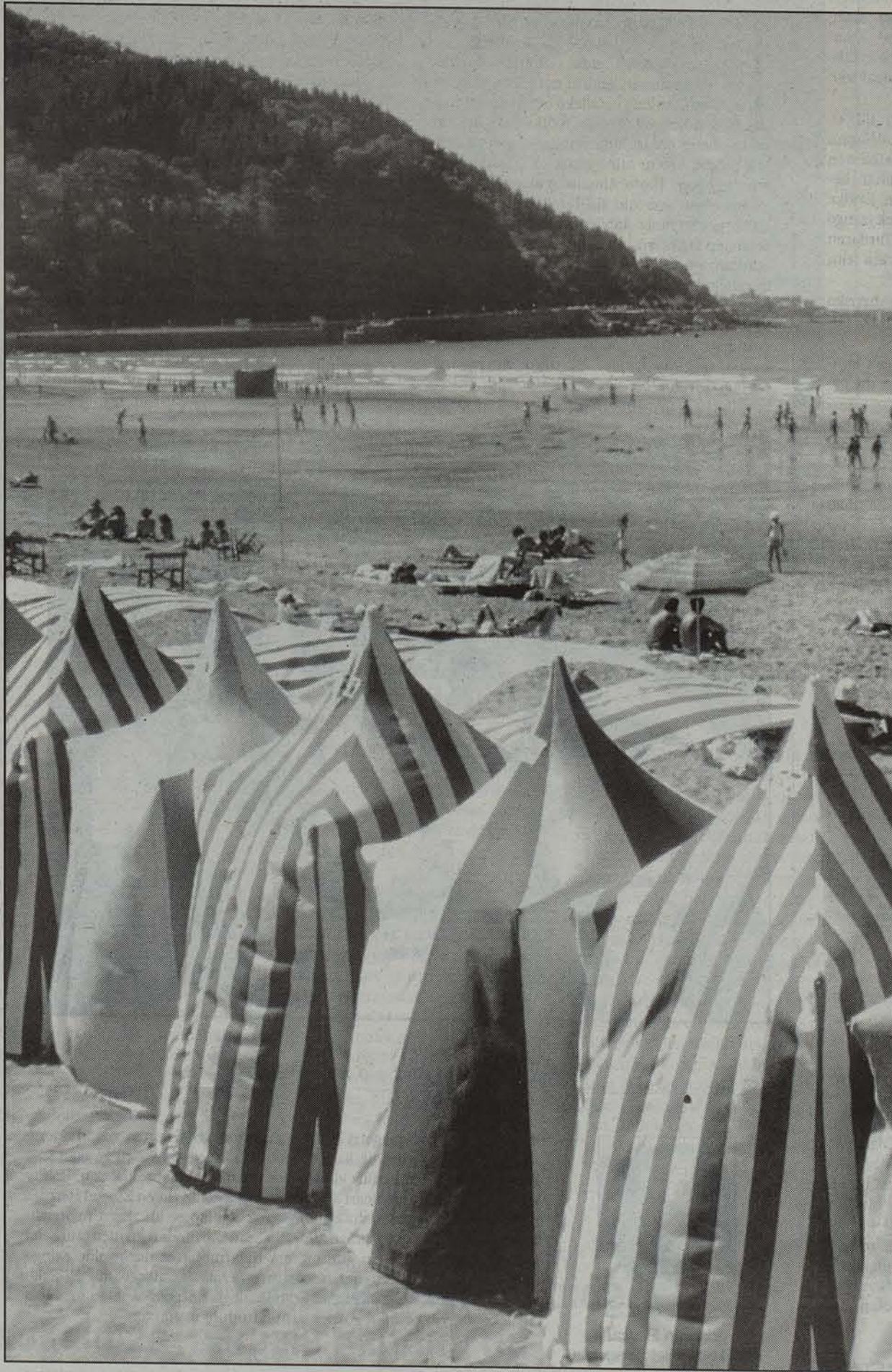
Zarauzko hondartza oso gustukoa eta maitea dute nafarrek.