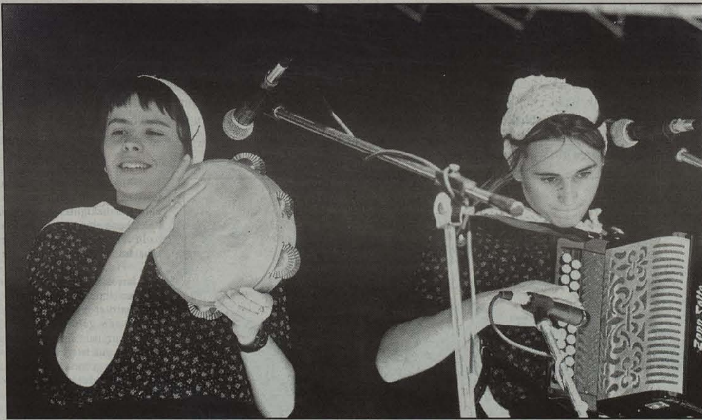
Aurtengo edizioan bikote gutxi hartu dute parte.

Zortzi bikote ariko dira herriko plazan, nor baino nor, txapela eskuratzeko asmoz