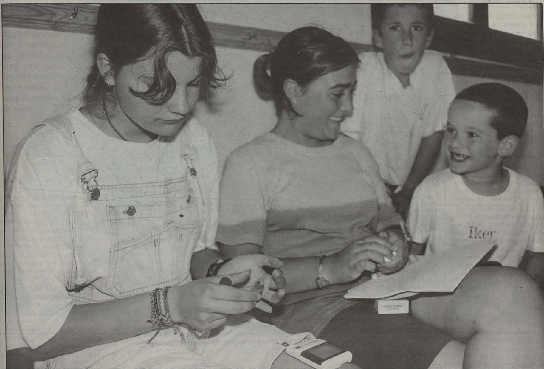
Atzetik ateratako odol tantaren bidez neurtzen dute diabetikoek duten azukre kopurua.