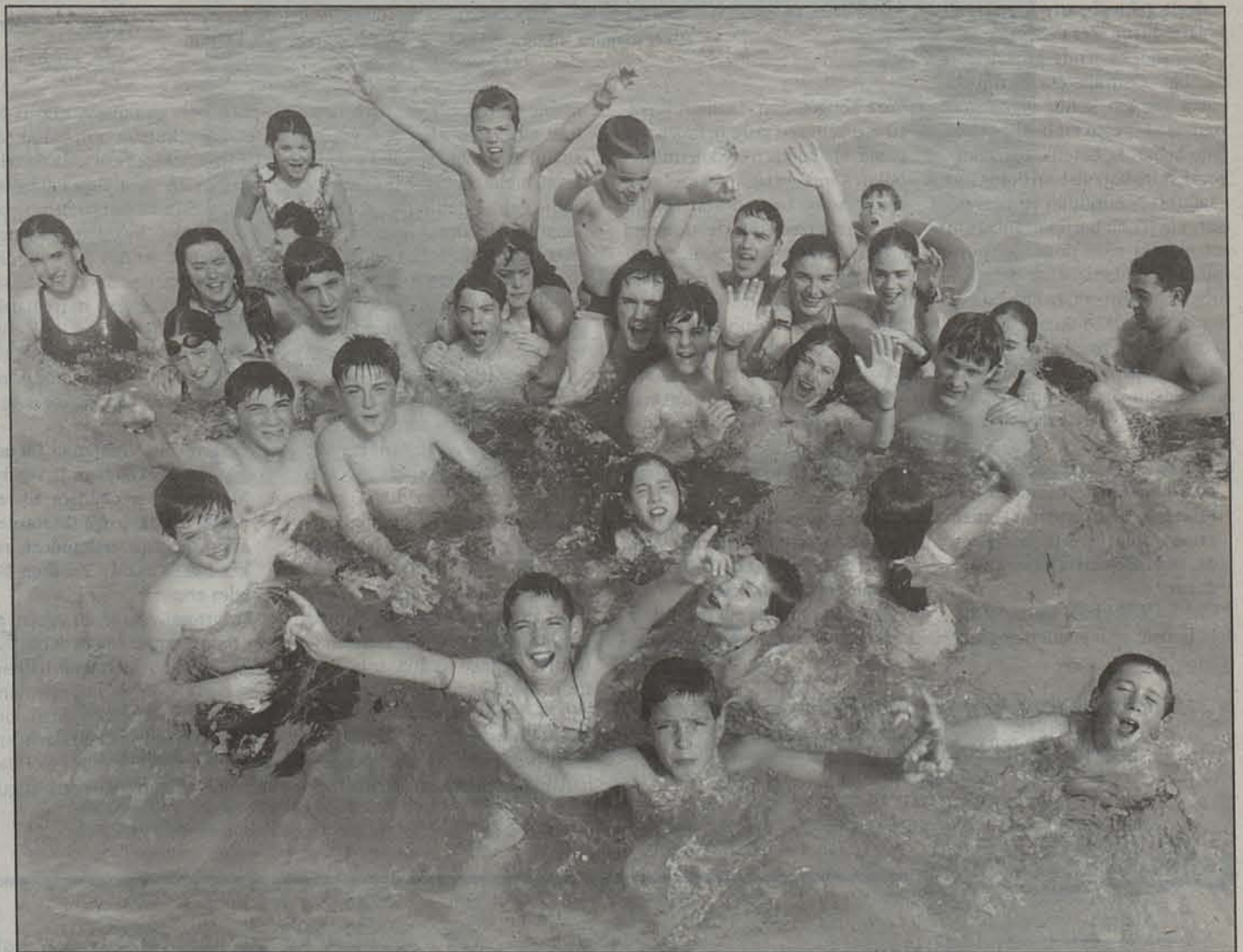
Igerilekuan ongi pasatzeko aukera paregabea dute Garesko udalekukoak.

Pankreasa aldatzeari buruz hitz egiten hasi da, baina, Bladurnik dioenez, «oraindik ez dago inolako emaitzarik». Azkenik, intsulinaren analogoak aipatu ditu medikuak: «Azkar eragiten dute eta intsulinarekin antz handia dute. Diabetikoa ez den pertsona baten pankreasa, jaten duen bakoitzean produzitzen du intsulina, behar adina. Analoagoak hori bera egiten saiatzen dira. Oso garrantzitsua da, lortuz gero, jaten duen unean jarriko lukeelako txertoa diabetikoak».