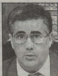
Javier Chourraut Iruñeko alkatea

■ Javier Chourraut Iruñeko alkatea Udalak peñei ematen dizkien diru laguntzak aztertzeko asmoa plazaratu zuen, aurtengo sanfermin nahasi-en balantzea egiteko emandako prentsaurrekoan. Alkatea haserre dago peñek ez dutelako Miguel Angel Blanco Ermuko zinegotziaren hilketa salatu. Peñek erantzun dute haiek sekula ez dutela hilketa bat salatu, alde batekoa zein bestekoa izan. Espero dezagun heldu den urteko sanferminetarako tira-bira horiek guztiak ahantzirik egotea; izan ere, Chourrautek berak aitortu zuenez, peñak sanferminetako zati garrantzitsu bat dira, eta benetan kezagarria litzateke haien eta Udalaren artean desadostasun konponezinak sortzea.