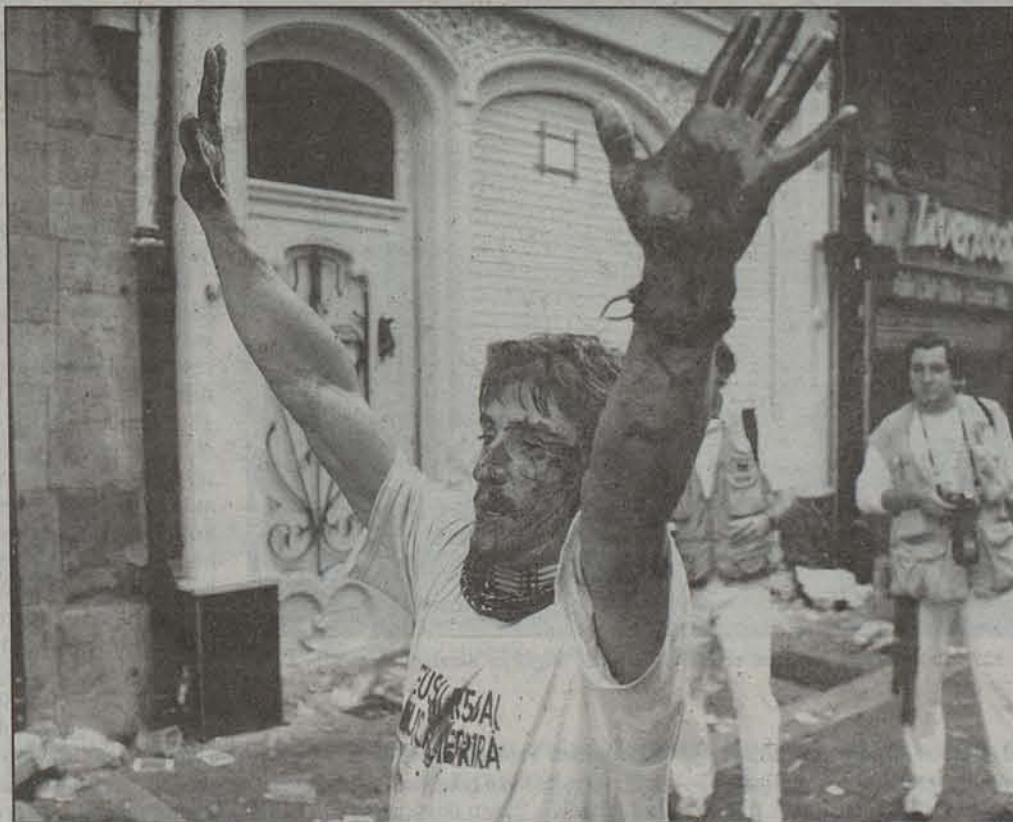
Istilu larriak izan ziren sanferminetan, eta zaurituak ugari izan ziren.

Inork ez du urratsik egiten arestian aipaturiko argazkia mugi dadin, inork ez du amore ematen, ezta pittin bat ere. Argazki beltz hori aldatzeko ez du ja ere laguntzen Blanicorenak, ezta horren ajeak ere. Kantuak dioen bezala, «gogorkeriak diraueno ez gara libre izanen». Edo ez da horrela?