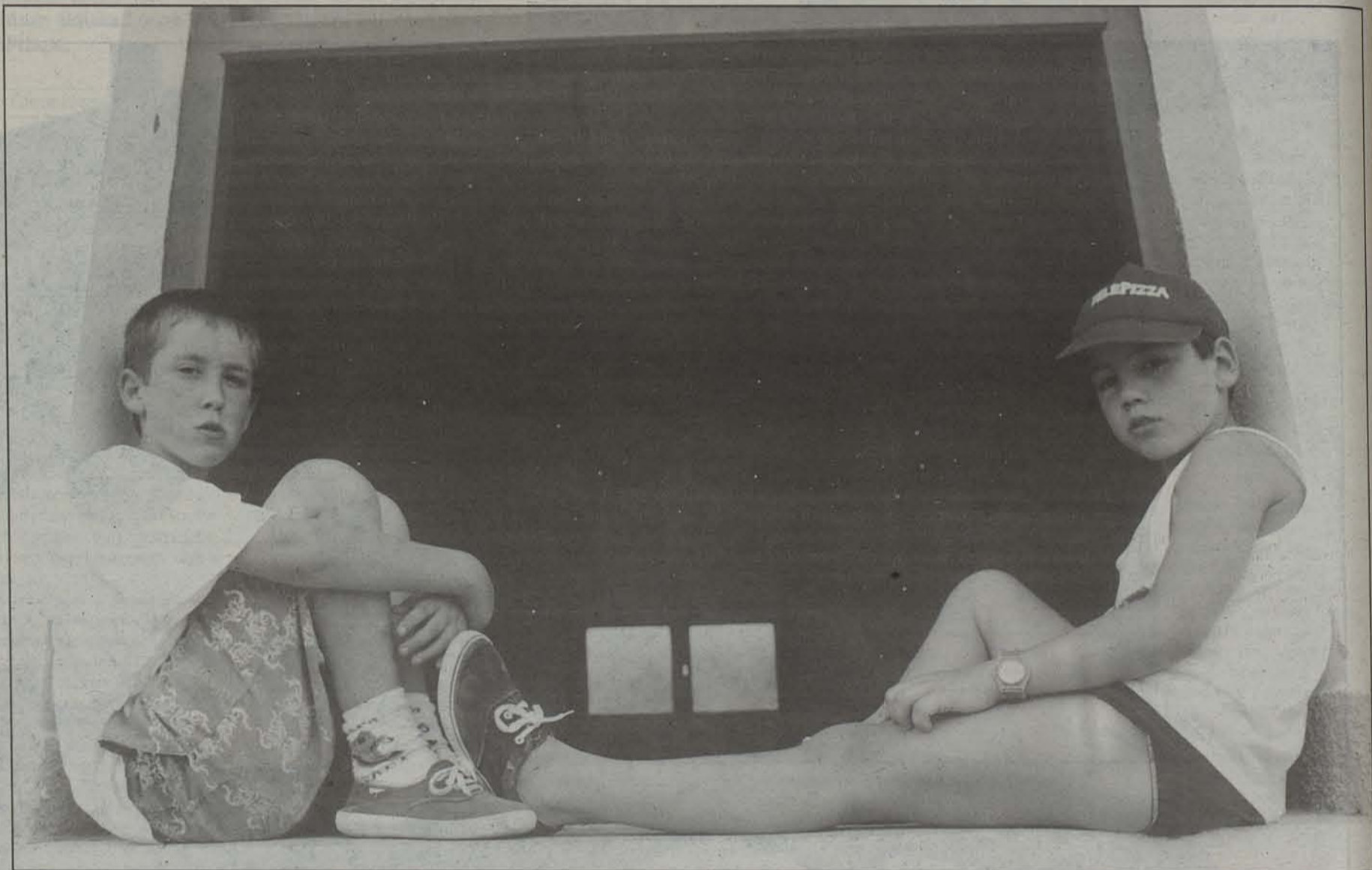
Zortzi eta hamasei urte bitarteko neska-mutilak bildu dira Garesen.

Diabetikoentzako antolatutako udalekuan 33 neska-mutil daude egunotan Garesko Klaretarren ikastetxean