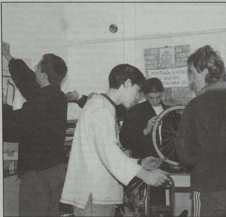
Biciclos proiektuko gazteek txirridulak konpontzen ikasi dute.