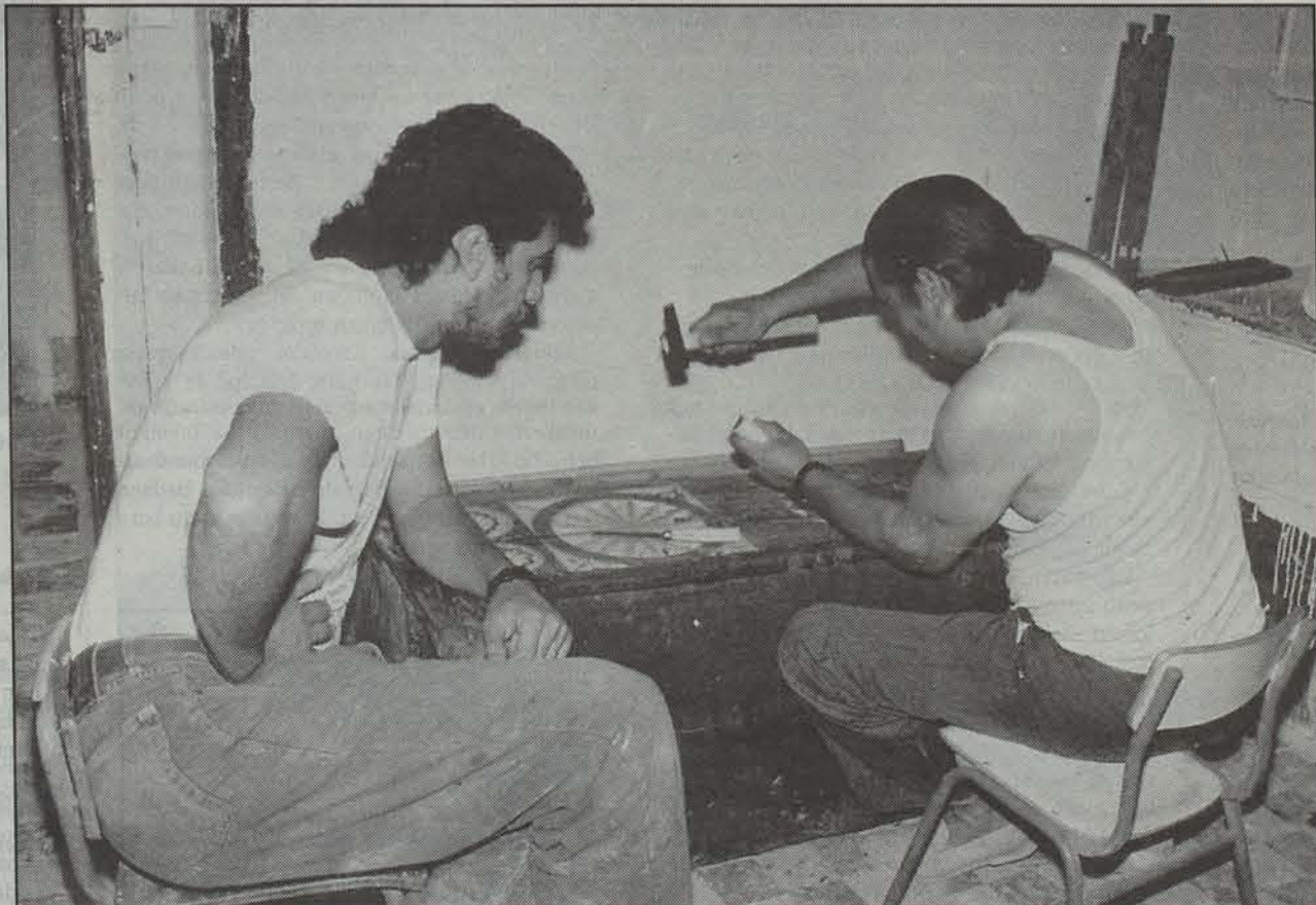
Tuteran altzariak berritzeko proiektua dago martxan Gizalanen eskutik.