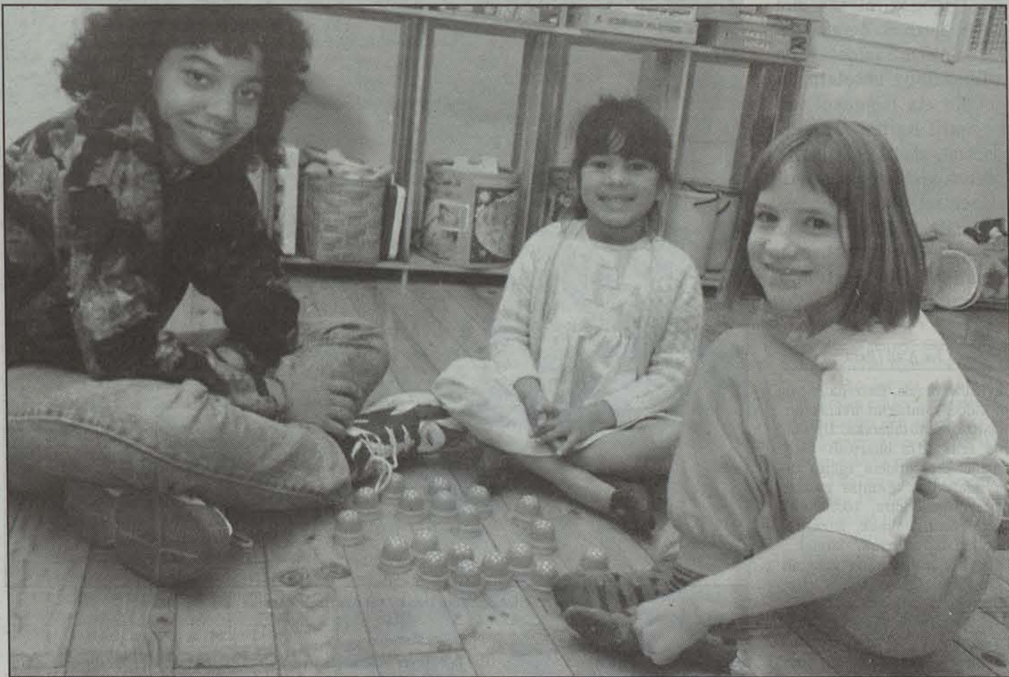
Zentro Pilotuan haurtzaindegia jarri du Udaletxeak, lan egiten duten emakumeentzat.