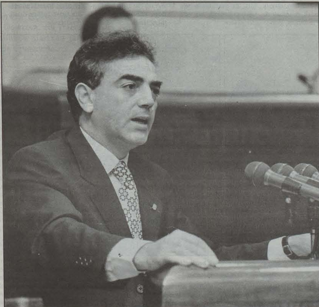
Miguel Sanz Nafarroako lehendakaria.

Dena den, gogoan hartu kantu ikasle trebe hauek dagoeneko eginak dituztela beren lehendabiziko kontzertuak eta emanaldiak, eta inolaz ere ezin da esan arrakastatsuak ez direla izan; konparaziora, hor ditugu Donapea institutuko areto nagusian emandakoa, IKA eta