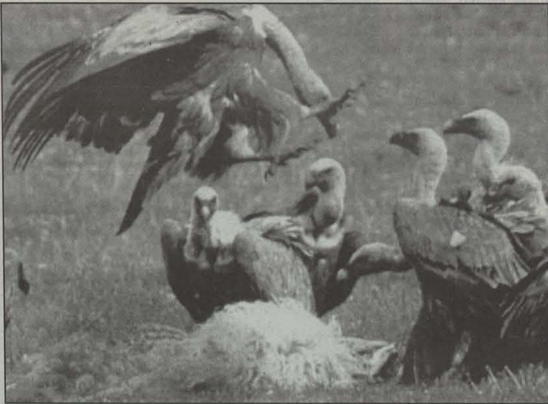
Azken hilabeteetan Nafarroan putreek ardi biziei ustez egindako erasoak eztabaidatu zituzten mahai-inguruan.