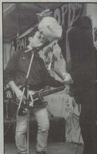
La Polla musika taldea.