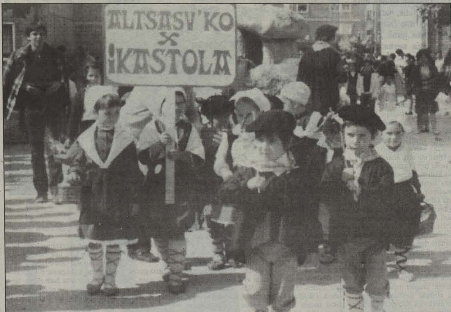
Altsasuko ikastolako neska-mutilak 1973. urteko Nafarroako Ikastolen Egunean.

A ltsasuko Iñigo Aritza ikastolak azken 25 urteetako historia jasotzen duen liburu aurkeztu zuen jendaurrean joan den ostiralean, orain aste batzuk Tafallako Garces de los Fayos ikastolak egin bezala. Ez dira bakarrak, dena den, aurretik gauza bera egin baitzuten Iruñeko San Fermin ikastolak, Lizarrakoak, Etxarrikoak eta Elizondokoak 25. urteburua betetzean. Berakoa ere bere liburu prestatzen hasi da, hemendik bi urtera baitu 25. urtemuga. Liburu eskuetan hartuta, hango ikastolen historiaren berri eman digute Altsasun eta Tafallan.