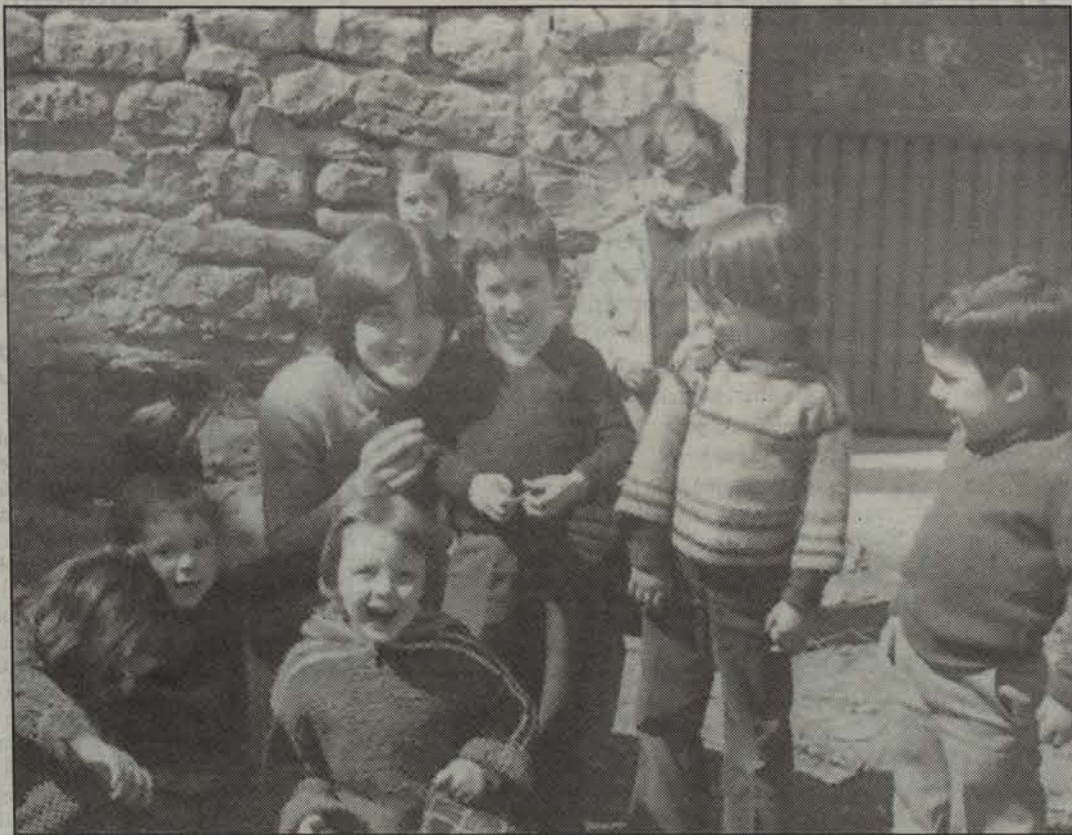
Tafallako ikastolako andereño bat ikasleekin, orain dela zenbait urte.