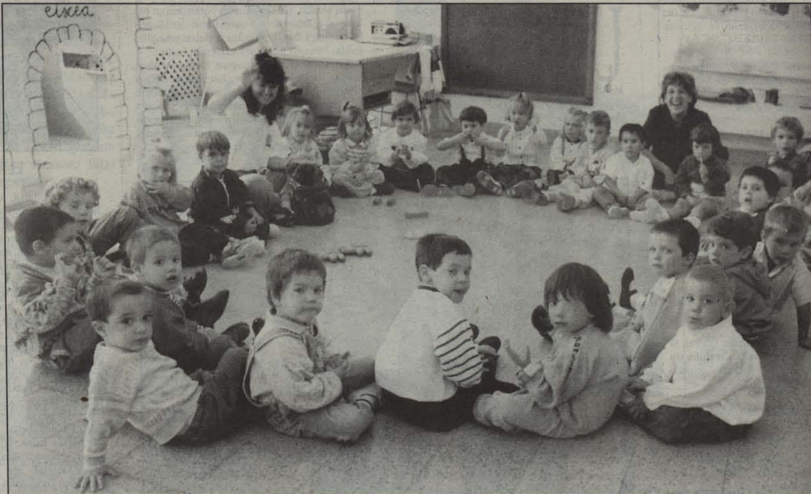
Tafallako Garces de los Fayos ikastolako zenbait haur, andereñoekin.