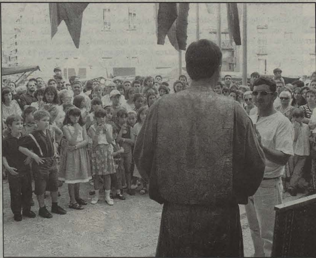
Juglaeren emanaldia, joan den asteburuan Tuteran egindako merkatuan.

Asteburuan Altsasun egingen dutenari dagokionez, eguerdian hasiko da bihar, eta igande gaueko 10ak arte izanen da zabalik. Erdi Aroko juglaeren kalejirak emanen dio hasiera, eta, ondoren, pregoia irakurri ondoren, ofizialki irekiztat emanen dute merkatua. Kalejiraren bidez merkatuari hasiera eman ezetik, beste hainbat ekitalditan parte hartuko dute juglaereek merkatuko txokoetan barrena: malabareak egingen dituzte, ipuin kontalari izanen dira, trobadore, eta abar eta abar. Larunbatean, gai-