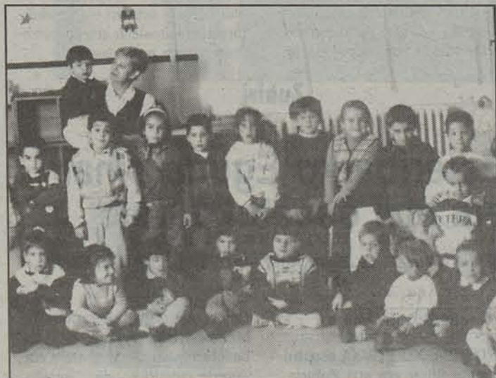
1969. urtean sortu Olazti ikastolako hainbat kide.

Cortes Izal etorri zen, eta horrela sortu zen Olaztikoko ikastola. 1969. urtean jaio zen Olaztikoko ikastola eta egun oraindik martxan da. Sei urterekin, Altsasuko ikastolara pasatzen dira hango ikasleak.