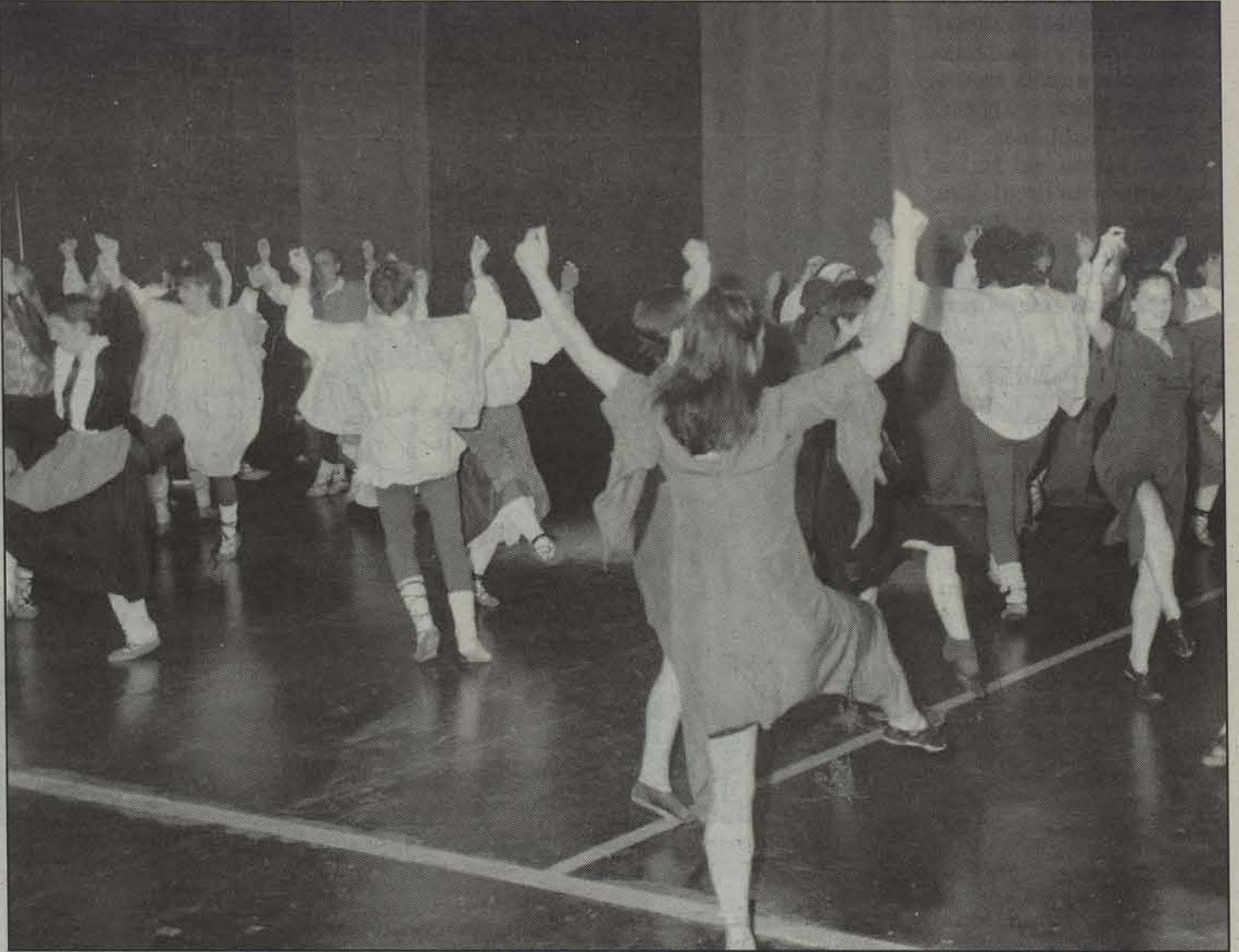
Altsasuko Aitzindari dantza taldeko kideak, hilaren 21ean egin entseiu nagusian.

Aipatutako horiek guztiak ez ezik, bada altsasuarren ikuski-