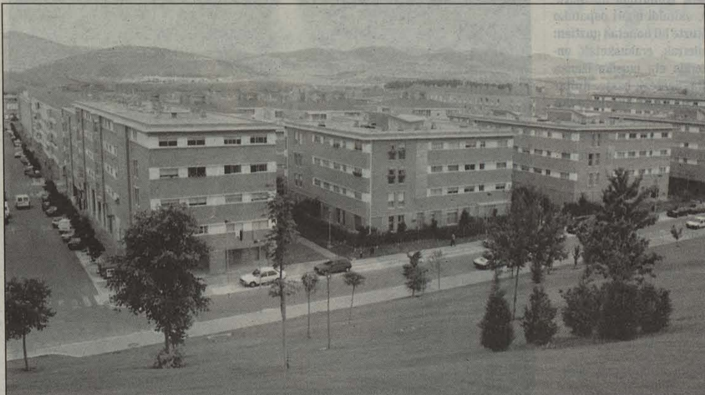
1993. urtean ailegatu ziren lehen biztanleak Mendillorri. Argazkian lehenengo fasea.

Edonola ere, ezin da ahanzi 1993. urtetik asko aldatu direla