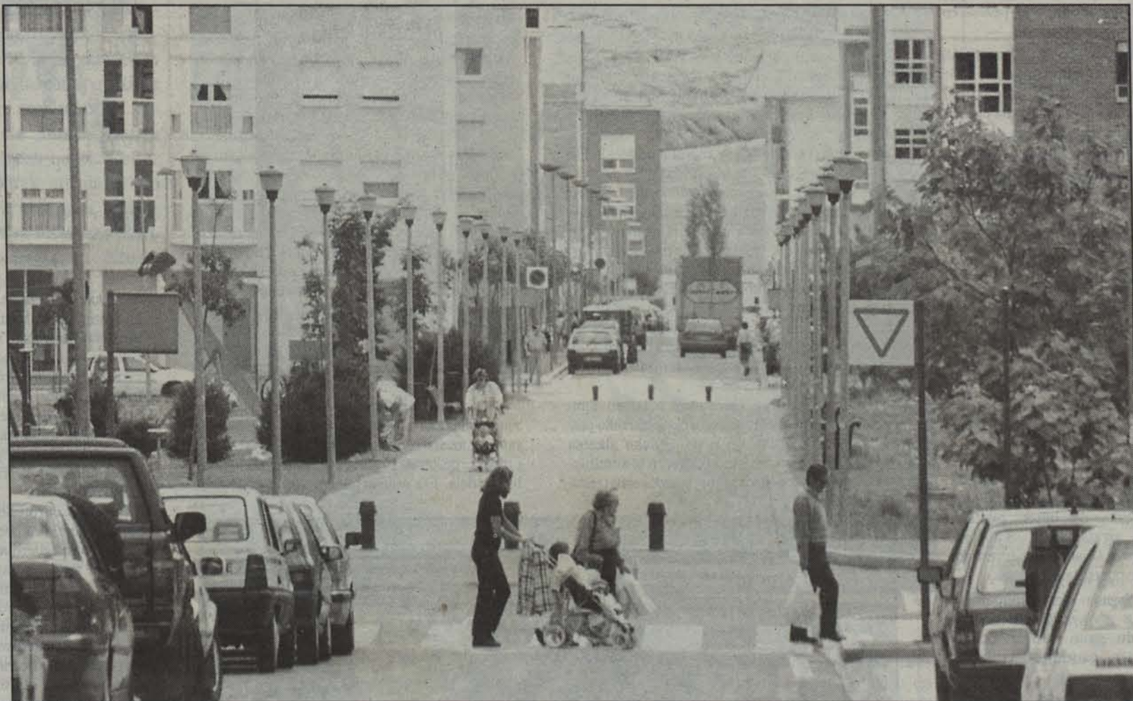
Zazpi milatik gora lagun bizi dira gaur egun Mendillorri urbanizazioko etxeetan.