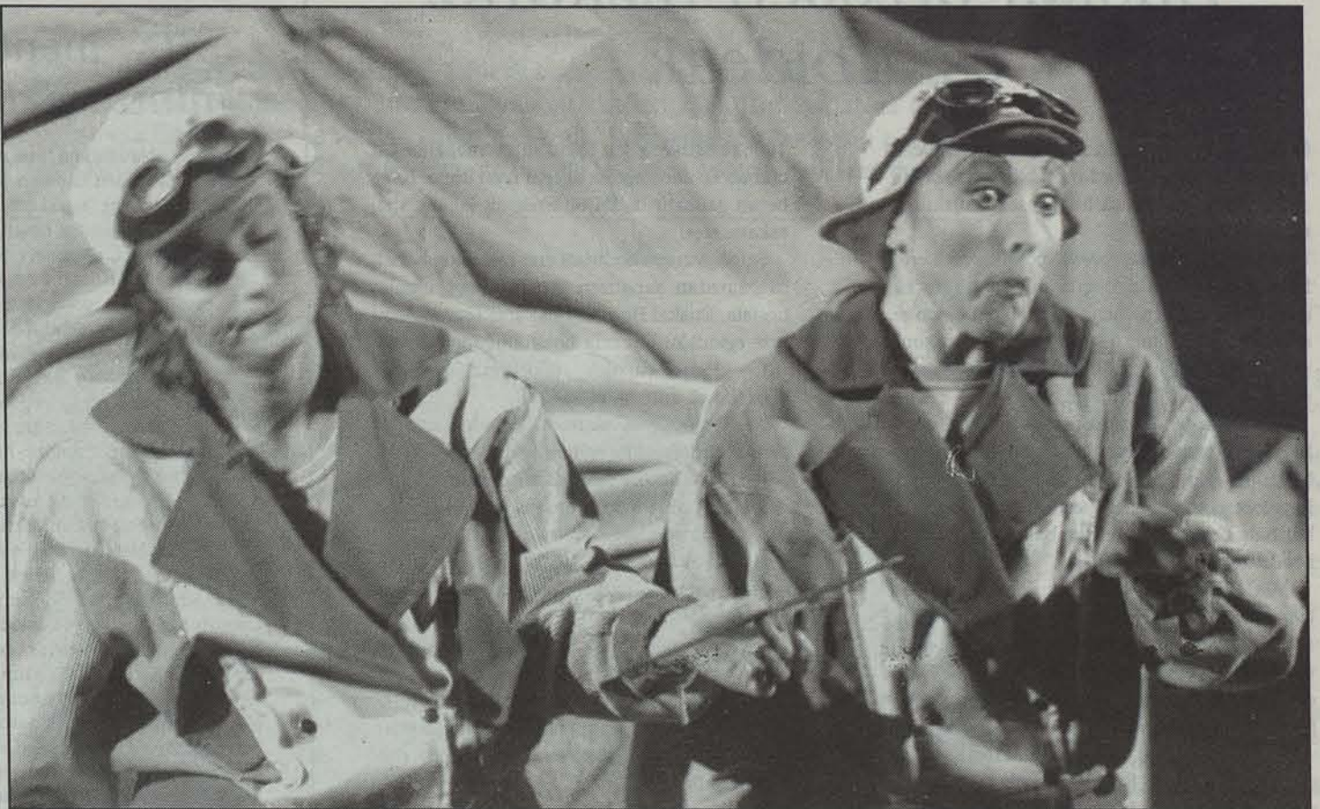
Iruña Pequeño Teatro antzerki taldeak euskaraz eta erdaraz egiten du lan.