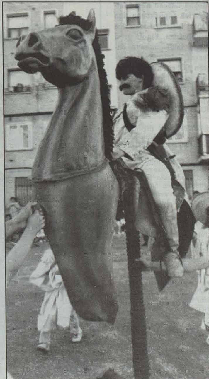
TEN-Pinpilinpauza taldearen El bailecito kale antzerkia.

Nafarroan antzerkiak bizi duen egoerak, dena den, antzerki talde-