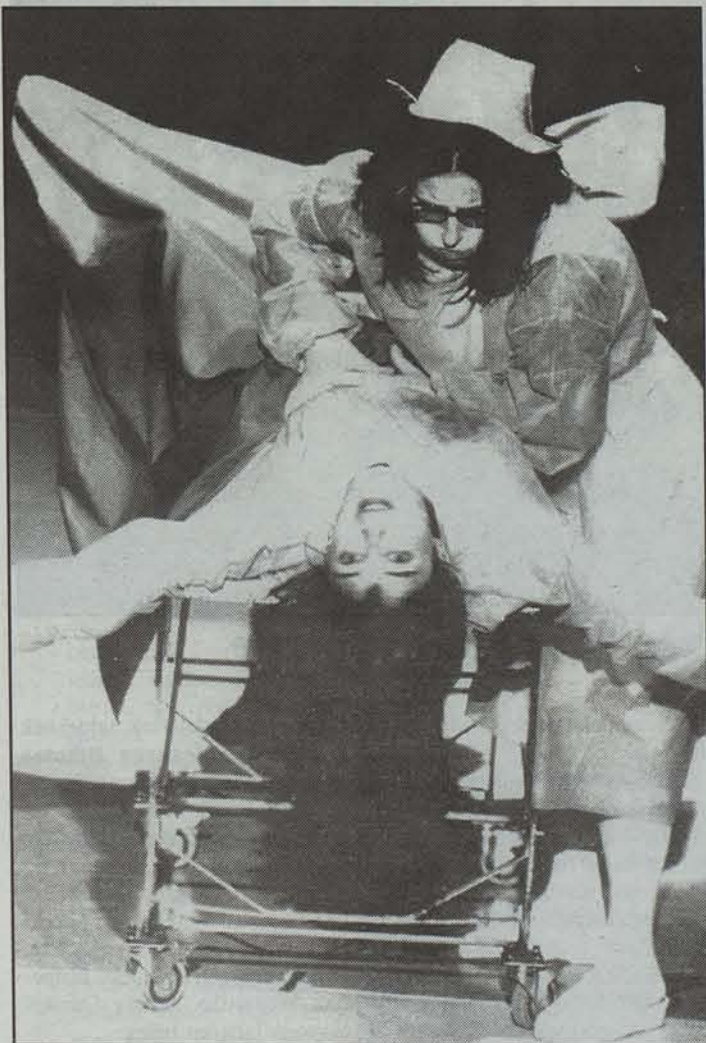
Pasadas las 4 taldearen Baby Boom en el paraiso lana.

Hasieran Nafarroako Gobernuaren laguntza zuen kultur elkartea izan zen eskola, baina pixkanaka edozein irakaskuntza zentroak duen egitura lortu zuen. Gaur egun, 50 lagun ari dira han arte dramatikoa ikasten. Denerata, hala ere, 2.000tik gora pertsonak hartzen dute parte NAEk antzerkiaren inguruan urtean zehar antolatzen dituen ekitaldi, ikastaro eta tailerretan. Nafar-