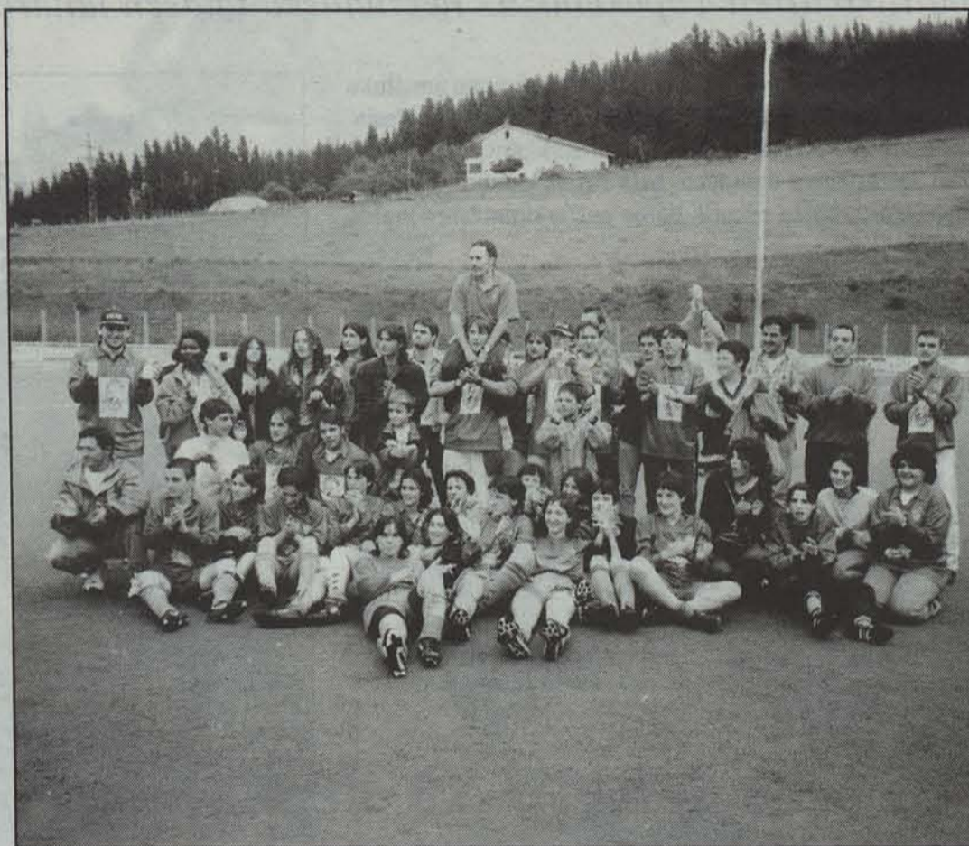
Gure Txokoa taldeko jokalariek zaleekin batera garaipena ospatzen.