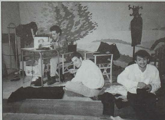
Xahutondo antzerki taldeko hiru kide, antzezpina egiteko jantziak prestatzen.

Iruñeko institutuetan gero eta leku gehiago du antzerkiak, «eta ikastetxe batzuetan, hautazko ikasgaia da». Eta beste ikasgai bat den aldetik, antzerkia insti-