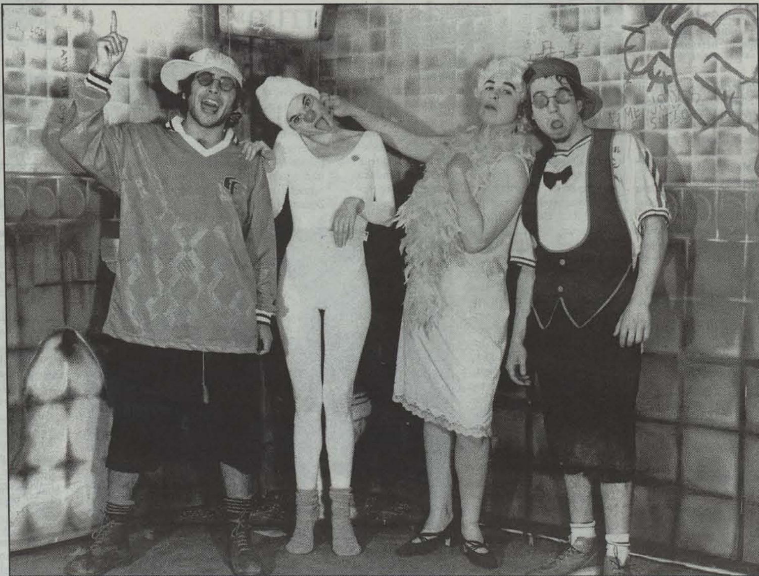
Balada tierna de un gamusino antzeztu duen T'Ombliigo taldeko kideak.