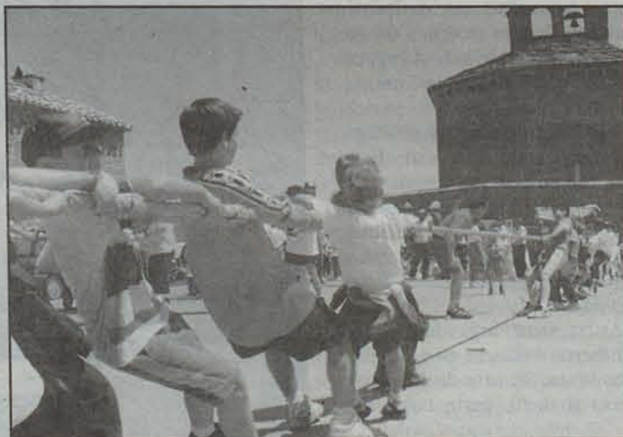
Iaz bezala, aurten ere haurrak izanen dira protagonista.

Bazkaldun ondoren, arratsaldeko lauretan, izanen da eguneko hurrengo ekitaldia, antzerkia alegia. Haurrentzako obra bat taularatuko du Sambu taldeak. Azkenik, arratsaldeko sei eta erdiak aldera, etxerako bidea hartuko dute berriro txirrindulariek eta Eunatera hurbildutako gaitontzeko lagunek.