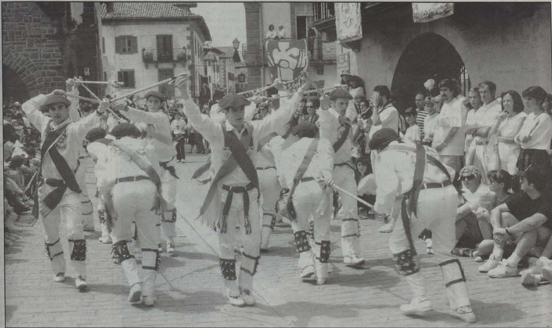
1963. urtean sortu zen Baztandarren Biltzarrak Euskal Herri osoko jendea biltzen du.