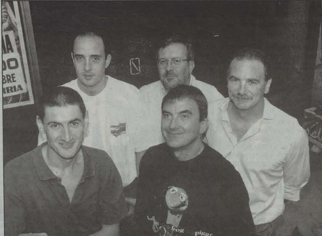
Oskorrik kontzertua eskainiko du bihar Leitza pilotalekuan.