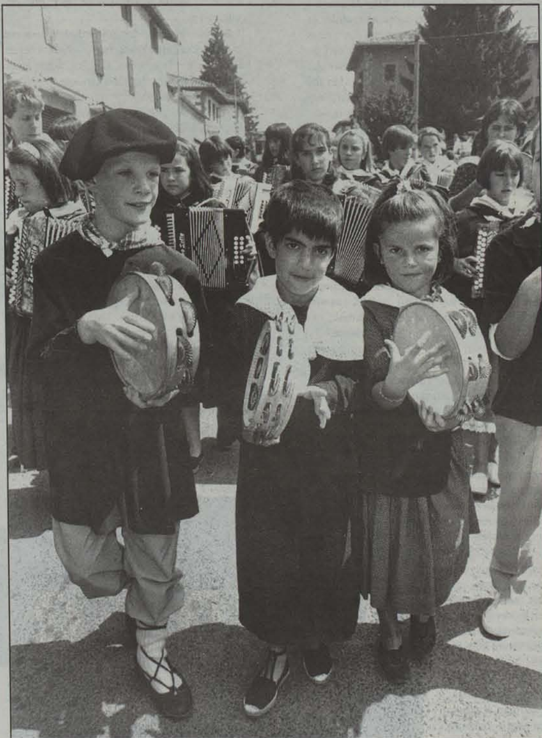
Meza, desfilera eta bazkaria ezezik, musika eta dantza ere badira eguneko protagonista.