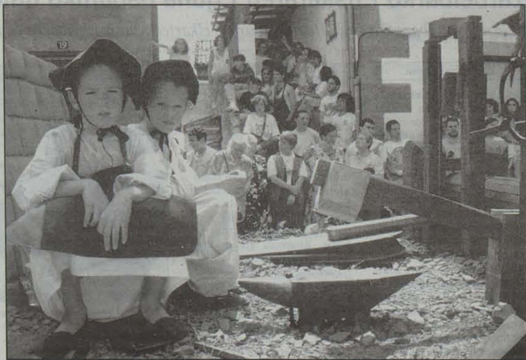
Orga desfilea Baztandarren Biltzarreko ekitaldi nagusia izaten da urtero.