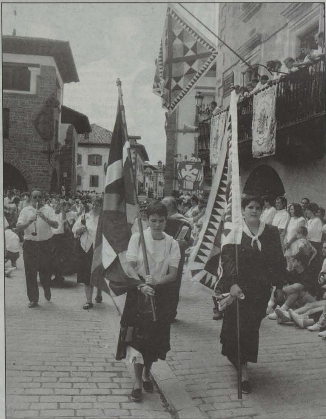
Txistulariak Baztandarren Biltzarran, Balleko Etxearen aurretik pasatzen.

Asierrentzat argi dago Baztandarren Biltzarra ez dela edozein besta. 20 urte ditu eta bakarra zuenetik parte hartu du