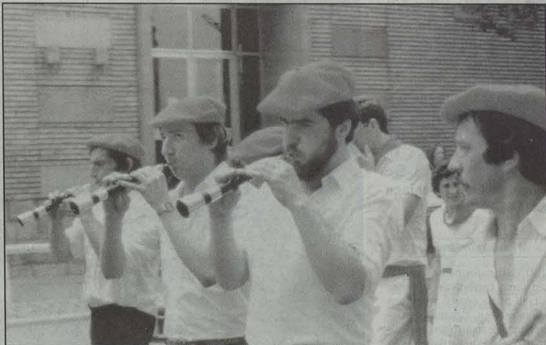
Baigorriko gaiteroak askotan izan dira Hego Euskal Herrian ere.