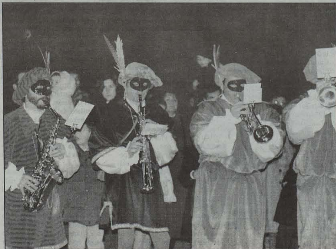
Banda eta txarangak Iruñeko karraketan barrena ibiliko dira bihar berriro.