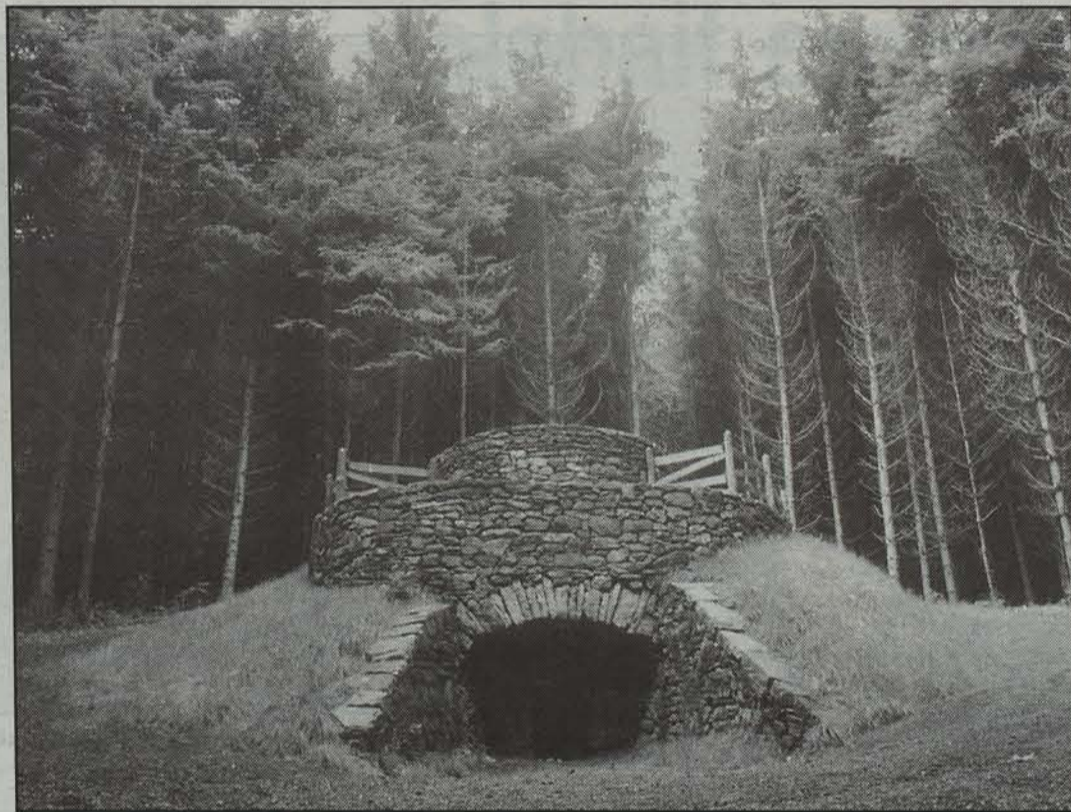
1997. urterako plana onartu zuen asteartean Bertizko batzordeak.