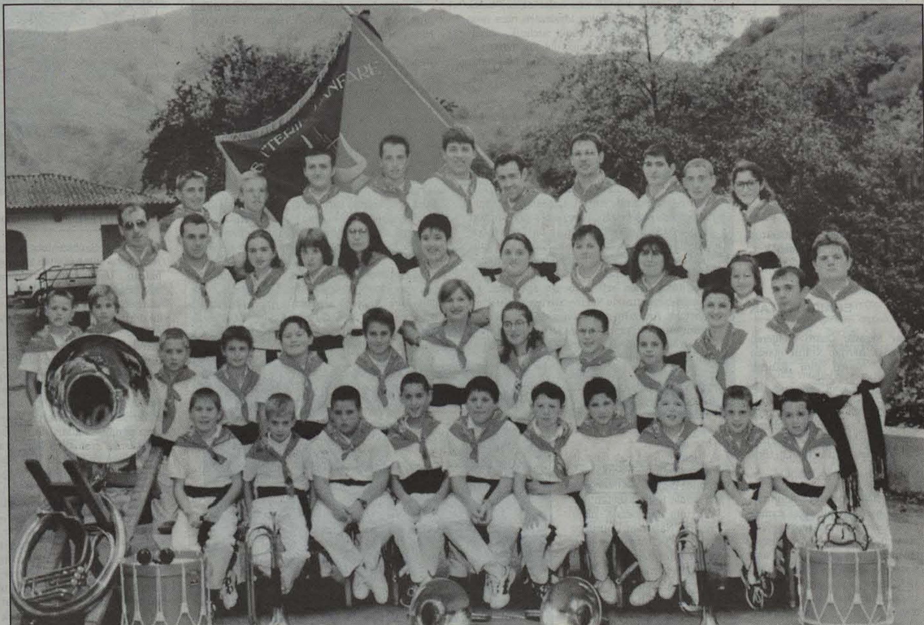
Baigorriko fanfarreak ere parte hartu du gaiteroen diskoan.