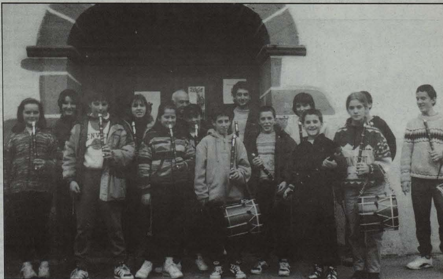
Txistulari taldeko gazte batzuk ageri dira argazkian, Musika Eskolaren atarian.