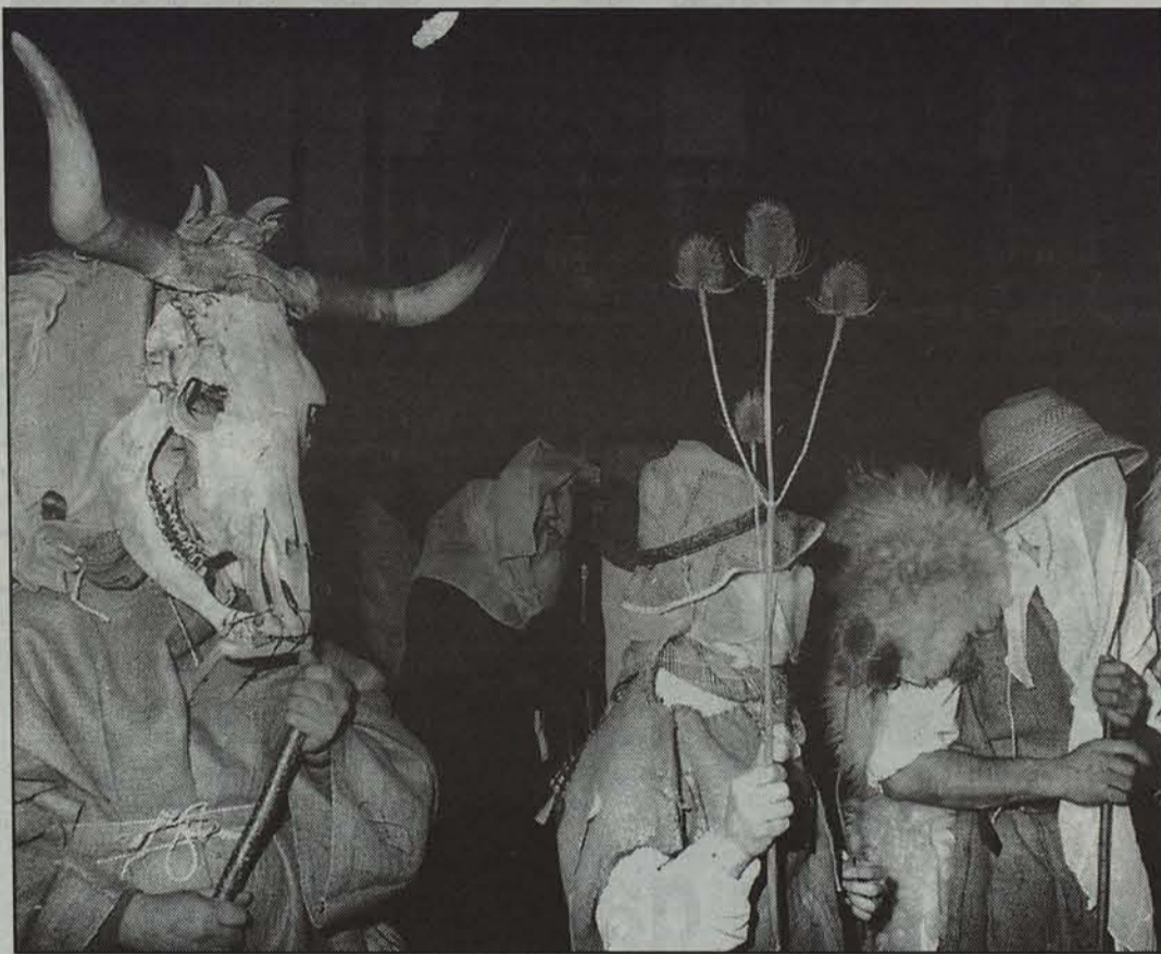
Mozorroren aukera anitz izanen dute leitzarrek datozen egunetan.

Igandean pilota partidua izanen dira, Aurrerako Pilota Eskolak antolatuta. Leitzaorrek azpeitiarren kontra ariko dira. Ondoren, arratsaldeko ordu bi eta erdietan, bazkaria eginen dute Pilota Eskolako haurrek. Kirolaz gain, izanen da besterik Leitza-