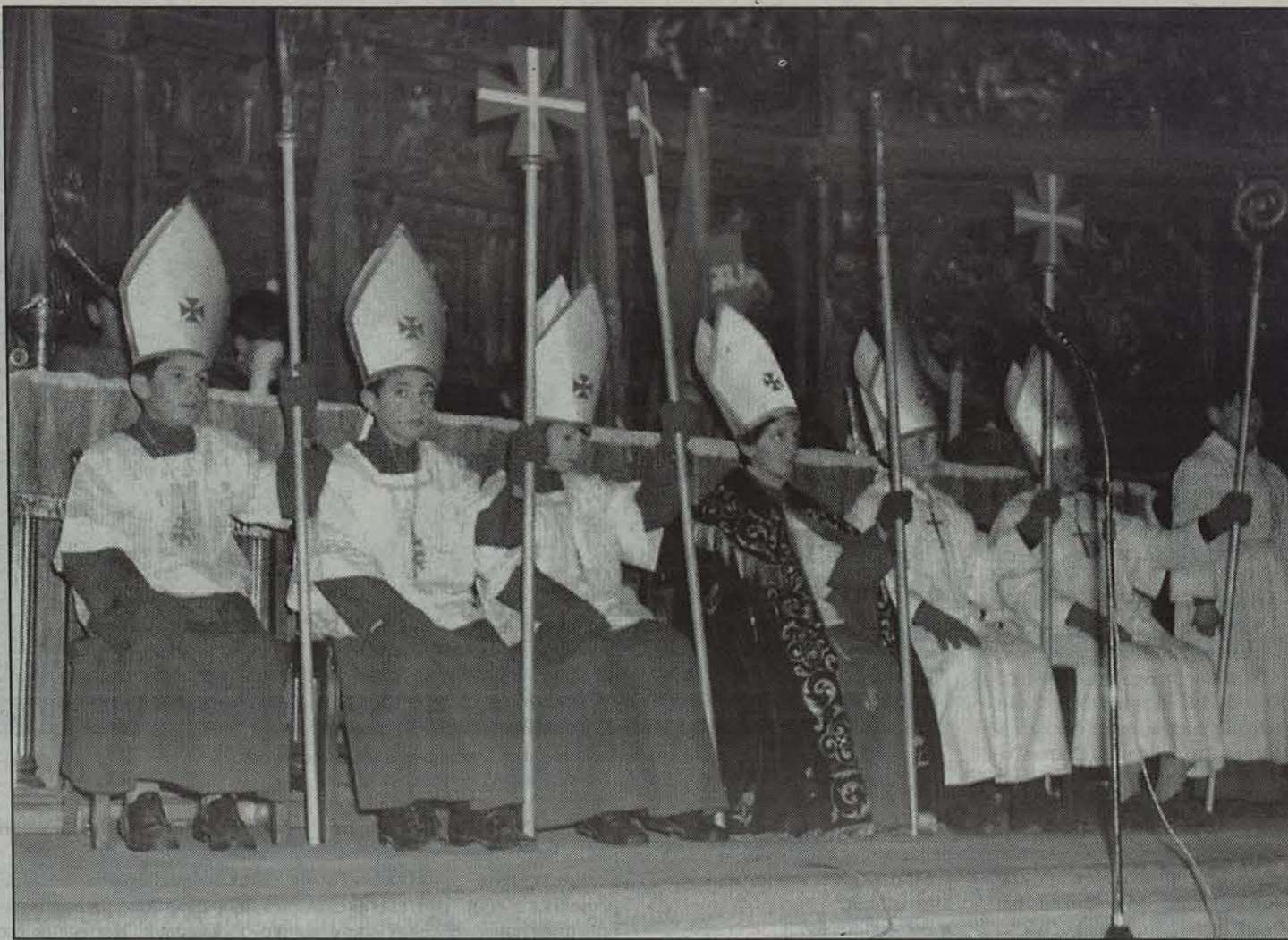
XIV. mendetik dago dokumentazio idatzia ekitaldi honi buruz.

Beraz, bost mende pasatu arren, erregina posible batentzat ez dago tokirik. Pertsonaia garrantzitsuenak honako hauek dira: Nafarroako errege Karlos III.a, haren alaba Nafarroako Zuriñe andrea, eta honen iloba, Vianako printzea. Horiez guztiez