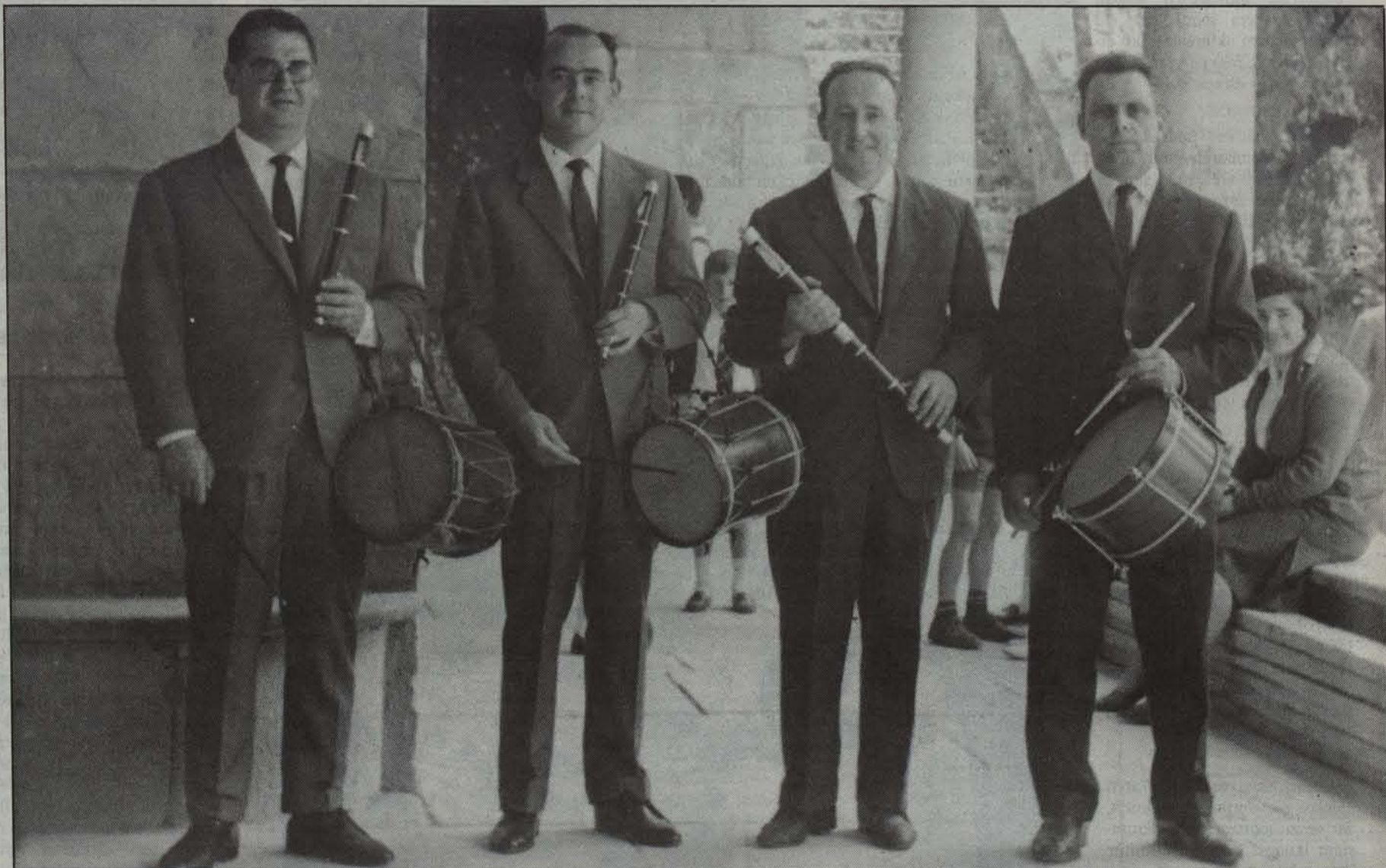
Txistulari anitz eman ditu Berako herriak urteetan zehar.