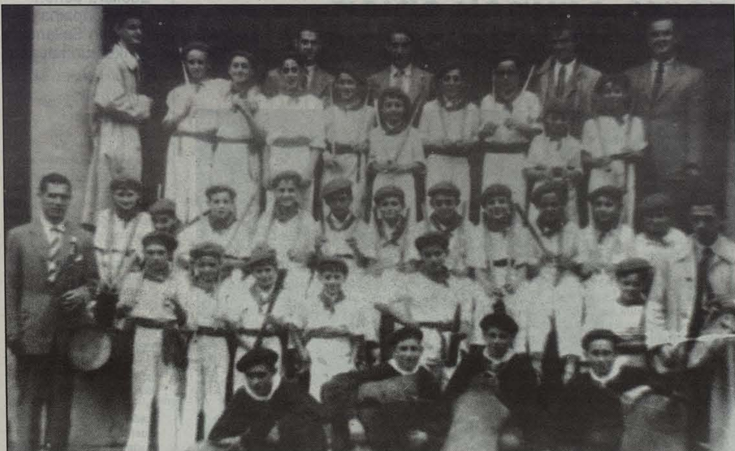
Berako txistulariek eta dantzariak harreman-estua izan dute beti.