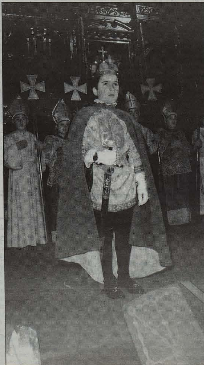
Babaren Erregea, koroak jantzita Gorteen aurrean.

Dantzariak eta abesbatzak ere hartuko dute parte • Aintzindari Dantza Taldeko kideek Nafarroako Gortetako himnoa dan-