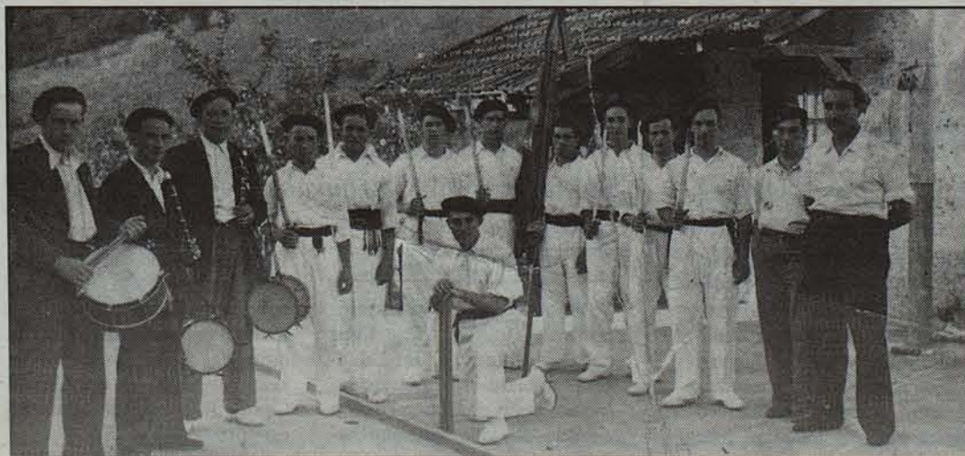
Dantzaria egun garrantzitsuetan laguntzeko txistulariak ez dira inoiz falta izan Beran.

Kultur Etxea egun horretan Legia eta Alzate karrikak apaintzen diren bezalaxe apainduko dute igandean, lore, iratze eta bertzelakoekin. Txistulariei egun horretako hamaiketako Iriarte