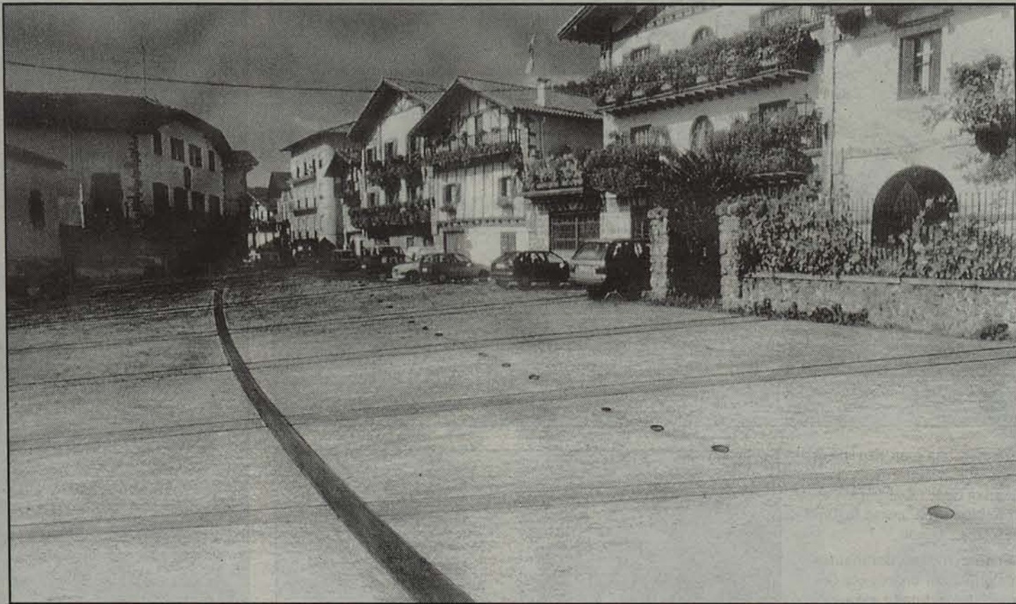
Lanak egin eta gero, marrazkiak azaltzen duen itxura izanen du Altzateko plazak.

J oan den ortziraletan aurkeztu zen jendearen aitzinean Berako trabesbidea hobetzeko proiektua. Proiektuak herria zeharkatzen duten errepide guztiak biltzen ditu eta Altzateko plazan jasoko ditu berrikuntza nagusienak. Hobe-kuntzaren aurrekontua oraindik finkatu gabe dagoen arren, 150 milioi pezeta ingurukoa izanen dela aurreikusi da.