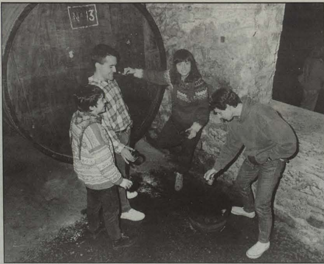
Sagardoa upeletik dastatzeko aukera izanen da gaurtik aurrera eta, ia bezala, jende ugari hurbilduko dela uste dute sagardogileek.

berreskuratzen • Lau sagardotegi hauen helburua berdintsua izanik, euren ibilbidea ere parekoa izan da. Beruete eta Lekarozkoa sortu ziren lehendabizi, Lekunberrikoa ondoren, eta azkenik Aldatzkoa. Azken honek bigarren denboraldia izanen du aurtengoa. Berueteko sagarrondoak, berriz, zazpi bat urte dituzte jada. Lekarozko sagardotegiak aurtengo beteko du laugarren denboraldia; Lekunberri-