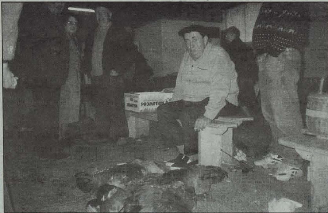
Baxenabarreko merkaturik garrantzitsuenak da Donapaleukoak.

Barnealdeko herrietako merkatuak, oro har, behera ari dira hipermerkatuak non-nahi jartzen ari direlako, baina Donapaleukoak ehundaka urtetako tradizioa du oraindik Baxenabarre-