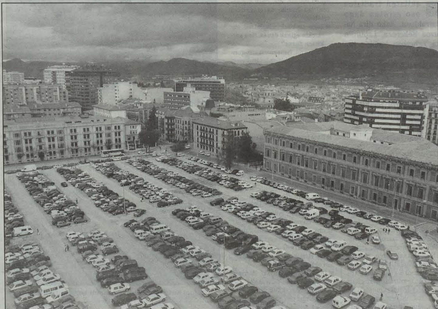
Egun Padre Moret izena duen aparkaleku honetan paratu nahi da Entzutegia eta Kongresuetarako Auditoriuma.