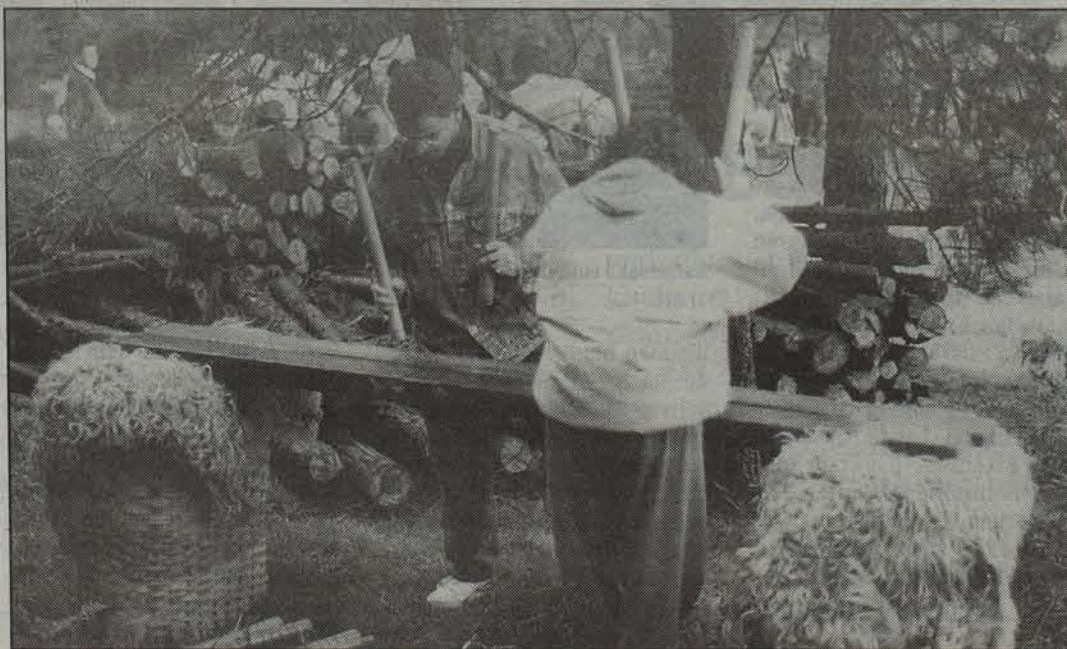
Txalaparta jotzen ikasteko aukera izango dute hiriburukoek.