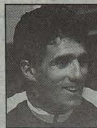
Miguel Indurain Txirrindularia