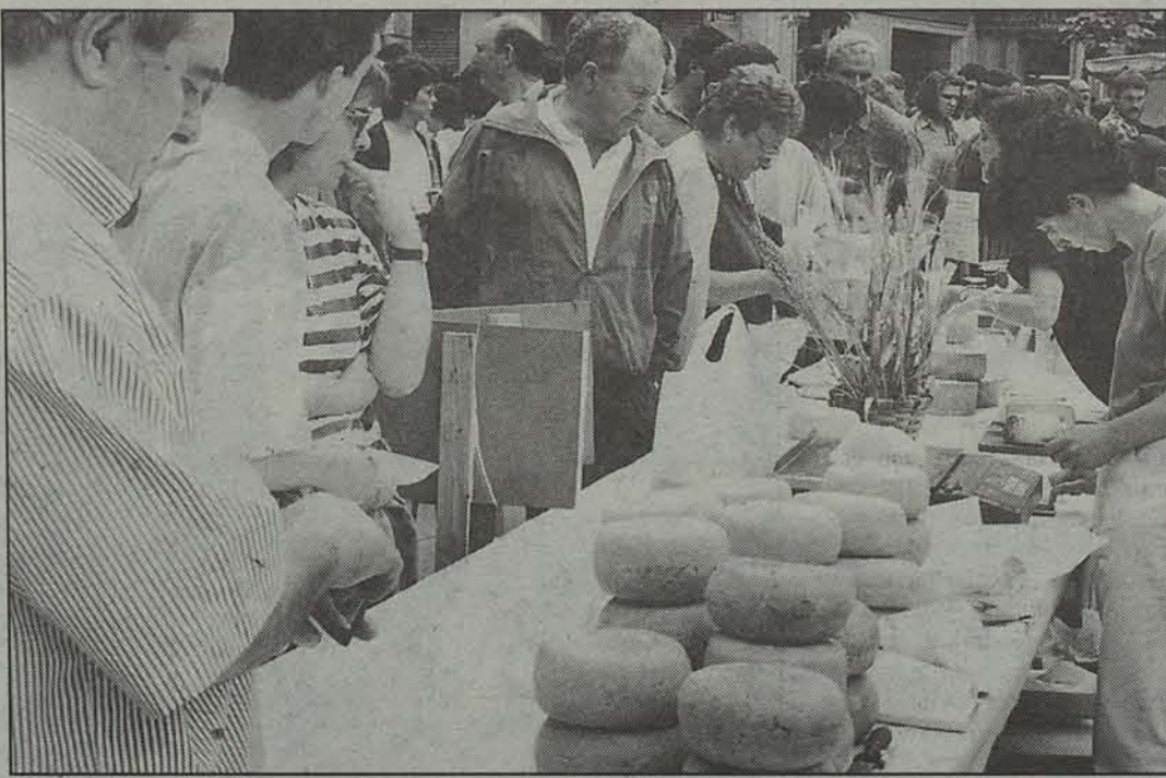
Bertako produktuen azoka egingen dute bihar Donezteben.