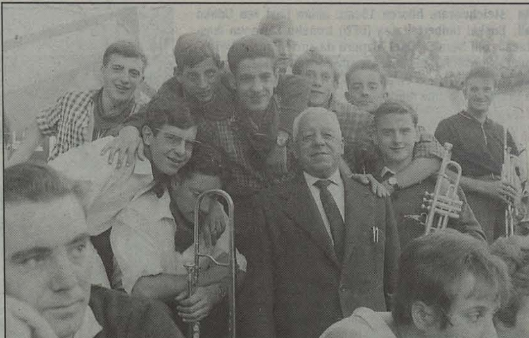
Zangozako Udal Banda mendeurrena ospatzen ari da aurten ekitaldi ugari bidez. Argazkietan, banda 1963-1966 urteetan.

Harik eta Juan Frances de Iribarren Musika Eskola sortu zen arte, 70eko hamarkadan, Zan-