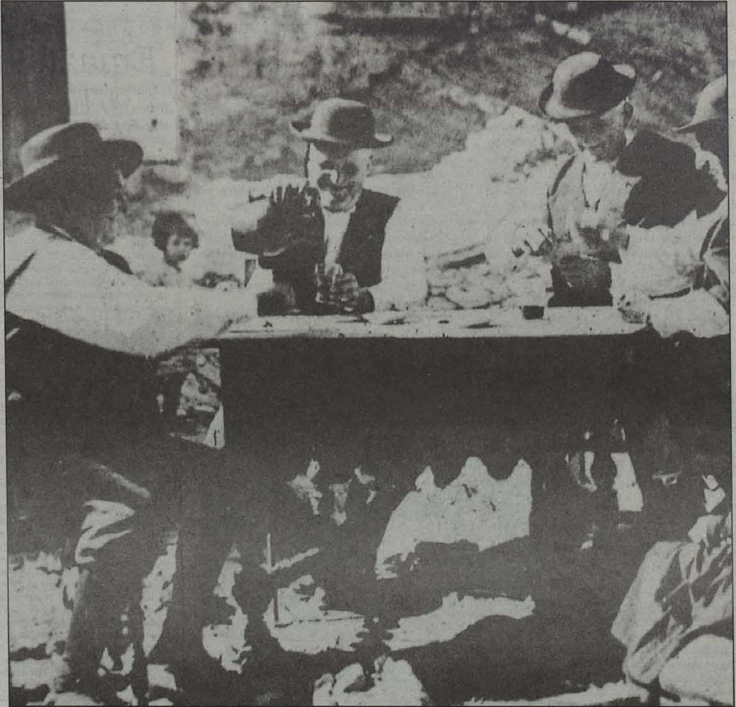
Izabako kaleetan musean aritzen ziren bertako herritarak. 1915-1925 bitartekoa da argazkia.