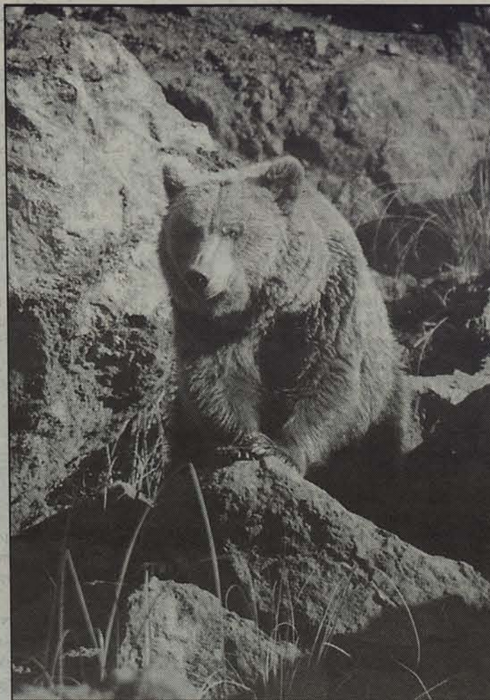
Aurten hartzaren aztarna ugari aurkitu dute Erronkariko mendietan.

LANE: «Iberiko Penintsulan eta Europa osoan gertatzen ari den moduan, otsoa antzina galdutako eremuak berreskuratzen ari da»