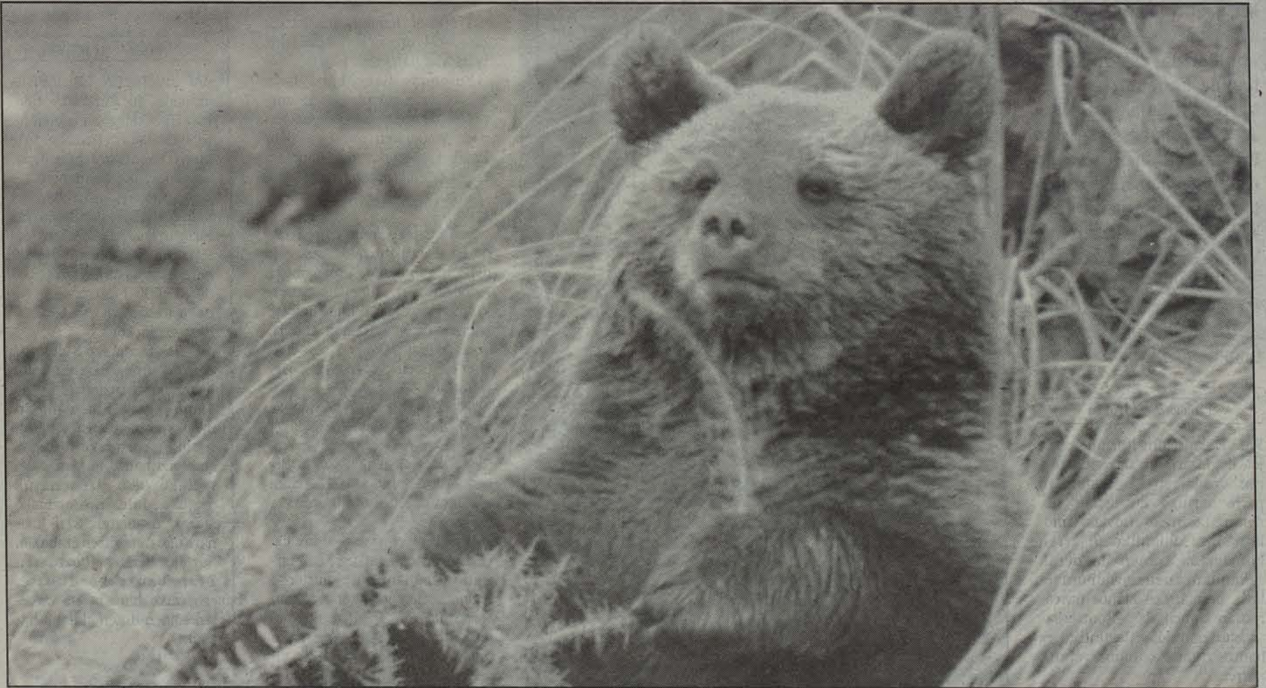
Hartza Berreskuratzeko Plana astelehenean onartuko dute ziurrenik. FERNANDO HUALDE

O tsoak itzuli ote dira Nafarroara? Azken asteetan Urbasa, Aralar eta Lerinen izandako erasoen ondoren, hala dela dirudi. 25 bat ardi hil dituzte Nafarroan, beste hainbeste Gipuzkoan. Nafarroako Ingurugiro Sailak, hala ere, ez du oraindik otsoak izan direla ziurtatzeko froga ziurrik aurkitu. Dena den, aspaldiko beldurrak piztu egin dira berriro gure herrialdeko artzainen artean. Nafarroa inguruko lurraldeetan gero eta otso gehiago dago eta hori izan daiteke Nafarroara etortzeko arrazoia. Azkenekoz 1981. urtean izan zen otso bat gurean, eta bost tiroz hil zuten.