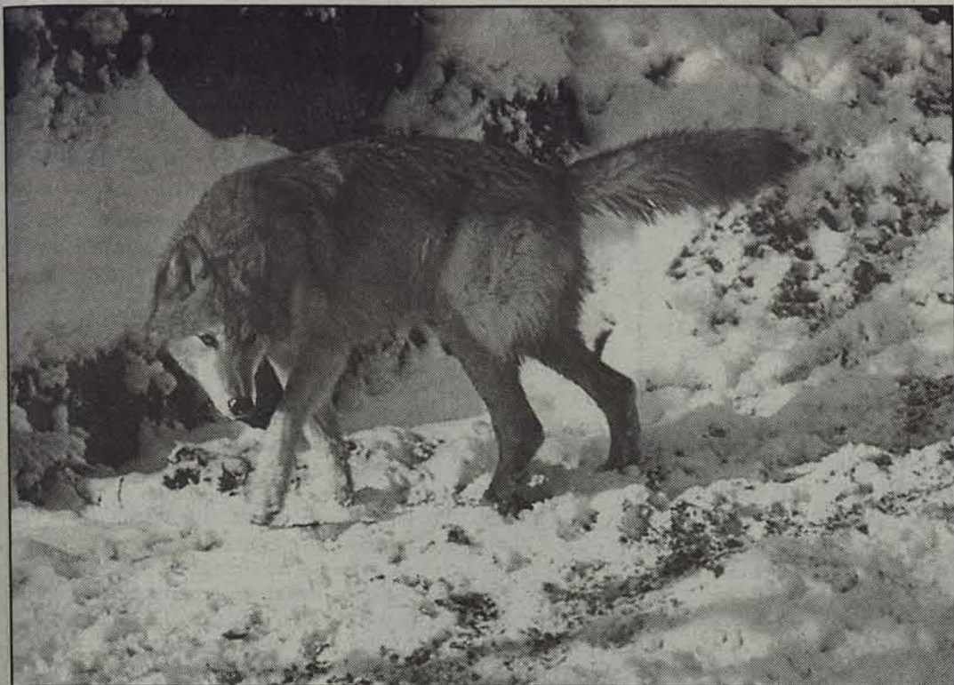
Ingurugiro Saileko arduradunen ustez goiz da otsoa itzuli dela errateko.