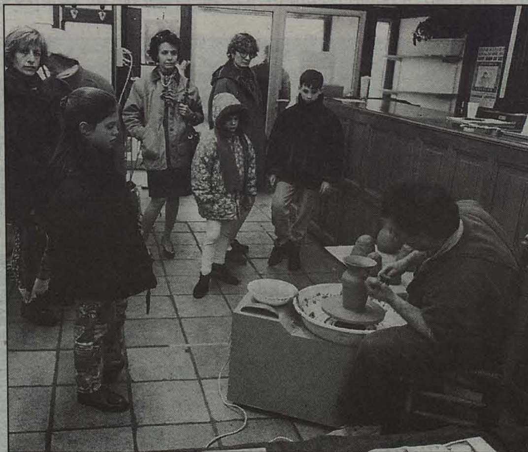
Eskultura eta zeramika ikastaroa izanen da abuztuan Zangozan.