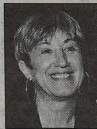
Helena Taberna Zinemagilea