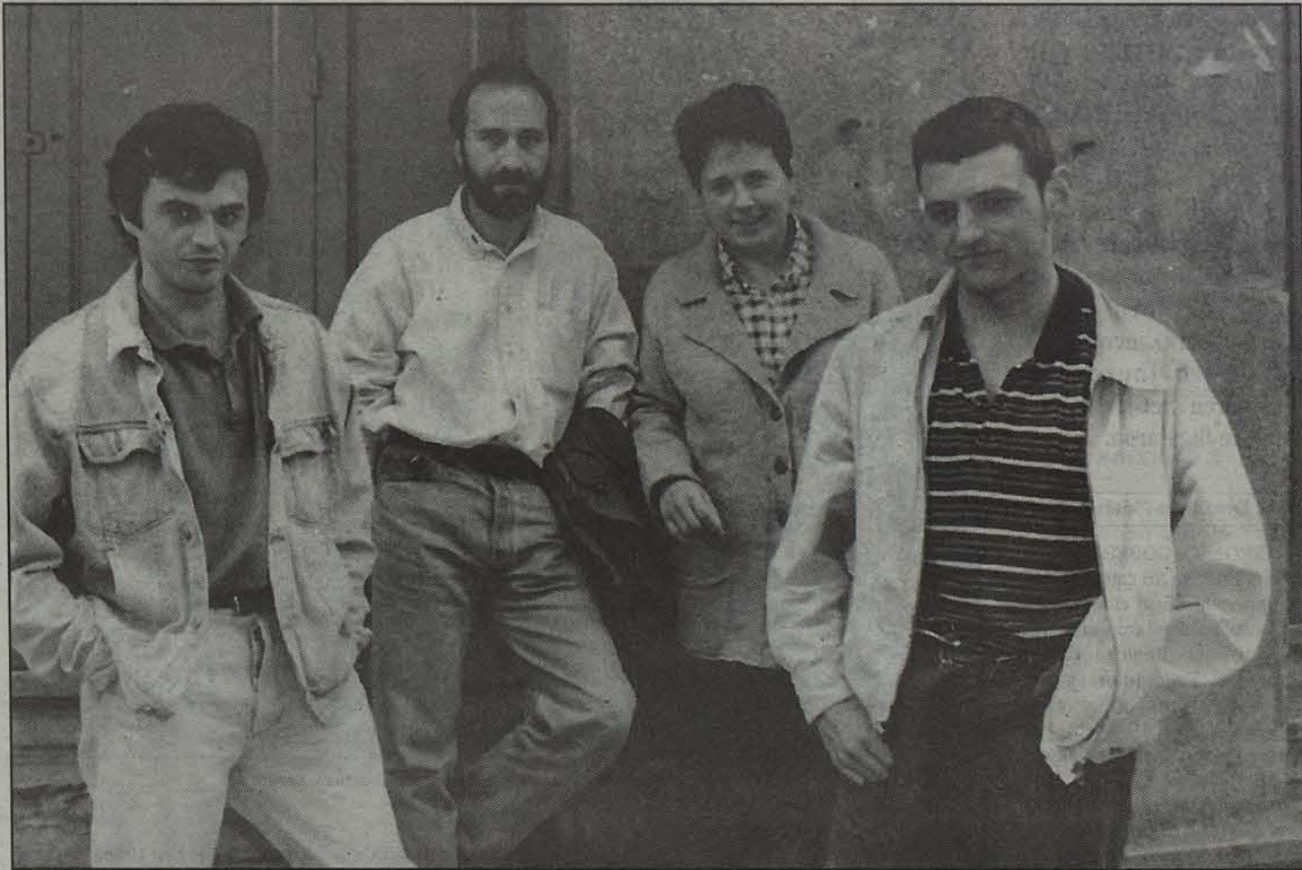
Eskoziako Highlands eskualdean daude ikusgai lau artista nafarren obrak.

Paper gainean egindako lan berriak • Artista nafarrek Eskoziara bidali duten lanak, paper