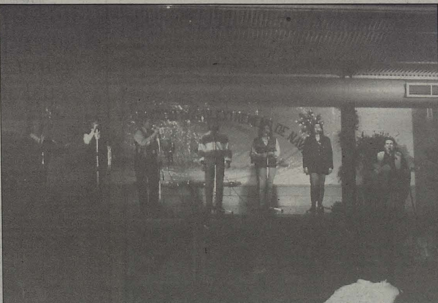
Kenai folk talde berriko kideak Gaiarren izanen dira 12an, Enclavekoekin batera.