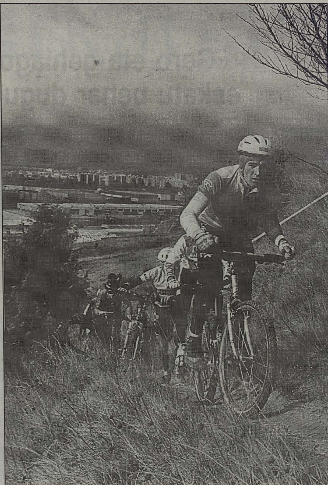
1992-1993an izan zuen mendiko txirrindularitzak gorakadarik nabarmenena.