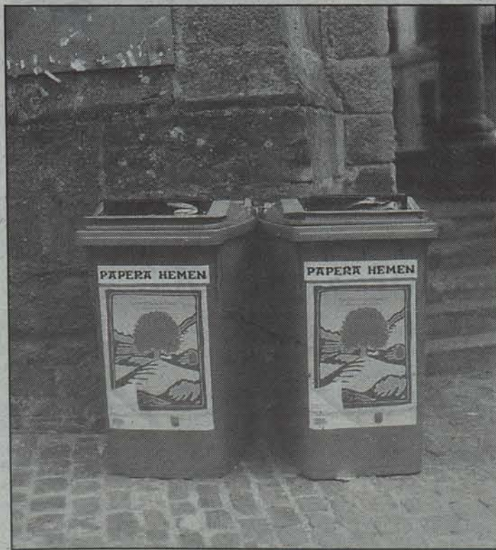
Gisa honetako paperontziak paratuko dituzte Bortzirietan.

Azkenik, kontuan izan behar da, paper zaharretatik eratorritako papera ekoizteak, % 30 eta % 50aren arteko energiaren murrizketa dakarrela. X