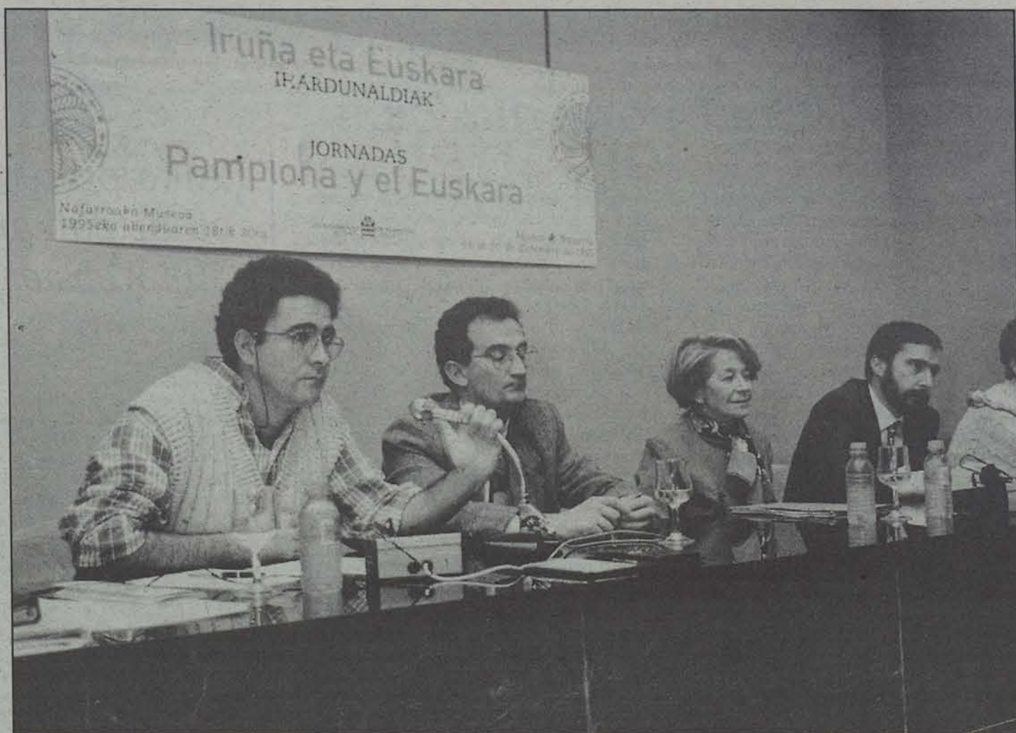
Iruñearen eta euskararen arteko harremanaz eztabaidatu zuten jardunaldietan.

Nafarroan, hala ere, bazen beste elurzulo ezagun asko ere. Horien artean, besteak beste, Aras, Muruzabal, Erriberri, Fitero, Urantzia, Otsakar, Nabatz edo Iruñeko Erret Jauregiakoa aipa daitezke. Azpimarratzekoa da, Tuteran, Corella eta Vianan, adibidez, hiruna elurzulo zutela. Lapoblacionen, berriz, lau zituzten, eta Logroñon ere saltzen zuten bertako elurra. X