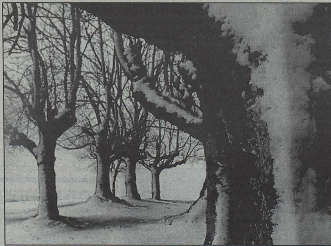
Elurra sendagarri gisa erabiltzen zuten, besteak beste.