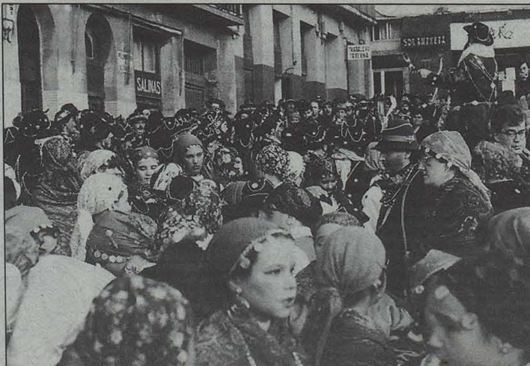
Hungariar ijitoek hartuko dituzte berriro Iruñeko kaleak.

Beratarraren artean arrakasta handiko jaia da inauterietan etorrera iragartzen duen kauteren eguna eta jende askok hartzen du parte. Iazko egunean, adibidez, ehun lagun inguru bildu zen Berako karraketan kauteren soina jantzita. Kauteren jai berezi eta zoragarria, hala ere, ez da berria, 70eko hamarkadako azken urteekin batera hasi baitziren ospatzen Beran. X