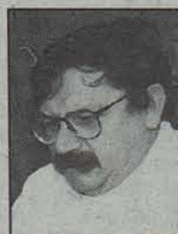
Paco Ignacio Taibo II Idazlea

■ Jorge Oteiza eskultore oriotarrak bere eskultura bat paratuko du Nafarroako Unibertsitate Publikoan (NUP). Oteiza astelehen arratsaldean izan zen Iruñean, NUPeko eraikuntzak ikusten. Eskultore oriotarrak ezarriko duen eskultura Saenz de Oiza Nafarroako Unibertsitate Publikoaren arkitektura proiektua egin zuenaren omenez izanen da. Eskultura unibertsitateko lorategietan kokatuko da, ikasleen gelen eta liburutegiaren artean. Oraindik ez da erabaki noiz paratuko den eskultura Iruñeko unibertsitate garraiatzen zaila izanen delako, nahikoa handia baita. Oteizak erran duenez, eskultura liburu irekia da eta era berean hegan ari da, 'poesia eta sormena hegan egitea delako'.