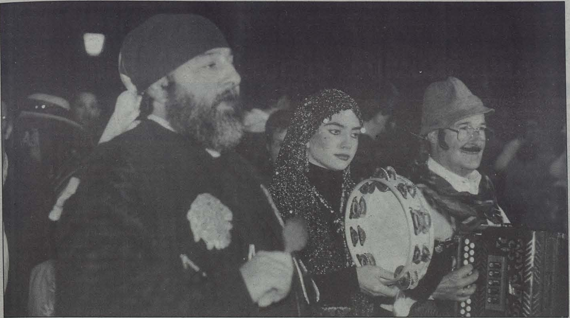
Iazko kauteren eguna, Iruñeko Errekoletak plazan.