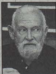
Jorge Oteiza Eskultorea

■ Jorge Oteiza eskultore oriotarrak bere eskultura bat paratuko du Nafarroako Unibertsitate Publikoan (NUP). Oteiza astelehen arratsaldean izan zen Iruñean, NUPeko eraikuntzak ikusten. Eskultore oriotarrak ezarriko duen eskultura Saenz de Oiza Nafarroako Unibertsitate Publikoaren arkitektura proiektua egin zuenaren omenez izanen da. Eskultura unibertsitateko lorategietan kokatuko da, ikasleen gelen eta liburutegiaren artean. Oraindik ez da erabaki noiz paratuko den eskultura Iruñeko unibertsitate garraiatzen zaila izanen delako, nahikoa handia baita. Oteizak erran duenez, eskultura liburu irekia da eta era berean hegan ari da, 'poesia eta sormena hegan egitea delako'.