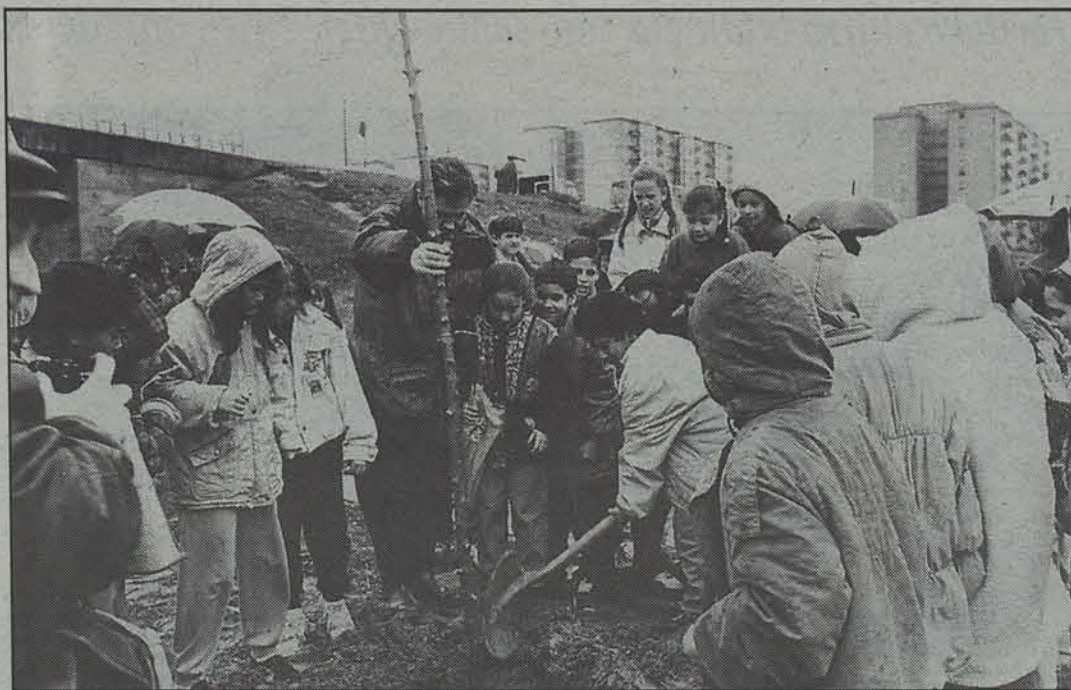
Zuhaitzaren Eguna ospatuko dute hilaren 25ean.

Tuterako Udaleko arduradunek kanpainaren aurkezpenean aipatu zuten, ingurugiroak egun bizi dituen arazoak ezagutarazi eta jendea sentsibilizatu nahi dute antolatutako ekitaldien bitartez. Hasteko, ekosiste-