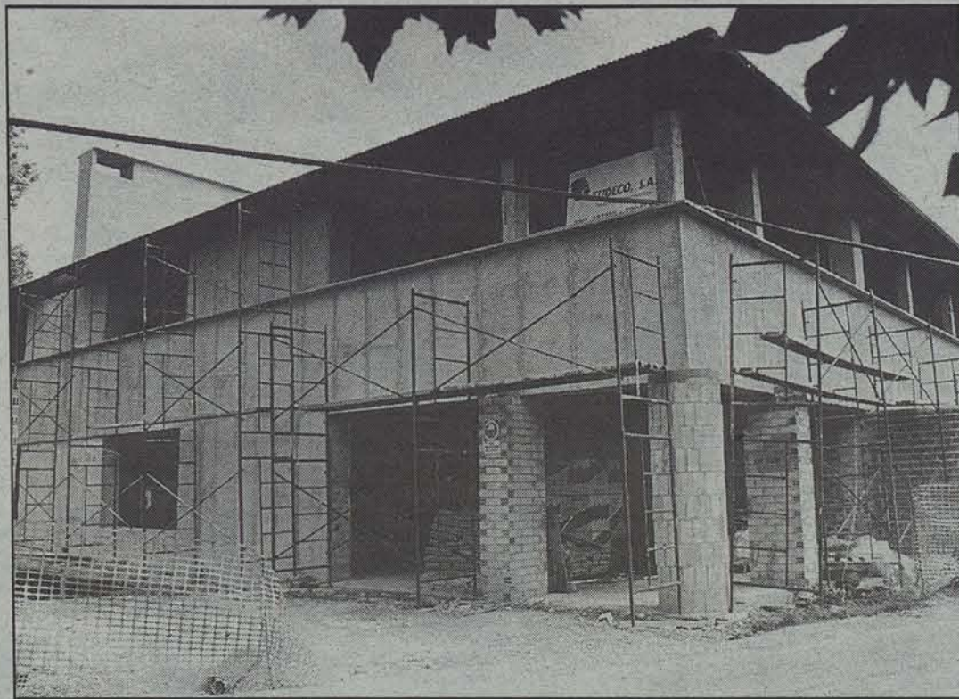
Fontellasko eraikina, artean amaitu gabe zela.