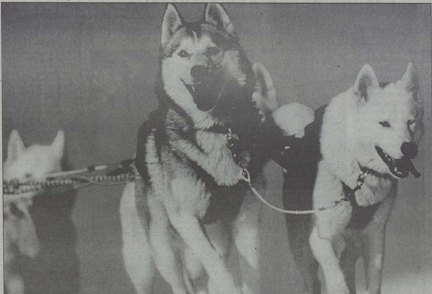
Txakurrak lerari tiraka. Pirenan 6 eta 12 txakur bitarteko taldeak eraman beharko dituzte musherrek.