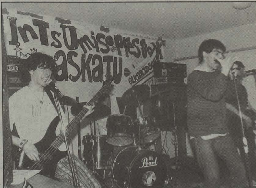
Deabruak Teilatuetan taldea Lesakan izanen da bihar.