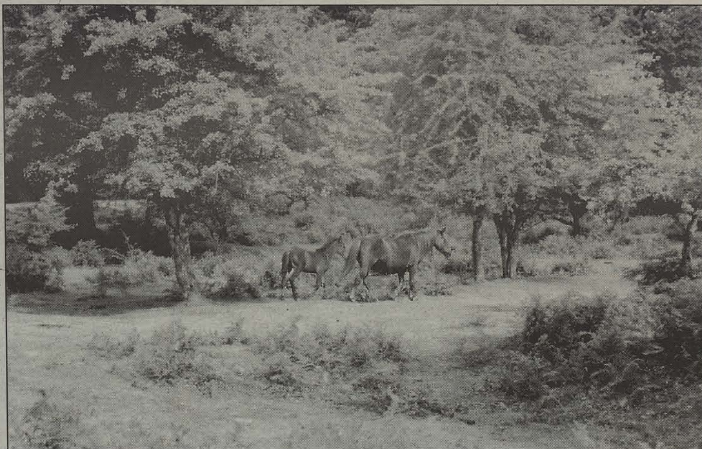
Urbasako paisaia ageri da argazkian.

Horrek ez du erran nahi, edonola, Nafarroako mendi eta basoak ustiatzen ez direnik. Nafarroako Basogintza Elkarteko ki-deek joan den astean plazaratu zuten, hain zuzen, «egurraren benetako merkatua sortzea» helburu duen Compostela-Bosque programaren barruan —urtearekin batera amaituko da— 496 milioi pezeta (19,84 milioi libera) inbertitu dituzte azken hiru urteetan, besteak beste, intxaurrondo landaketa esperimentalak abian jartzeko asmoz. Nafarroak 26 milioi pezeta (milioi bat libera inguru) sartu ditu programa honetan.