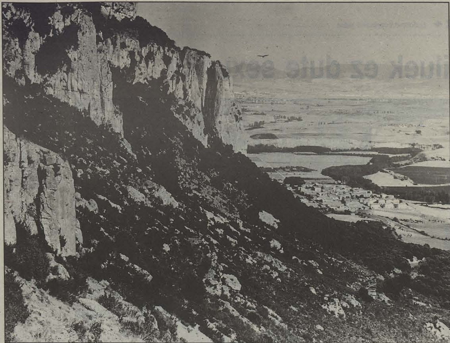
Basa Faunaren Babeserako Alde izendatuko dituzte Etxauriko haitzak.