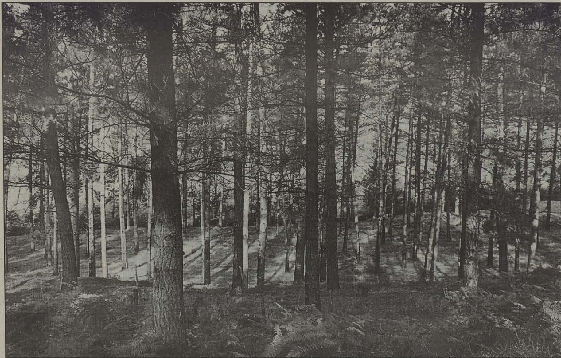
Bertzen ere badira pinuak, zuhaitz mota ugariaren artean.