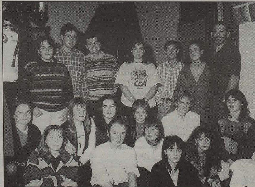
Herriz herri hamazazpi berriemaile ditu Guaixe -k. Argazkian horietako batzuk.