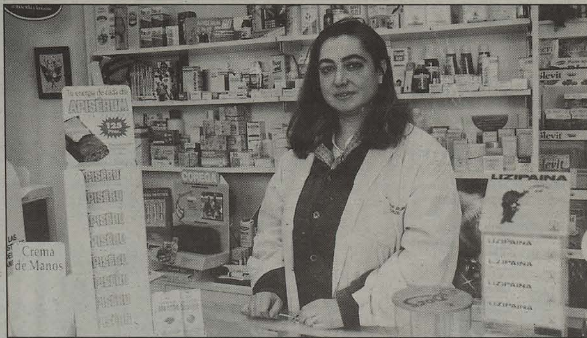
Dendak eta botikak dira, batez ere, emakume nafarrek eratzen dituzten enpresak