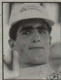
Miguel Indurain Txirrindularia

■ Miguel Indurain, Banesto taldeko txirrindularia omenduko du Tourrak Nafarroan zehar igaroko diren bi etapekin. Zuberoa, Nafarroa eta Lapurdi uztailaren 17an eta 18an zeharkatuko dituzte aipatu bi etapak. Jean-Marie Leblanc, Tourreko zuzendariak bi etapak aurkezteko asteartean egindako ekitaldian esan zuen Indurainek Tourrari eman dionagatik eta Tourreko talde antolatzailearen esker ona erakusteko igaroko direla herrialdeetik bi etapak. Atarrabiakoaren irudikoz, Nafarroako hiriburutik igarotzen diren bi etapak gogorak izanen dira eta batez ere bertan amaitzen dena, «oso mugitua izanen delako». Hala ere ez du uste presio berezia izango duenik Iruñean amaitzeagatik.