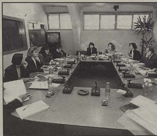
Emakume enpresariak batez ere zerbitzuetan alorrean egiten dute lan.

Iruñean eta zerbitzuetan egiten dute lan horietako gehienek