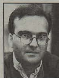
Aingeru Epaltza Idazle eta itzultzailea

■ Miguel Indurain, Banesto taldeko txirrindularia omenduko du Tourrak Nafarroan zehar igaroko diren bi etapekin. Zuberoa, Nafarroa eta Lapurdi uztailaren 17an eta 18an zeharkatuko dituzte aipatu bi etapak. Jean-Marie Leblanc, Tourreko zuzendariak bi etapak aurkezteko asteartean egindako ekitaldian esan zuen Indurainek Tourrari eman dionagatik eta Tourreko talde antolatzailearen esker ona erakusteko igaroko direla herrialdeetik bi etapak. Atarrabiakoaren irudikoz, Nafarroako hiriburutik igarotzen diren bi etapak gogorak izanen dira eta batez ere bertan amaitzen dena, «oso mugitua izanen delako». Hala ere ez du uste presio berezia izango duenik Iruñean amaitzeagatik.