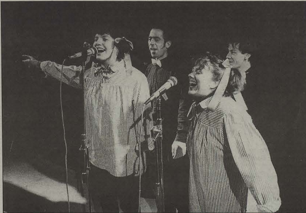
Gasteiz Antzerkiaren lanaz gain, mota guztietako antzeztelanak ikusi ahal izango dira.