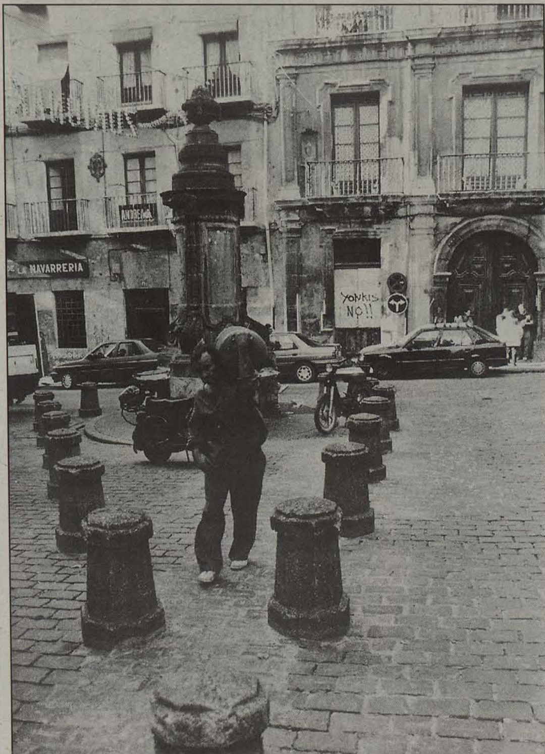
Navarrerriko burguak euskara izan zuen ama hizkuntza.