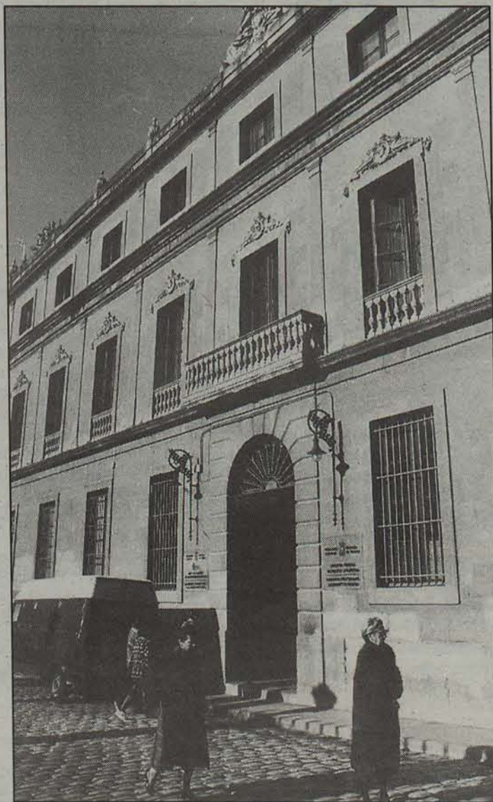
Hizkuntz Politikatik zuzentzen dira euskarari buruzko gaiak.