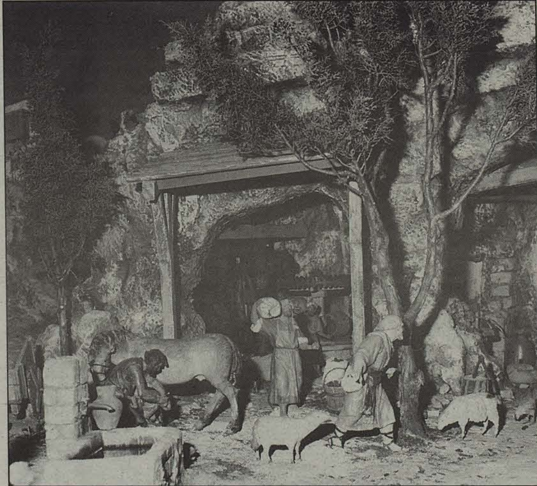
Gabonak direla-eta ekitaldi anitz antolatu dute Zangozan.

Olentzarorekin zerikusirik duten ekitaldi gehiago izanen da abenduan zehar. Hilaren 15ean, hain zuzen, Olentzarok Euskal