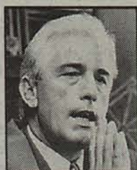
Gabriel Urralburu Nafarroako Gobernuko lehendakari ohia