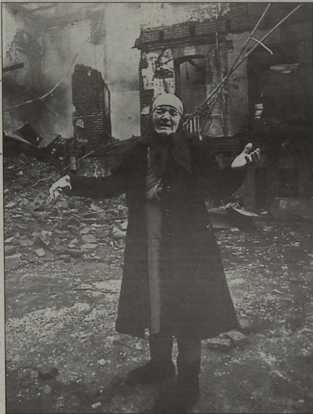
Azaroaren 21ean sinatu zuten Bosniako bake akordioa.