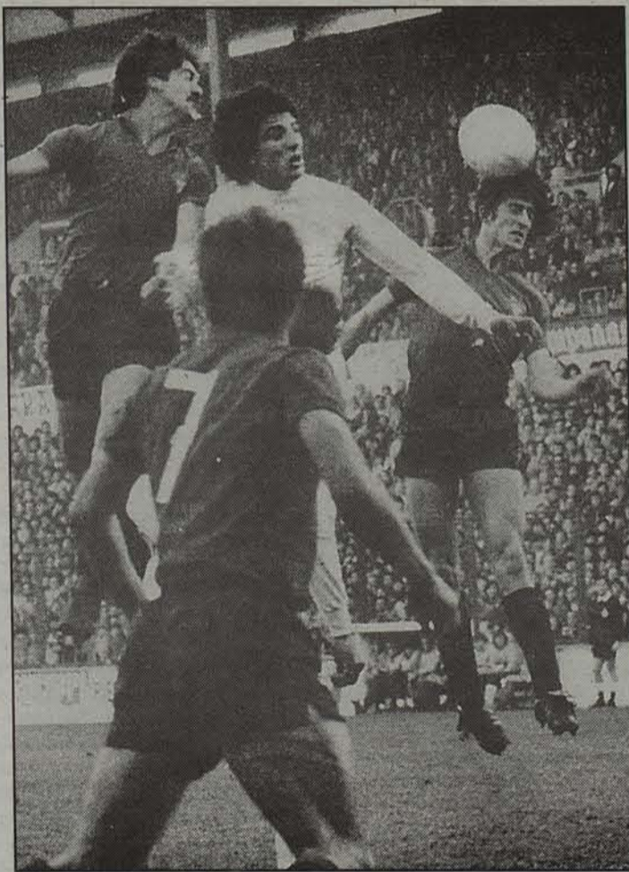
Etxeberria, Irigibel eta Martin jokalariek osatu dute Osasunaren historiako aurrealde onena orain arte.

Bizkairekin, hala ere, zelaitik kanpoko arazo gertakizunetz mintzatu gara. 1993-1994. ur-