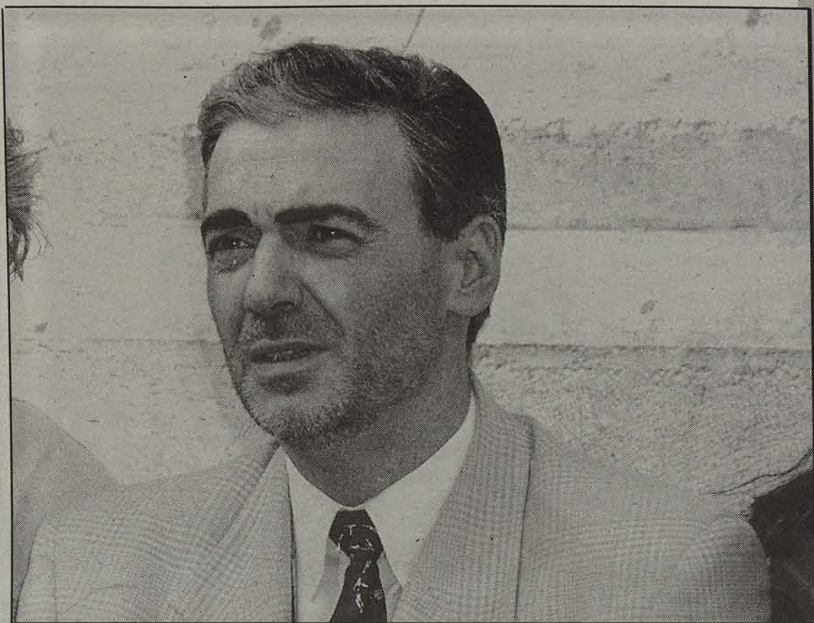
Ustarozen taldeak 10 urte beteko ditu datorren urtean.

Aste anitz eman ditut gose greba egin ala ez pentsatzen. Bakarrik egin behar izan dut gogoeta gainera, beste norbaitekin hitz eginez gero, nire asmoa bertan behera uzteko konbentziturik ninduela banekien eta. Hasieratik argi izan dut hartutako erabakia oso larria zela, baina CBNren egoerak ez zuen beste irtenbiderik uzten. Oso burugogorra naiz, baina, eta arazoa konpondu edo nire gorputzak iraun arte aurrera jarraitzeko prest nengoen. Egia erran, erantzuna hain azkar ja-