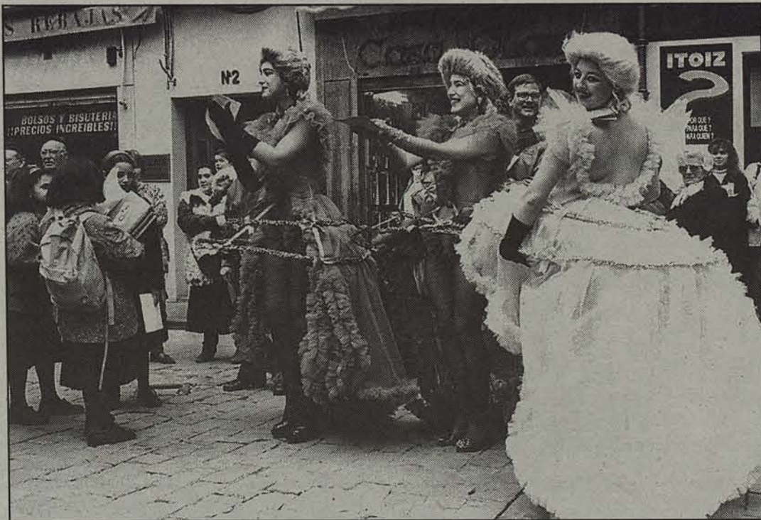
Hamaika ekitaldi antolatu dituzte Txantreako gazteek.

Igandean, bestalde, txangoa antolatu dute Gazte Astea prestatu duten taldeek. Baztandik Bidarrainoraino joango dira mendizaleak. Astelehenean jai hartu dute antolatzaileek, baina asteartean, arratsaldeko zortzietan, Xabier Gofii mendizale nafarrak inken erret bideari buruzko diapositiba emanaldia antolatu du. Bideko Amabirjina Institutuan izanen da.