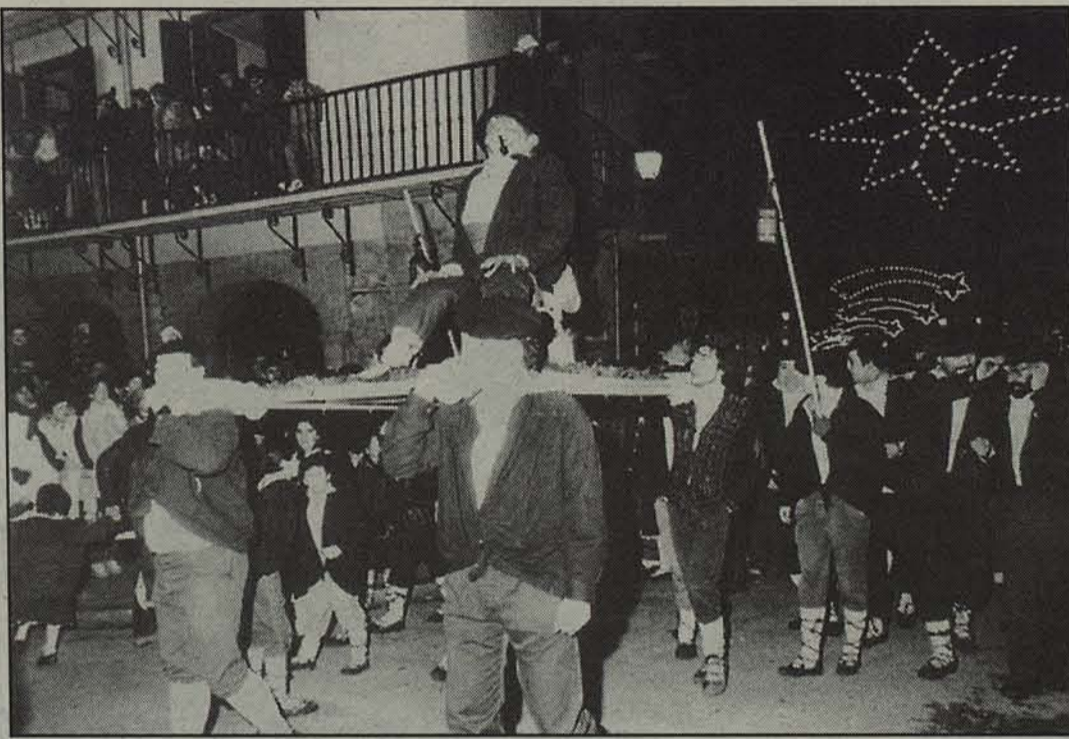
Olentzeroren 25. urteurrena ospatuko dute Zangozan.