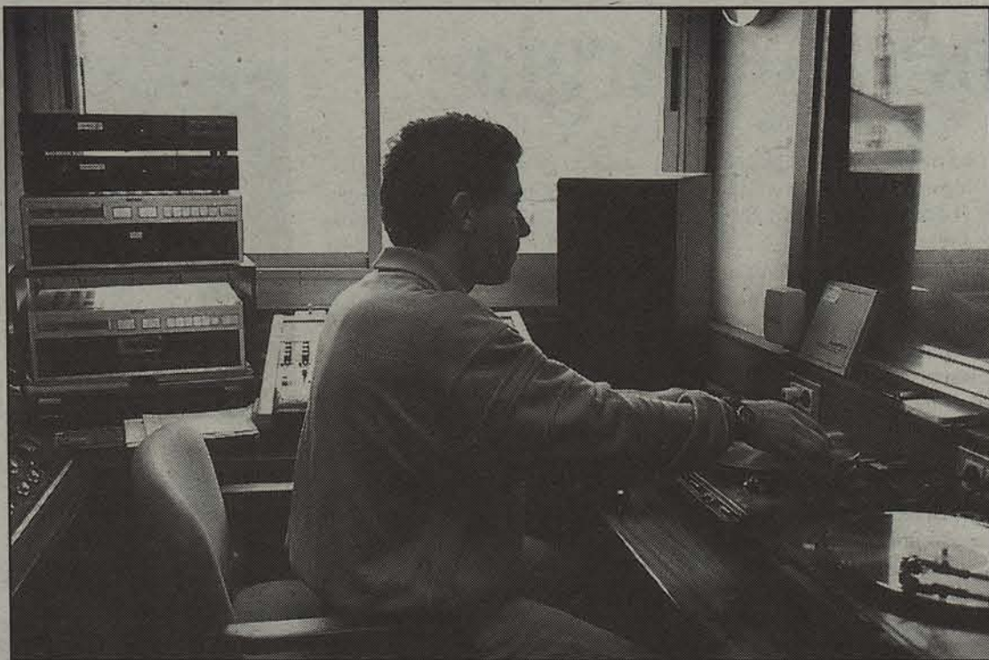
Astelehenean hasiko da Euskalerrria Irratiaren programazio berria.

Euskalerrria irratiaren esparrua Iruñerria da, baina hutsune batzuk baditu. Jakina, antena toki seguruan jarri behar izan dute