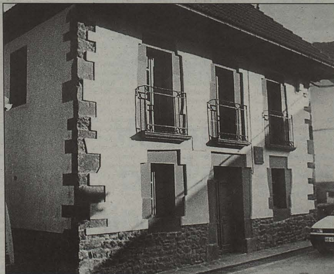
Liburuxka Pablo Mandazen Fundazioaren laguntzarekin burutu da.